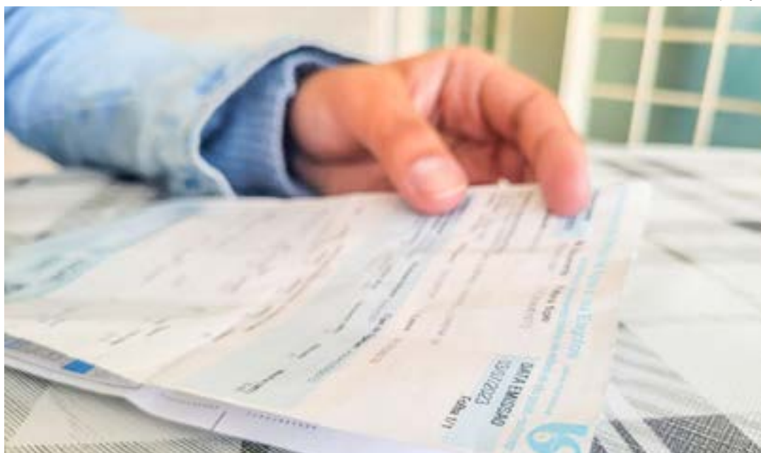
Contas de água que passam a registrar serviço a famílias em grupos de alta vulnerabilidade social na região

Para garantir o benefício é preciso que o usuário este- ja com os dados do CadÚnico