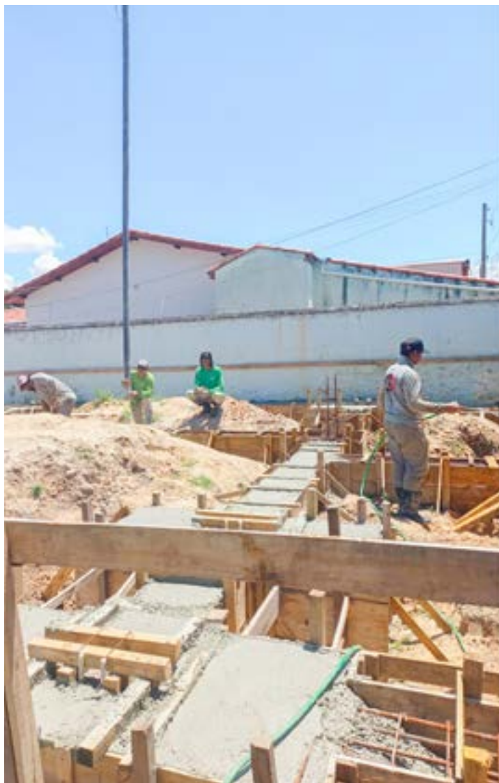
Obra do futuro espaço, que foi viabilizado por meio de um repasse de R$ 1 milhão feito pela Prefeitura; ação amplia atenção a famílias