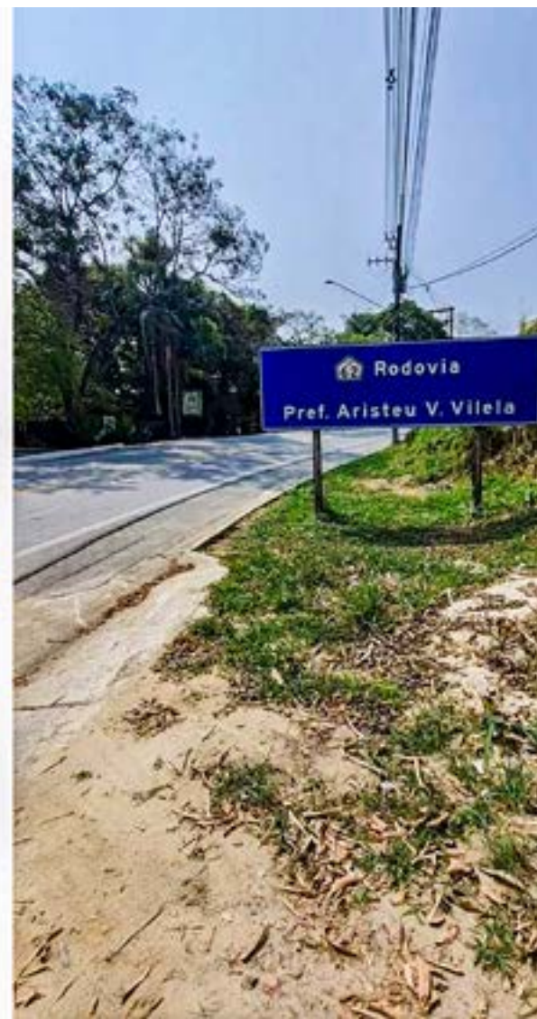
Trecho da rodovia Prefeito Aristeu Vieira Vilela, que liga Guaratinguetá a Lorena; queda de estrutura do muro de arrimo aumenta risco para quem passa pela Estrada Velha

por aqui com a minha família, tanto de carro quanto a pé, e o medo é constante. Antes, minha filha podia andar tranquila, mas agora nem 'deixo ela' (sic) chegar perto", desabafou.