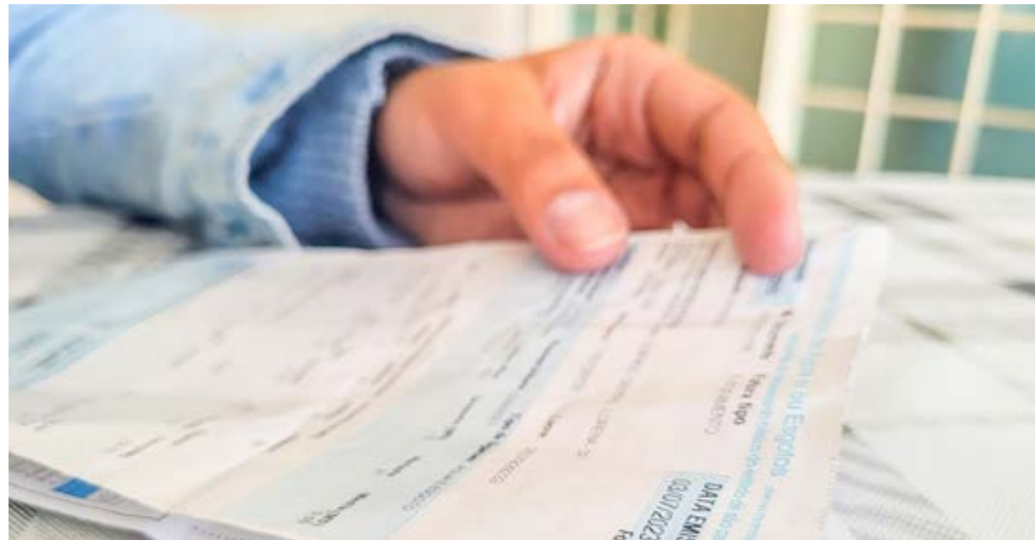
Contas de água que passam a registrar serviço oferecido pela Sabesp a famílias paulistas em grupos de alta vulnerabilidade social na tarifa mensal

Com a nova regra, famílias com consumo na faixa básica (até 10m³/mês) poderão ter um desconto de até 78% em relação à tarifa residencial padrão. A tarifa vulnerável é destinada às famílias com renda familiar per capita de até R$ 218, enquanto a tarifa social é para aquelas com renda entre R$ 218 e meio salário mínimo, cerca de R$706, por pessoa.