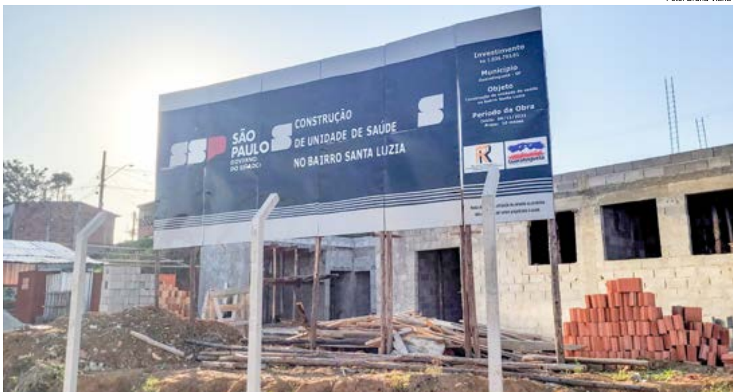
Construção de unidade de saúde para atender moradores do Santa Luzia; Prefeitura garante novo aporte para investimento no setor

Também foi aprovado um projeto de lei no valor de R$1,3 milhão, verba que deve ser distribuída em R$ 500 mil para a Santa Casa, R$ 500 mil para credenciamento em consultas e R$ 300 mil para insumos.