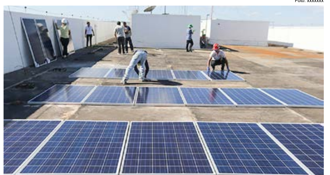
Trabalho de implantação de sistema solar no teto da Câmara de Ubatuba, que busca maior economia

Além da questão da economicidade, a nota do Legislativo ressalta que outro fato que motivou a mudança foi que a energia solar é uma fonte renovável e que não emite poluentes, o que contribui para a preservação do meio ambiente.