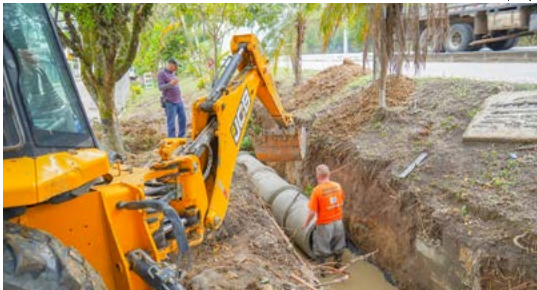
Trabalho de drenagem no bairro do Olaria do Simão, em Lorena; ação tem investimento de R$ 40 mil

Segundo o Executivo, a equipe da secretaria de Manutenção e Serviços Municipais mantém nesta semana na via de entrada do bairro a obra que prevê a substituição de um trecho de 17 metros da rede de galeria de