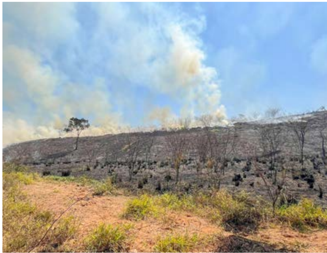
Área atingida por chamas, em incêndio apontado como criminoso; RMVale já registrou 133 focos de incêndio

Em Guaratinguetá, o Santuário de Frei Galvão está criando uma brigada de incêndio para evitar novas ocorrências na área verde da Igreja. No último dia 31, um incêndio criminoso queimou