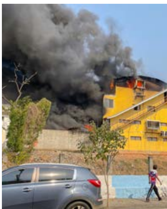
Incêndio em loja de tecidos na avenida Padroeira; ação de Bombeiros e Defesa Civil seguiu na noite