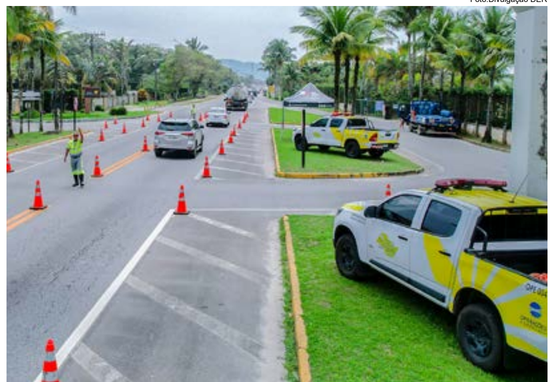
Interdição parcial da pista no trecho de Caraguá para realização de obra em estrada de acesso à região

O trabalho de adequação do pavimento e do sistema de sinalização do trecho paulista da Rio-Santos teve seu pontapé inicial dado pelo DER em 16 de outubro do ano passado. A ação prevê o recapeamento de 56,1 quilômetros da rodovia, sendo 28,3 quilômetros no trecho de Ubatuba e 27,8 quilômetros no de Caraguatatuba. Prevista para ser concluída até o fim do ano que vem, a iniciativa é viabilizada através da segunda fase do programa estadual Estrada Asfaltada, que investe R$ 2,9 bilhões em 127 obras de melhorias em 2,1 mil quilômetros de rodovias, que cortam 145 municípios.