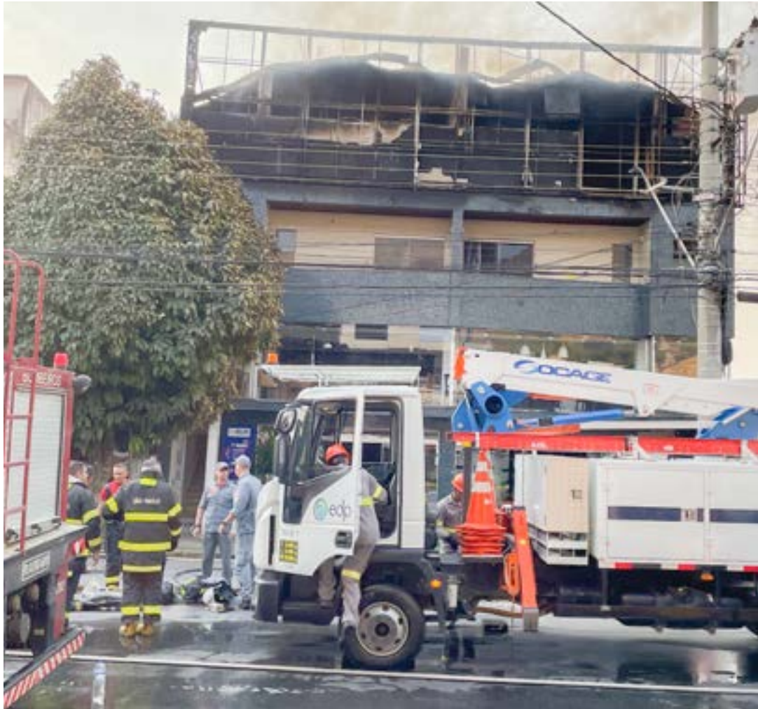
Ação em conjunto para combater incêndio em loja de tecidos na avenida Padroeira do Brasil, em Aparecida