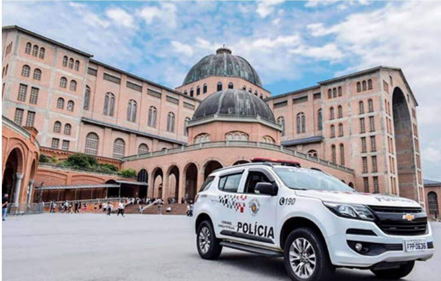
Apresentação da Operação Romeiro deste ano, iniciada na terça-feira, em planejamento que foca período de grandes eventos até dezembro