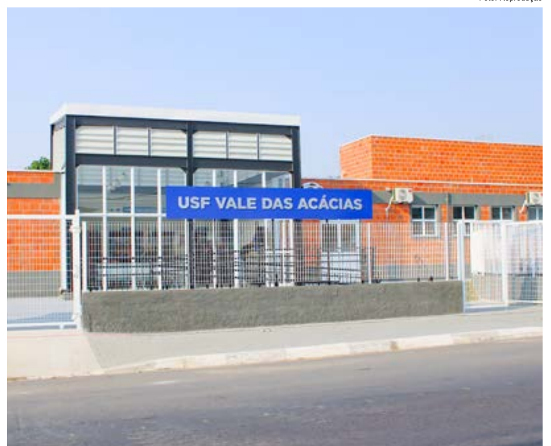
Estrutura da nova Unidade de Saúde Família no Vale das Acácias; obra teve investimento de R$ 1,804 milhão

A implantação da USF do Vale das Acácias integra um pacote de obras no setor que até o momento garantiu as reformas das ESF’s (Estratégias de Saúde da Família) dos bairros Campinas, reinaugurada no último dia 21, Araretama e Bela Vista, reabertas no fim do ano passado, e as construções das UBS’s (Unidades Básicas de Saúde) dos bairros Parque das Nações e Jardim Morumbi, inauguradas em abril e junho deste ano. Previstas para serem concluídas até o fim deste ano, as demais ações do pacote são as construções das UBS’s dos bairros Maricá, Mantiqueira e Santana, das ESF’s dos bairros Cidade Jardim, Shangri-lá e Santa Cecília, as reformas da UBS do bairro Terra dos Ipês 2 e a ampliação e revitalização da ESF do bairro Feital e do Ciaf (Centro Integrado de Assistência à Família) na região central da cidade.