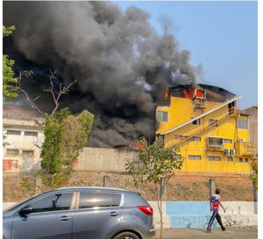
Fumaça preta toma o céu da cidade no meio da tarde desta quinta-feira e assusta quem passou pela região