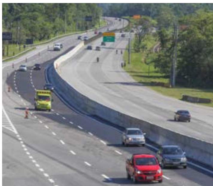
Movimentação na SP-55, que recebe novas obras de infraestrutura

Iniciado em 16 de outubro do ano passado pelo DER (Departamento de Estradas de Rodagem), o serviço de adequação da rodovia SP-55 avançou para o trecho que engloba os km 56 e 112, no trecho de Caraguatatuba. A previsão estadual é que devido a presença de operários e maquinários na pista, a estrada permaneça parcialmente interditada até a sexta-feira, 2 de agosto. O DER e a Prefeitura de Caraguatatuba orientam os motoristas e motociclistas a