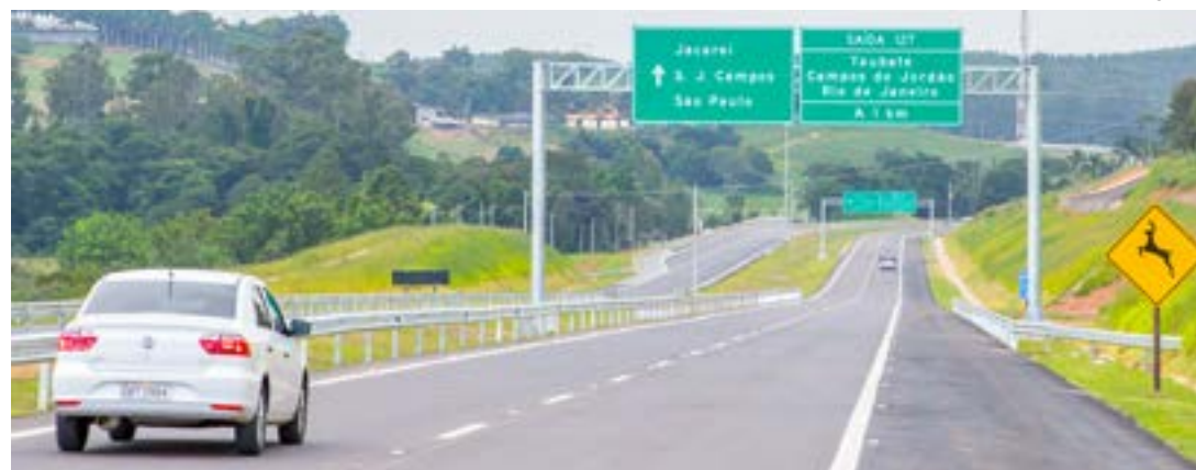
Carvalho Pinto, foco de investimento anunciado pelo governador Tarcísio de Freitas; foco no turismo

Tarcísio de Freitas destacou projeto dividido em duas etapas, com primeira até Aparecida; medida tenta desafogar tráfego