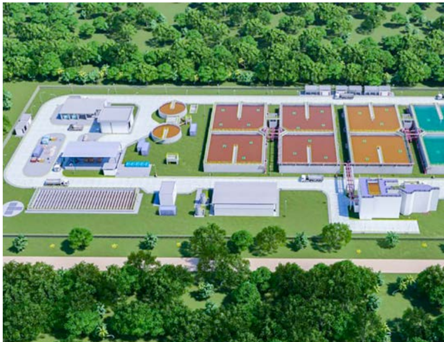
Planta da estação de tratamento de esgoto que será construída em megaobra anunciada em Ubatuba; ação atende 18 bairros da cidade