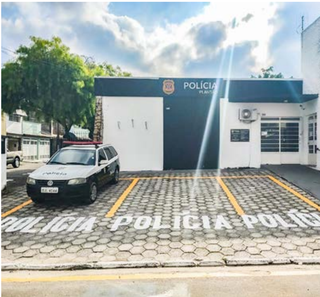
Plantão policial em Guaratinguetá; atenção sobre a cidade aumenta após índice preocupante de violência

Segundo dados da secretaria de Segurança Pública do Estado de São Paulo, a RMVale (Região Metropolitana do Vale do Paraíba e Litoral Norte) teve 179 moradores assassinados entre janeiro e junho, sendo 171 vítimas de homicídio doloso, quando existe a intenção de matar, e oito de latrocínio, roubo seguido de morte. O montante supera em 7% o registrado no mesmo período do ano passado, que foi de 166, sendo 158 vítimas de homicídio doloso e oito de latrocínio.