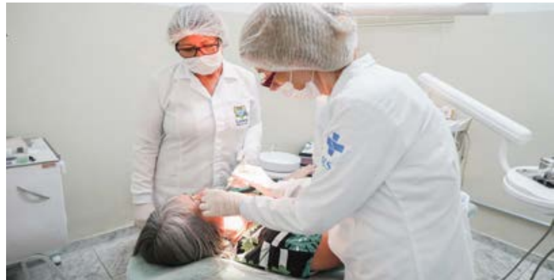
Atendimento na rede municipal de Saúde, reforçado por programa lançado nesta semana pela Amvale