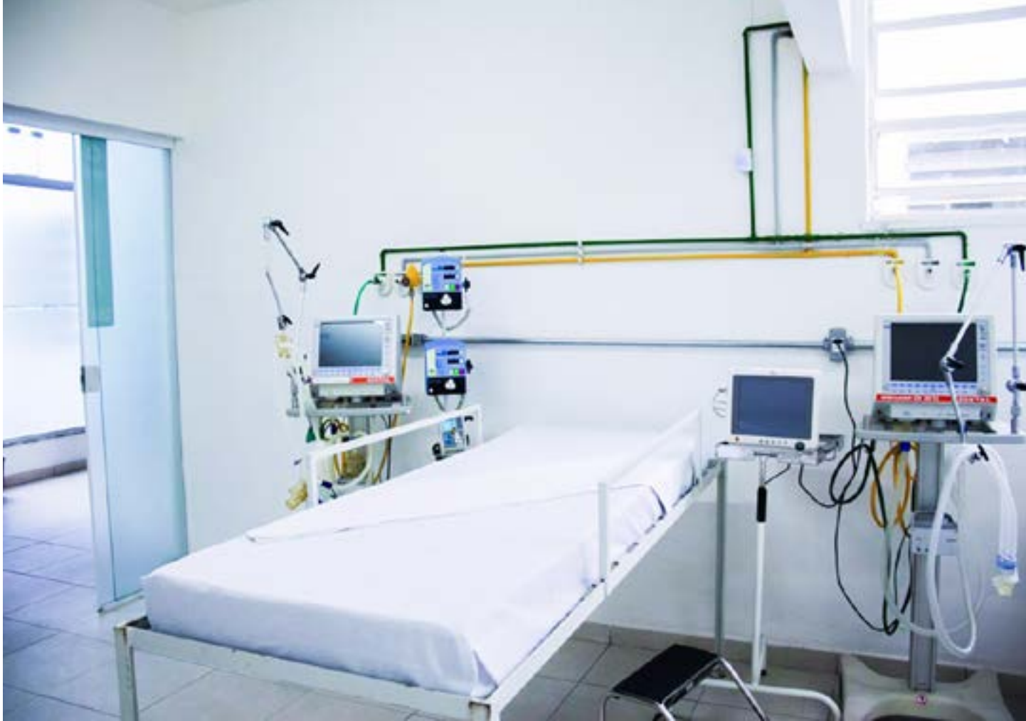
Um dos leitos da UPA em Guaratinguetá; unidade é mantida com recursos da Prefeitura e aguarda liberação de Ministério da Saúde