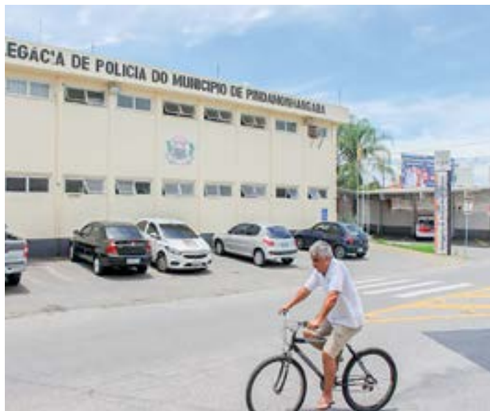
A Delegacia de Pinda, onde caso de menores passa por investigação

Além de alegar que possuía o revólver por segurança, o menor informou que não tinha a intenção de alvejar a namorada, já que havia re-