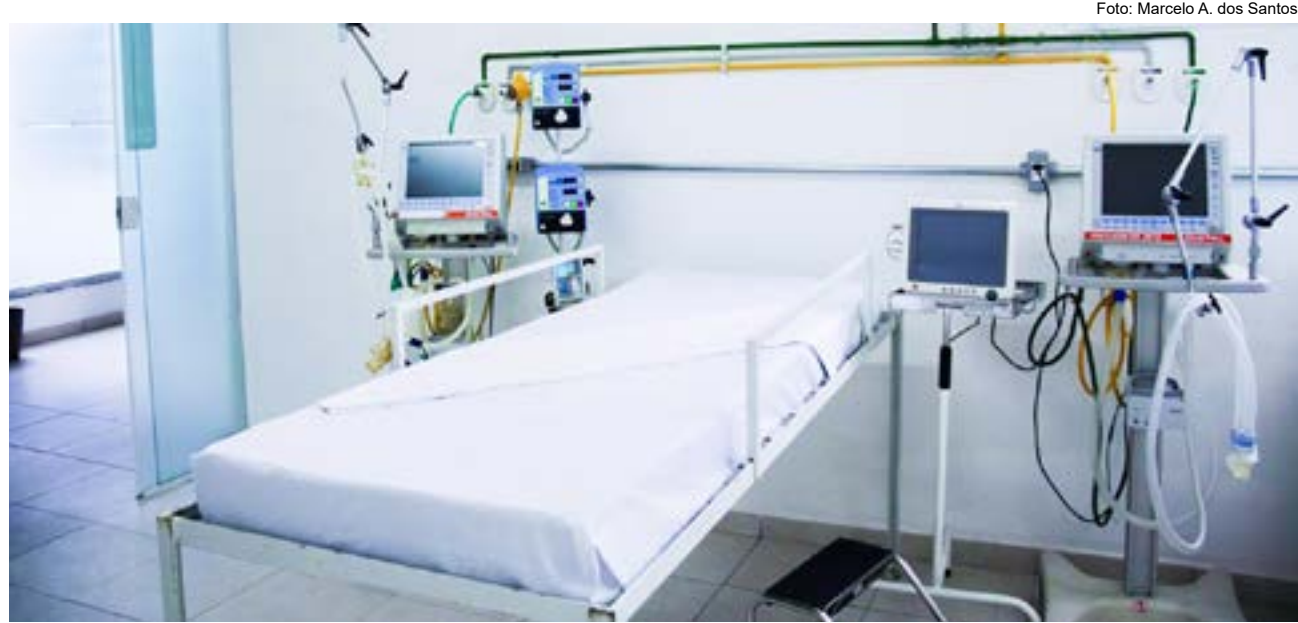
Leito da UPA em Guaratinguetá; unidade é mantida com recursos da Prefeitura e aguarda liberação de Ministério da Saúde

Saúde aguarda portaria do Ministério da Saúde para liberação de recurso