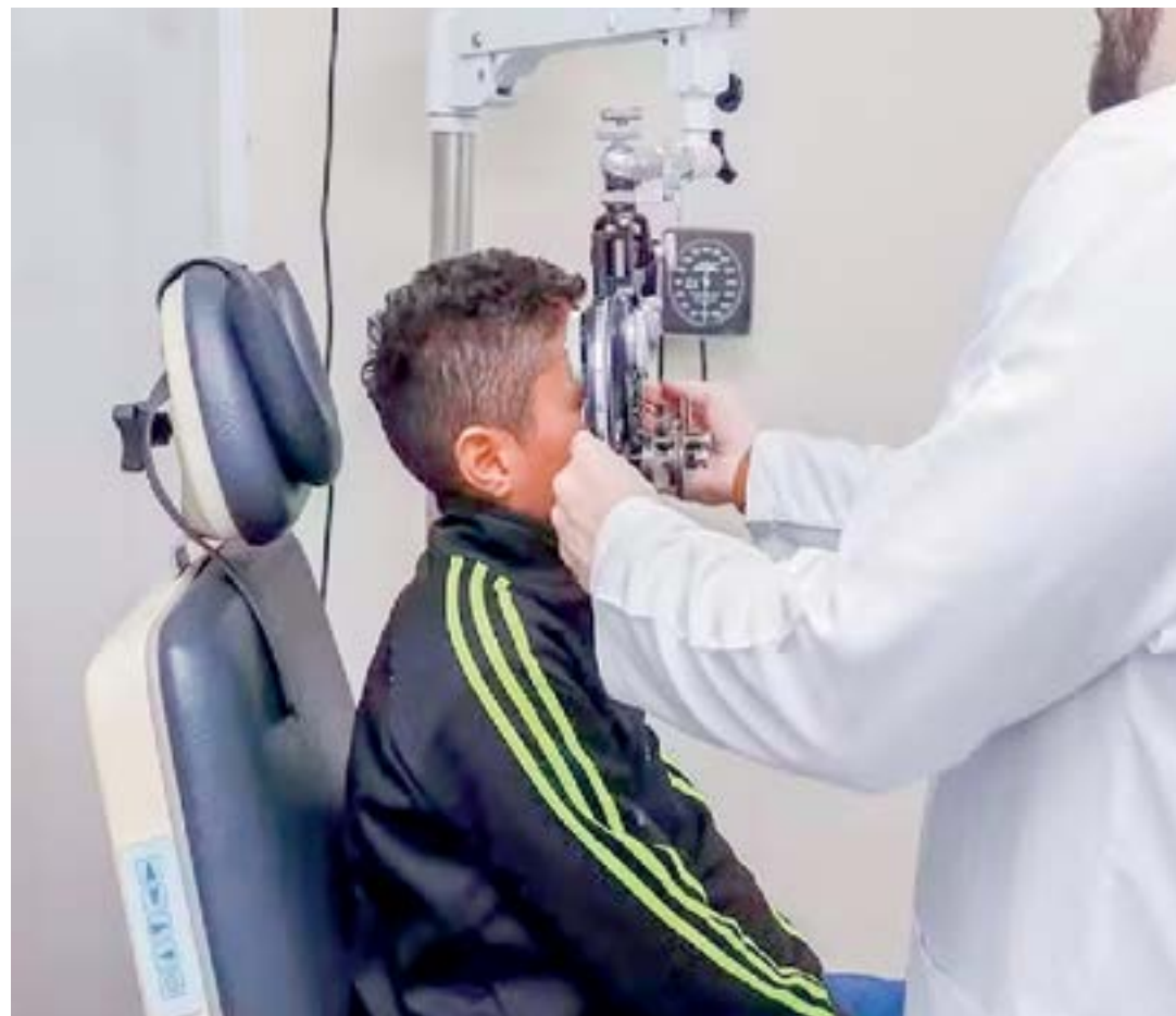
Atendimento oftalmológico; mutirão gera expectativa de chegar a duzentos moradores de Cachoeira