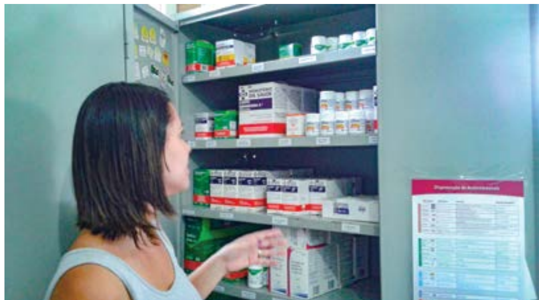
Farmacêutica confere medicamentos disponíveis na nova farmácia implantada para o atendimento no PS

A reportagem do Jornal Atos solicitou à Prefeitura de Ubatuba informações sobre o valor do investimento aplicado na implantação e manutenção da farmácia 24 horas, mas nenhuma resposta foi encaminhada até o fechamento desta edição.