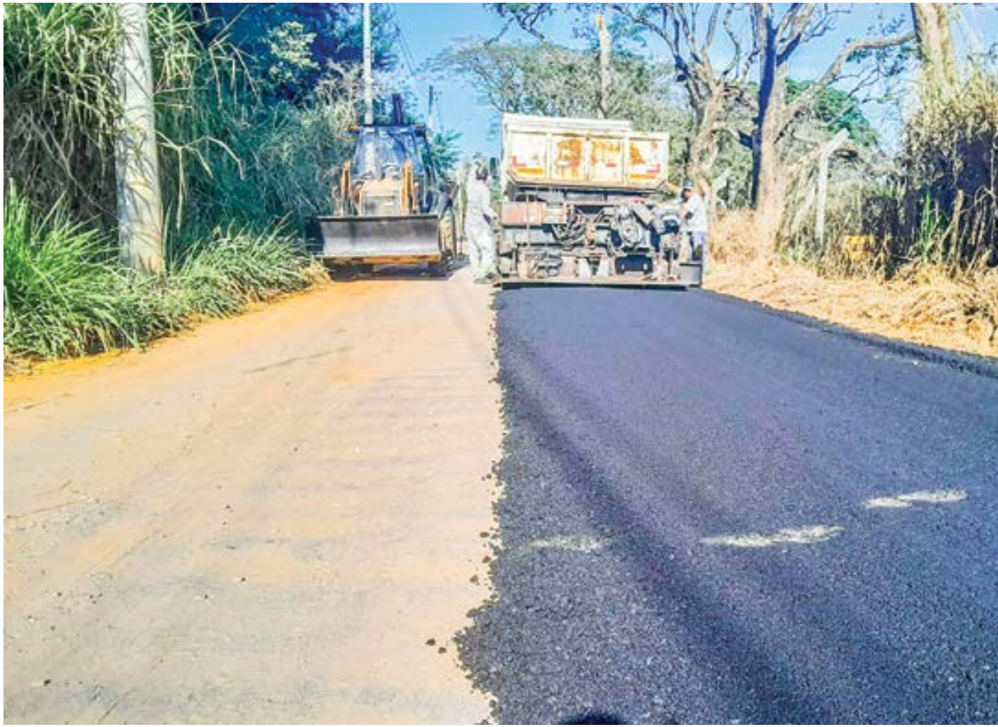
Trabalho de pavimentação na Estrada do Pinhão do Una; R$ 1,7 milhão investidos na recuperação de vias garante ação com foco na zona rural

A melhoria da estrada é viabilizada através de um investimento de cerca de R$1,7