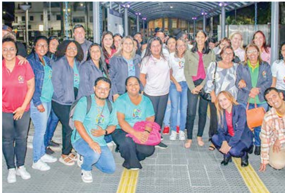
Funcionários e jovens atendidos pela Apae comemoram repasse de R$ 1 milhão para criação de espaço