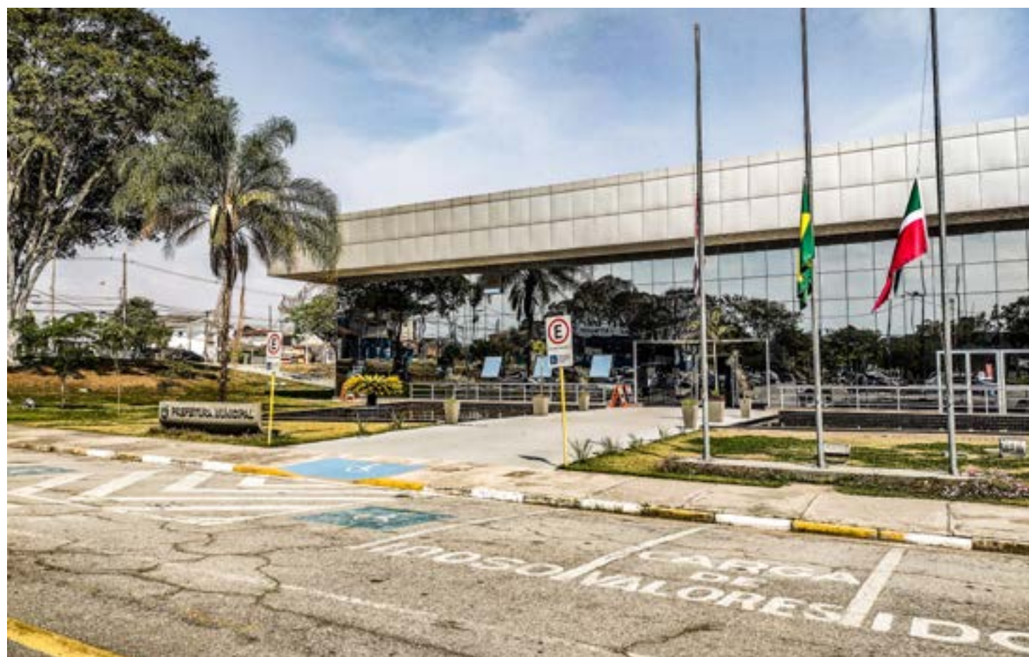
A sede da Prefeitura de Pindamonhangaba, que abriu vagas para contratações de estagiários; guará também anuncia processo seletivo

engenharia agrônoma, engenharia ambiental, engenharia civil, engenharia elétrica, fonoaudiologia, história, medicina veterinária, museologia, pedagogia, psicologia, relações públicas, tecnologia em gestão de trânsito, tecnologia em recursos humanos, tecnologia em gestão comercial, tecnologia em gestão financeira e tecnologia em logística.