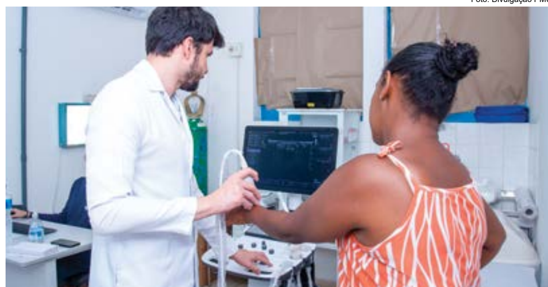
Atendimento durante mutirão na rede municipal de Ubatuba; secretaria tenta reduzir fila na rede municipal

Com duração de três fins de semana, ação começa neste sábado; medida busca agilizar serviços da rede pública de saúde