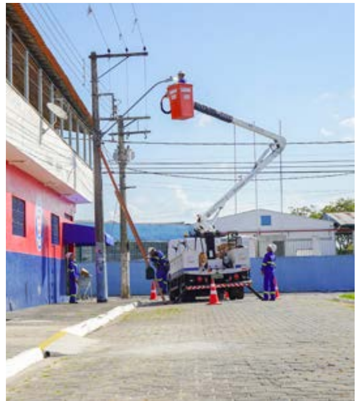
Troca de lâmpadas na Vila Geny; cidade quer 100% até o final de 2024

A expectativa municipal é que o trabalho de modernização dos 38% dos postes restantes seja concluído até o fim deste ano. Além do Bairro da Cruz, a ação contemplará todos os pontos de luz dos bairros Cidade Industrial, Nova Lorena, Olaria, Parque Mondesir, Santa Edwiges, Vila Celeste, Vila Geny, Vila Nunes e Vila Zélia.