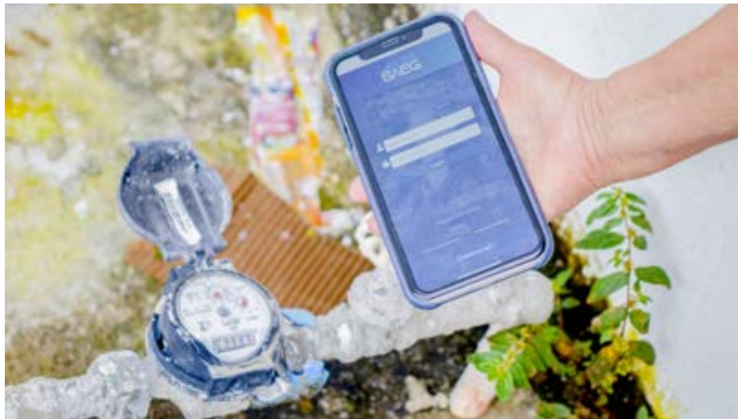
Leitura com uso do aplicativo do Saeg; sistema abre condição para famílias com dívidas no forçamento

Promovido pelo Saeg pelo quarto ano consecutivo, o Feirão Junino de Débitos será realizado a partir da próxima segunda-feira (17) até o dia 28. A expectativa da direção