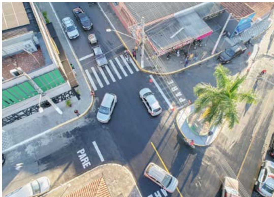
Vista aérea de trecho do Bairro da Cruz, um dos atendidos em pacote de pavimentação nos últimos meses

A verba de R$ 15 milhões foi repassada pelo governador Tarcísio de Freitas (Republicano). “Nós agradecemos o governador por essa parceria, que é muito importante para a cidade. O Estado já nos repassou R$150 milhões em verbas para investimento em todas as áreas e a Prefeitura também investiu, como contrapartida, mais de R$20 milhões”, destacou Ballerini.