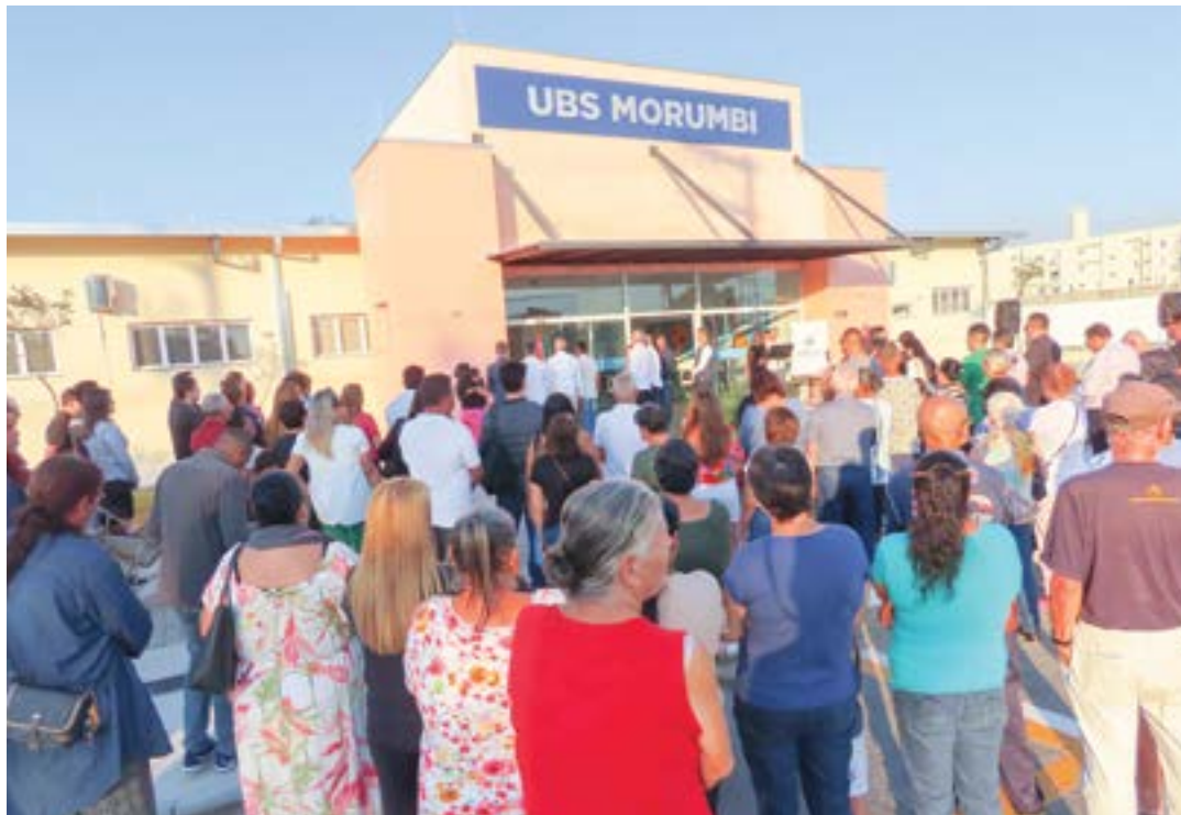
Moradores acompanham entrega de UBS para reforçar o atendimento para a saúde na região do Morumbi

Erguida pela empresa Multivale Construtora Ltda após pouco mais de um ano de