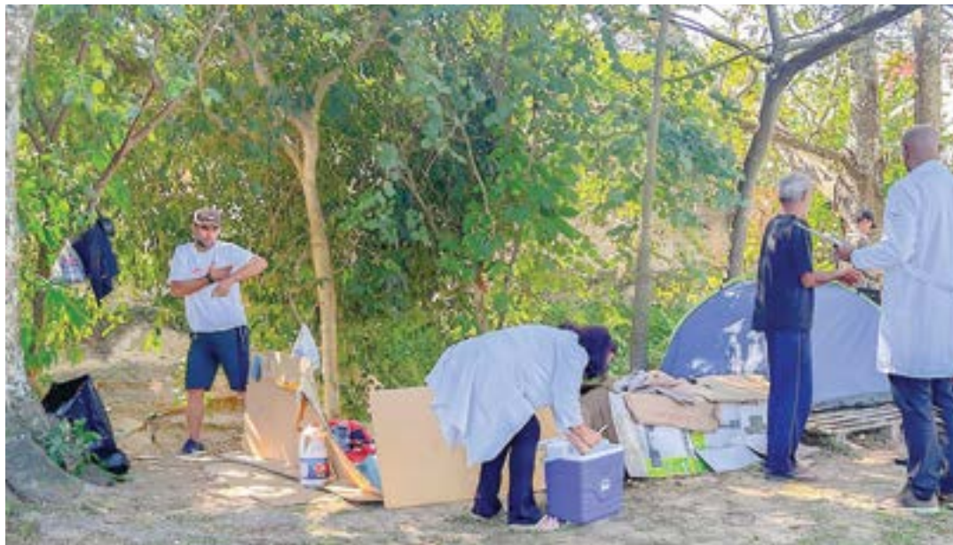
Abordagem realizada pela equipe de assistência social, com foco em pessoas em situação de rua de Lorena

Em nota oficial, o Executivo informou que equipes da secretaria de Assistência e Desenvolvimento Social e da secretaria de Saúde pro-