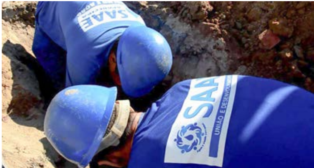
Trabalho realizado pela equipe do Saae; autarquia tem concurso aberto para contratação em Aparecida

Os cargos em disputa são para ajudante de saneamento; auxiliar de serviços gerais; calceteiro; coletor de resíduos; encanador de saneamento; jardineiro; pedreiro; serralheiro; controlador de acesso; eletricista; leiturista; motorista; motorista operador; operador de máquinas pesadas; assistente administrativo; mecânico de manutenção; operador de técnico de ETA; operador técnico de ETE.; telefonista; analista administrativo; analista de tecnologia da informação; contador; controlador interno;