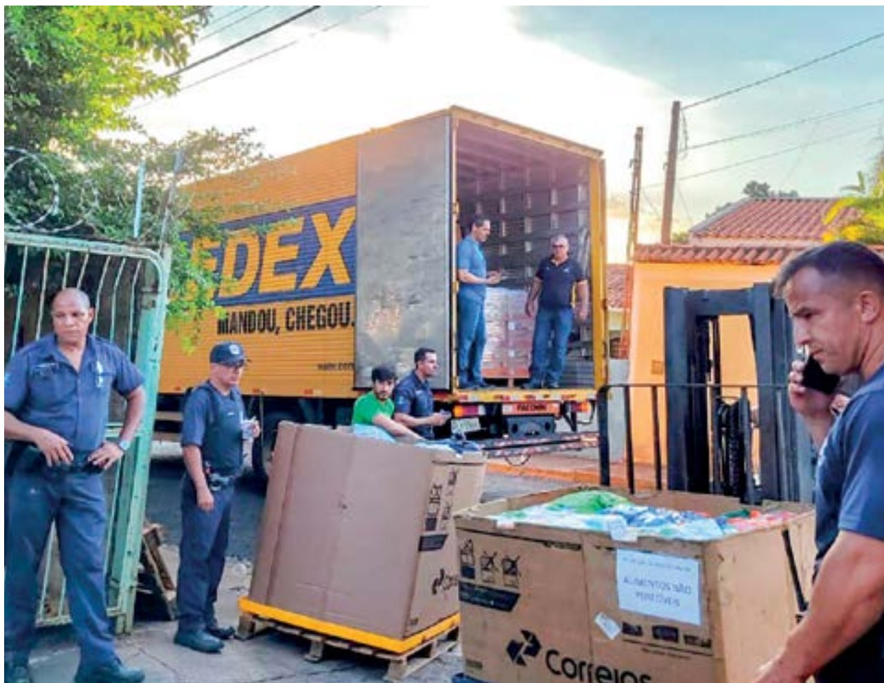
Doações por meio de campanha dos Correios por todo país; região mantém campanhas em ação do poder público e privado