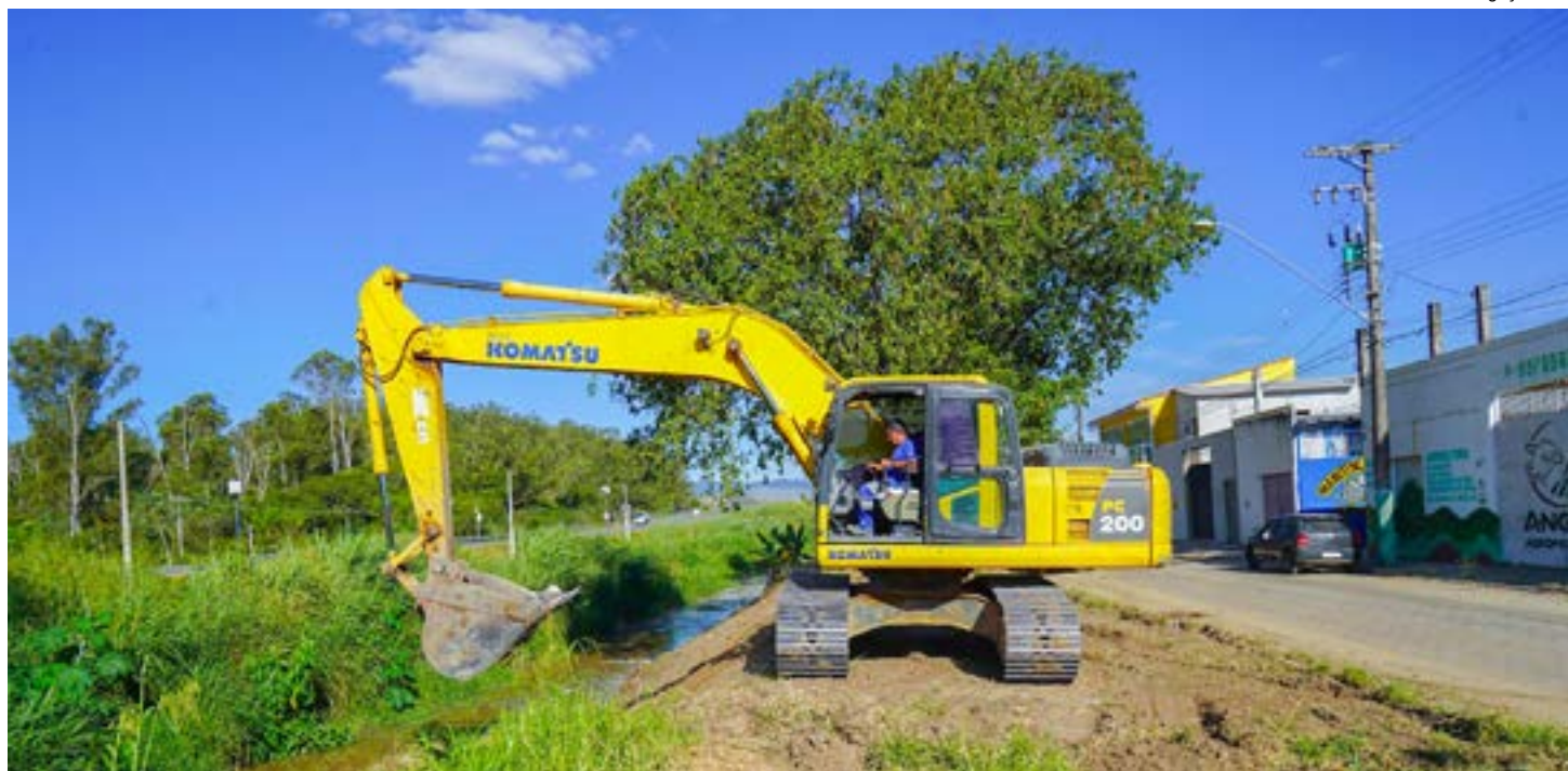
Trabalho realizado no trecho da Vila Nunes do rio Mandi, na última semana; Prefeitura mantém atenção em outras áreas contra alagamentos

Segundo a administração municipal, a equipe da secretaria de Manutenção e Serviços Municipais, desde o início da semana passada, promove o desassoreamento de trechos do Rio Mandi que corta os bairros Vila Brito e Vila Nunes, trabalho que consiste na remoção de resíduos acumulados no fundo do rio, possibilitando