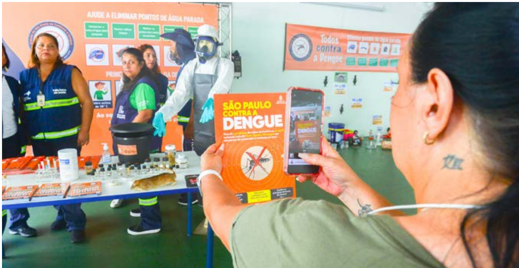
Trabalho de prevenção contra a dengue realizadas nas cidades paulistas; secretarias de Saúde da região recebem novos lotes de imunizantes da Qdenga após avanço da doença