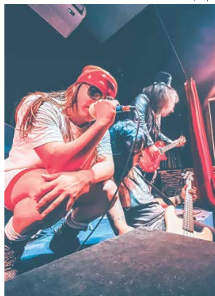
Deep Illusions, cover do Guns N' Roses, que estará no primeiro Big Rock

Evento tem tributos a grandes nomes do estilo, com shows, foodtrucks, exibição de documentários e exposição de carros