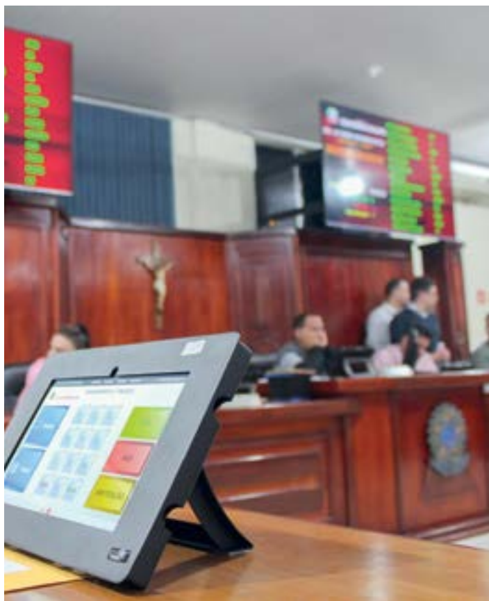
Sessão em Cachoeira; concurso cancelado e procura por empresa

O concurso teve as inscrições abertas no dia 26 de março, com o objetivo de contratar oito cargos imediatos e três para cadastro reserva. Eram oferecidos cargos de auxiliar de serviços gerais, auxiliar de redação, contador, controle interno, escriturário, motorista legislativo, ouvidor, procurador jurídico e segurança. As vagas eram para os níveis de ensino fundamental, médio e superior. O valor das inscrições era de R$ 50 (ensino fundamental e médio) e