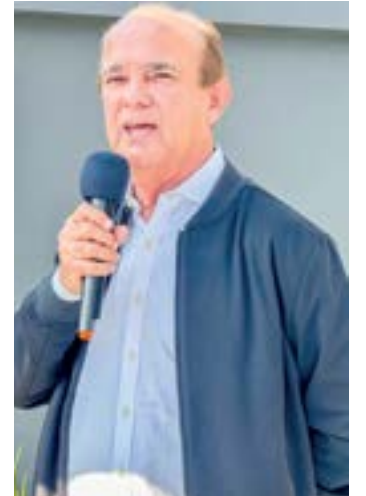
Ballerini, com apoio a empresas

A Prefeitura de Lorena vai doar áreas para três empresas que operam no município sem sede própria. A Câmara aprovou, na segunda-feira (13), os projetos que autorizam as doações. A primeira empresa contemplada é a Macbare Simuladores de Voo Indústria e Comércio Ltda, que receberá uma área de 900 m 2 na rua Machado de Assis, na Vila Zélia.