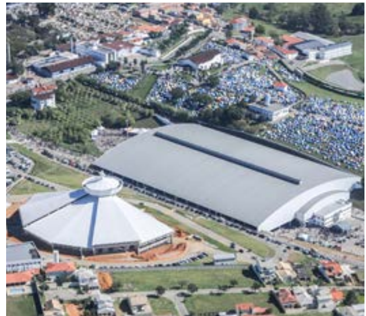
Vista aérea de parte da Comunidade Canção Nova; fim de investigação