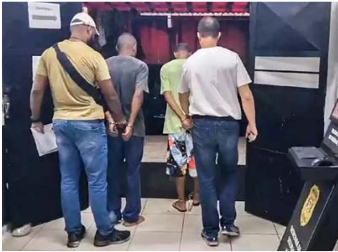
Acusados são levados pela após operação policial no início desta semana, em Pinda; menor confessou crime