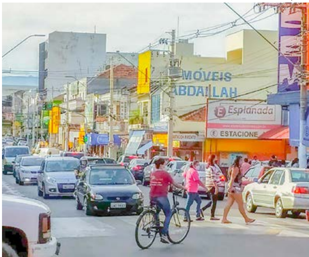
Movimentação no Centro de Pinda; projeto permite alterações no processo de registro de novas empresas

Anunciada pelo governador Tarcísio de Freitas (Republicanos), no fim de novembro do ano passado, a criação do Facilita SP permite aos municípios inscritos alterações no processo de registro de novas empresas, garantindo o fim da obrigatoriedade da emissão de alvarás e licenças para o funcionamento de empreendimentos pertencentes a mais de noventa atividades econômicas consideradas de baixo risco para acidentes, como escolas de idiomas