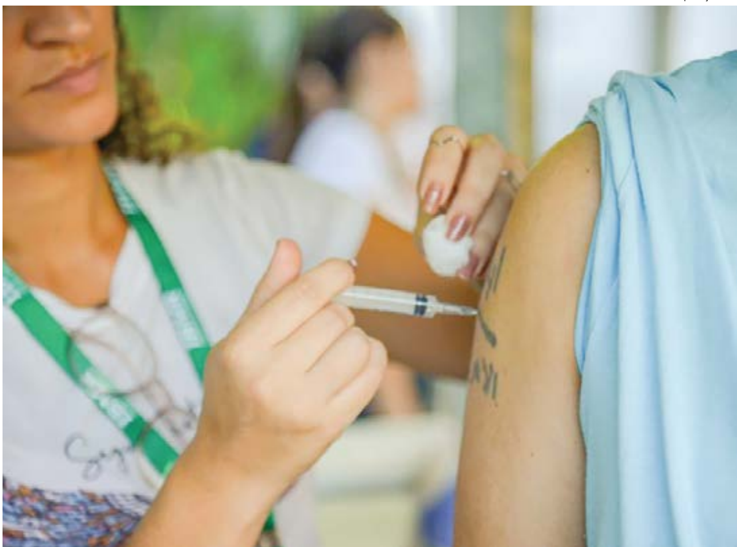
Todos podem se vacinar contra dengue a partir dos seis meses de idade; região se prepara para ampliar o atendimento após anúncio do ministério

Litoral Norte – Ubatuba vacinou 21,57% do público-alvo na campanha contra a influenza, sendo 6.802 doses aplicadas até o momento. Caraguatatuba vacinou até o momento 9.121 pessoas, cobertura de 27,76%.