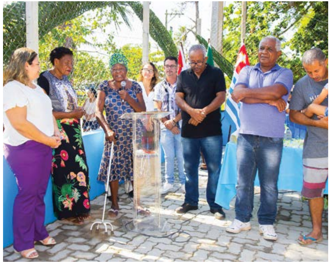
Cerimônia de reinauguração em área quilombola de Ubatuba; escola facilitará o acesso à educação das crianças da comunidade