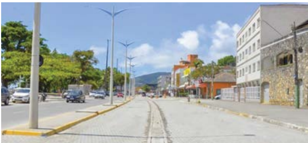
Avenida Iperoig, em Ubatuba; obra tenta garantir mais acessibilidade para moradores e circulação turística