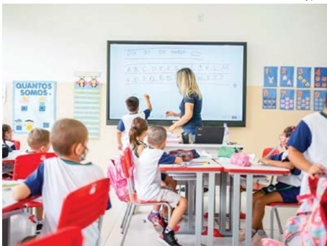
Sala de aula com alunos; medida vai beneficiar aproximadamente 14 mil crianças e adolescentes em Pinda

Procurada pela reportagem do Jornal Atos , a Prefeitura informou que a previsão é de que a ação preventiva seja iniciada até o fim deste mês. Além de revelar que inicialmente serão investidos cerca de R$ 100 mil na aquisição de cinco mil frascos de repelente, o Execu-