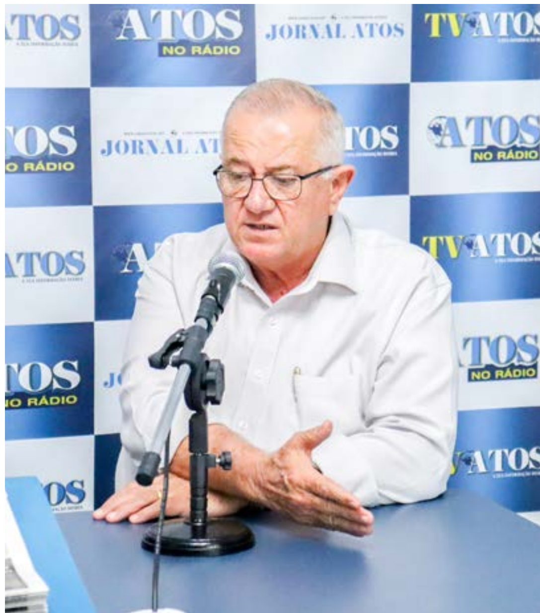
Mineiro, cassado pelo desaparecimento de R$ 60 mil; defesa identifica vícios no processo e vai recorrer