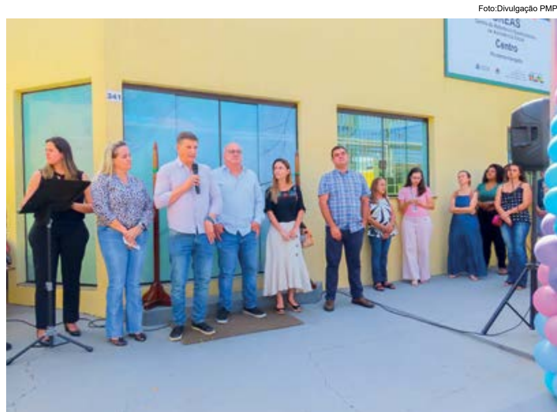
Inauguração da nova sede do Creas; o espaço fica na avenida Fortunato Moreira, nº 341

Assim como as demais UBSs da cidade, a nova unidade conta com consultórios médicos, recepção, banheiros, depósito, farmácia e salas de reunião, imunização, curativos e de procedimentos. A equipe de atendimento é formada por médicos, enfermeiros e técnicos em enfermagem aprovados no mais recente concurso público municipal, que teve suas provas de conhecimentos gerais aplicadas em 30 de abril do ano passado.