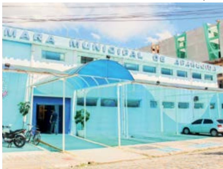
A Câmara de Aparecida, que iniciou convocação após concurso público