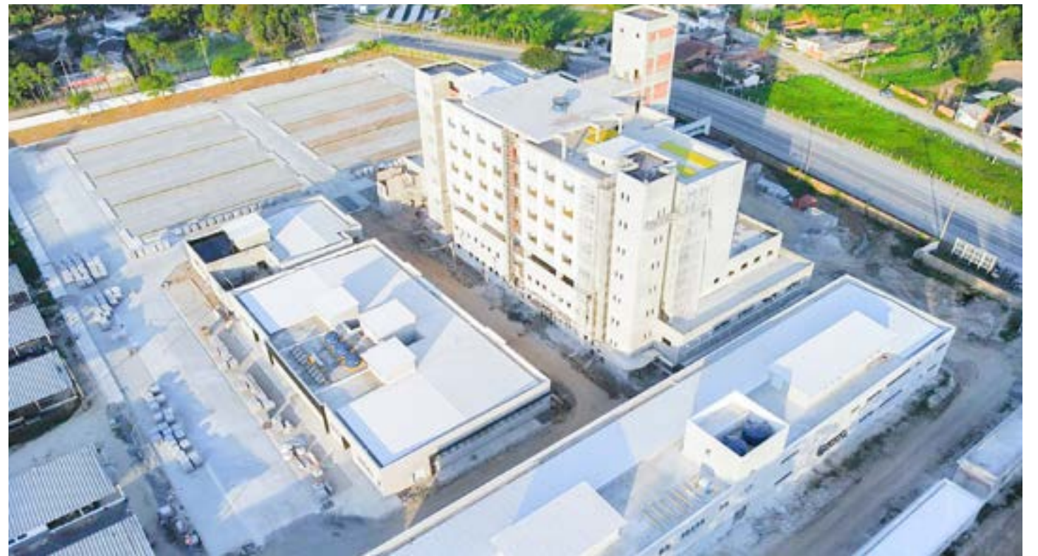
Vista aérea da construção do Hospital Regional de Cruzeiro; estrutura tem prognóstico de iniciar atendimento a partir do próximo ano

Obra de estrutura de atendimento junto ao Governo do Estado fecha abril com 80% concluída; funcionamento deve ficar para próximo ano