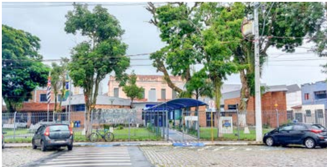
Câmara de Lorena; aprovados serão convocados de acordo com as necessidades de atuação no Legislativo

A Câmara de Lorena começou a convocar os aprovados no concurso público realizado em 2023. Nessa primeira etapa foram convocadas cinco pessoas, que passaram em primeiro lugar para os cargos de assistente de contabilidade, assistente de comunicação social, auxiliar de secretaria, controlador interno e jornalista.