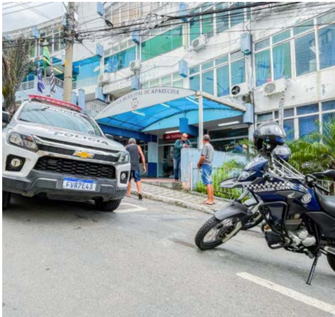
Fachada da Prefeitura de Aparecida; operação na manhã desta sexta-feira teve documentos apreendidos

Outro lado – Apontada pelo Portal da Transparência de Aparecida como a contratada para o fornecimento de abrigos para cinquenta pontos de ônibus, a empresa Rone Comunicação Visual Ei-