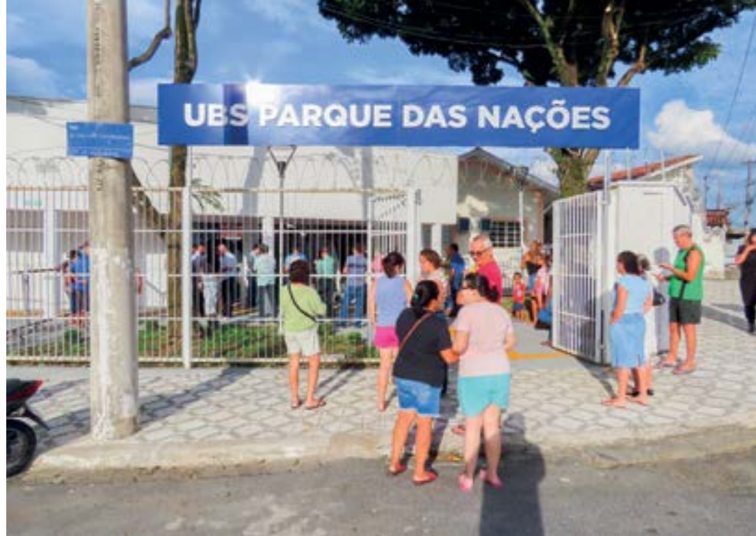
Unidade de saúde atenderá moradores do Parque das Nações, Alto do Cardoso, Maria Áurea e Socorro