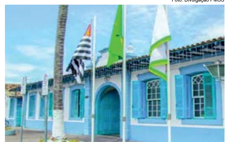
Prefeitura de São Sebastião; contrato previa gasto de R$ 10,369 milhões

Medida atende solicitação do Ministério Público; Prefeitura pretendia alugar novos equipamentos por mais de R$ 10 milhões