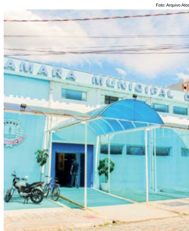
A sede da Câmara de Aparecida, que iniciou processo com aprovados