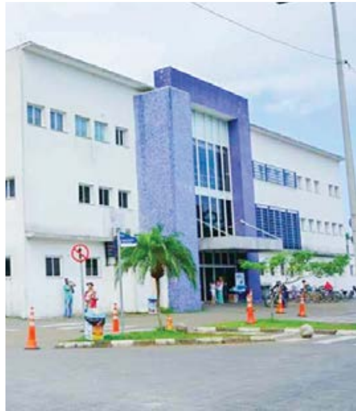
UPA Central de Caraguá; município registra 2.375 casos de dengue