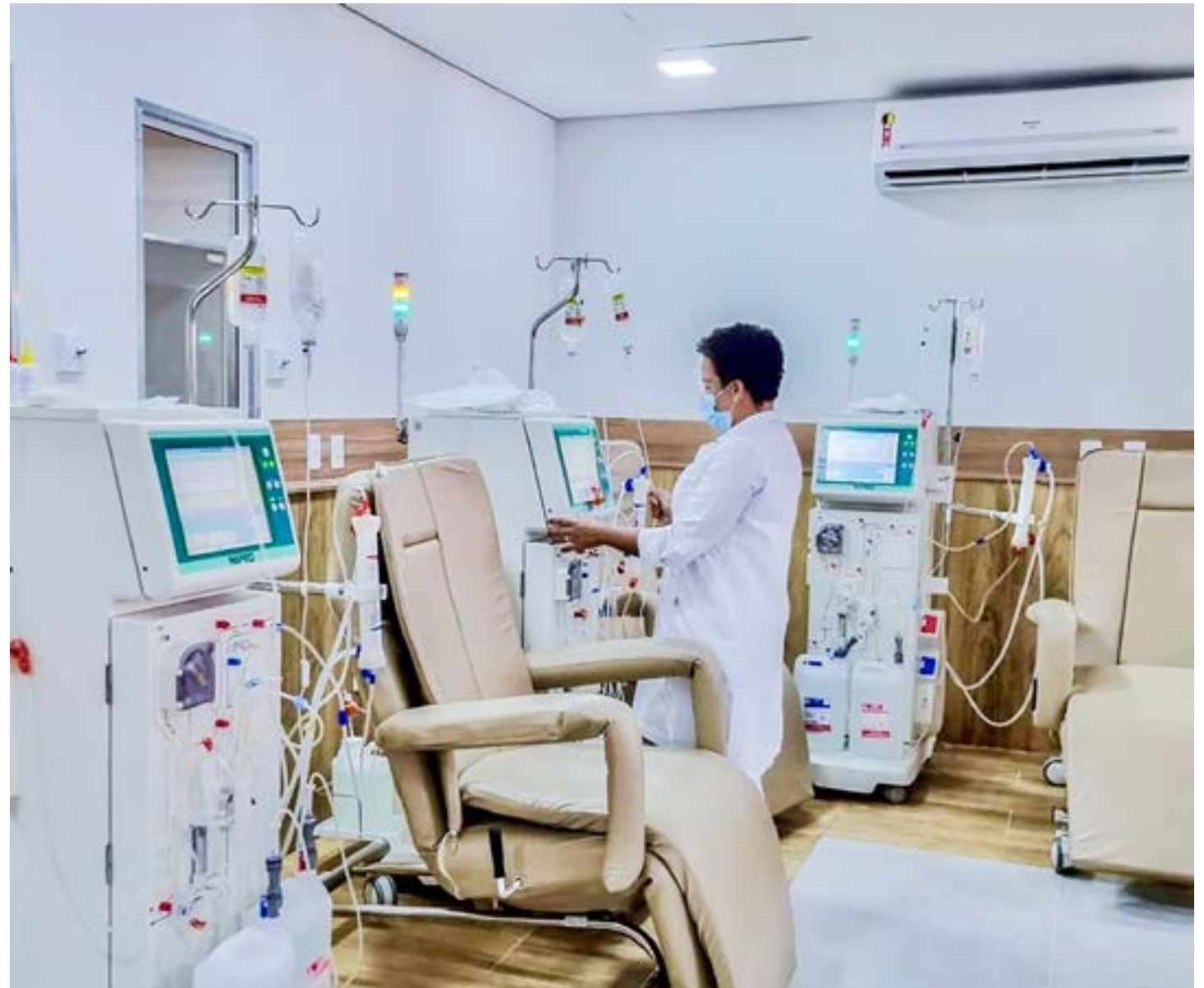
Estrutura da Santa Casa de Cruzeiro, reforçada com aporte liberado pelo Governo Federal nesta semana; proposta é qualificar atendimento regional