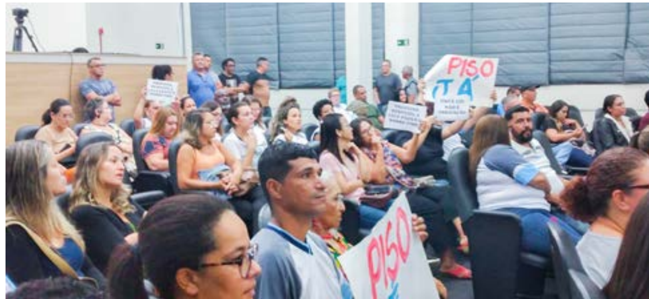
Manifestação de professores de Ubatuba; categoria comemora liberação de novo piso, aprovada por unanimidade na Câmara