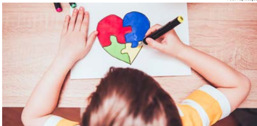
Criança desenha o símbolo de conscientização do autismo; documento tem validade de cinco anos

Em suas redes sociais, a Prefeitura ressaltou que "a criação da Carteira de Identificação da Pessoa com Transtorno do Espectro Autista é um marco importante para a cidade, e que essa iniciativa reflete o compromisso com a inclusão e o respeito à diversidade (trecho da nota)". Expedida de forma gratuita, a carteirinha de identificação foi criada através da "Lei Romeu Mion", nome do filho do apresentador de televisão Marcos Mion, sancionada pelo Governo Federal em 2020.