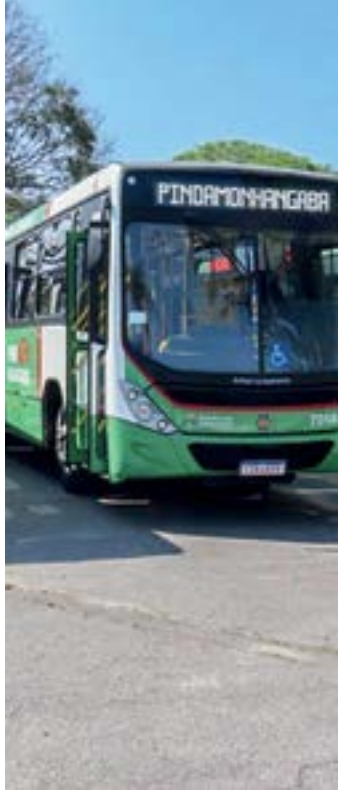
Ônibus do transporte de Pinda