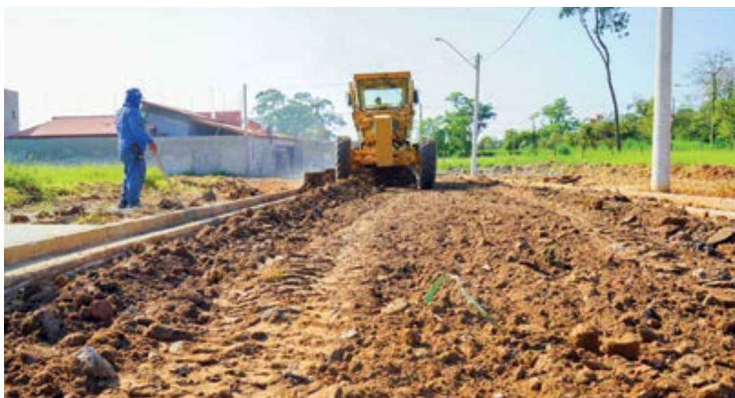
Início da obra de calçamento para o bairro Vila Rica; serviço conta com investimento de R$ 1,5 milhão

Em nota publicada em suas redes sociais, a Prefeitura informou que a equipe da secretaria de Obras e Planejamento Urbano está promovendo o bloquea-