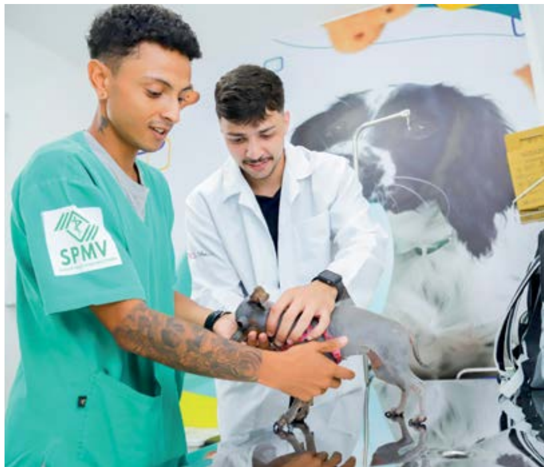
Atendimento veterinário no recém-inaugurado Pata; hospital é equipado para emergências e cirurgias

Além da implantação do hospital veterinário, que deverá atender até trinta animais por dia, a Prefeitura informou, em nota oficial, que o pacote de medidas prevê a realização neste mês de um mutirão de castração de cães e gatos na Costa Sul do município.