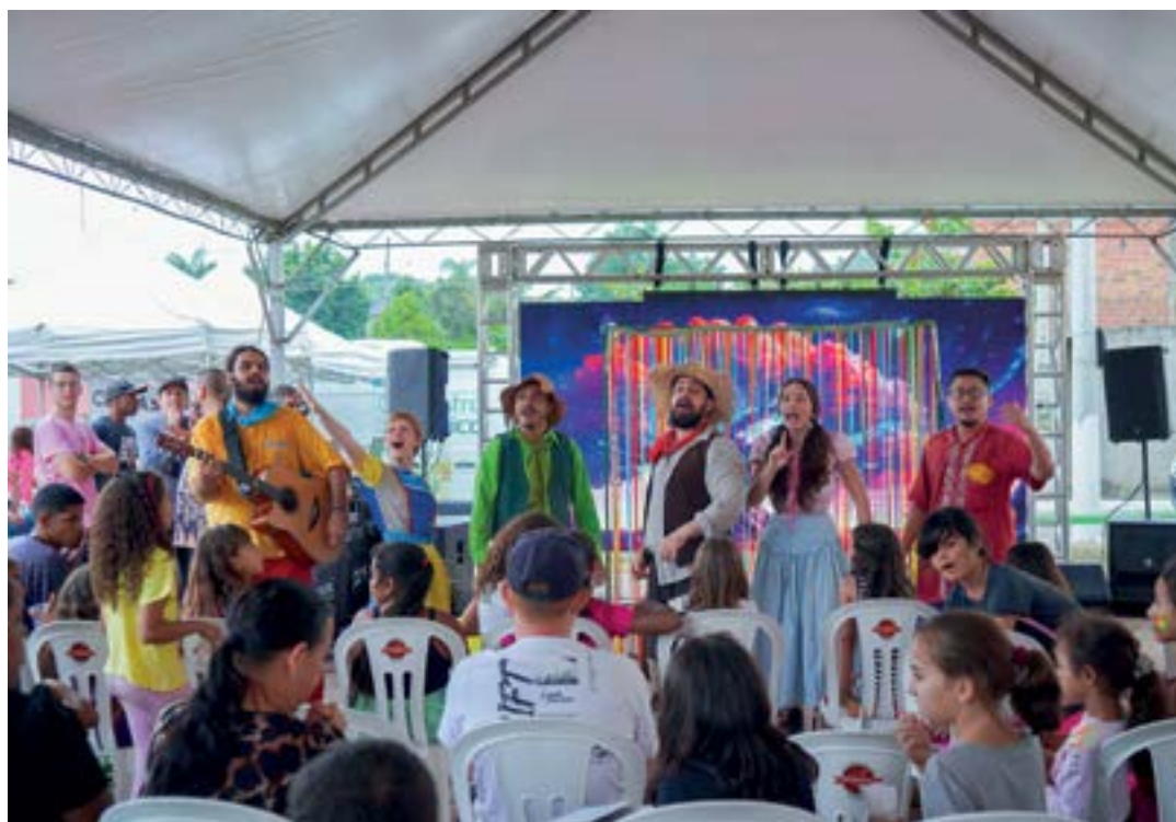
Apresentações artísticas com participação de crianças; Circuito Cultural é destaque do fim de semana

O circuito, realizado aos sábados, já passou por comunidades como o Portal dos Pássaros e Novo Horizonte. Segundo o cronograma divulgado pela Prefeitura, a terceira etapa, neste sábado (6), terá apresentações na quadra do bairro Cecap Alta, das 10h às 17h.