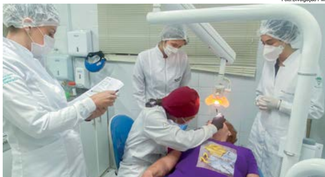
Atendimento no Centro de Especialidades Odontológicas, em parceria entre Prefeitura e Serra Dourada