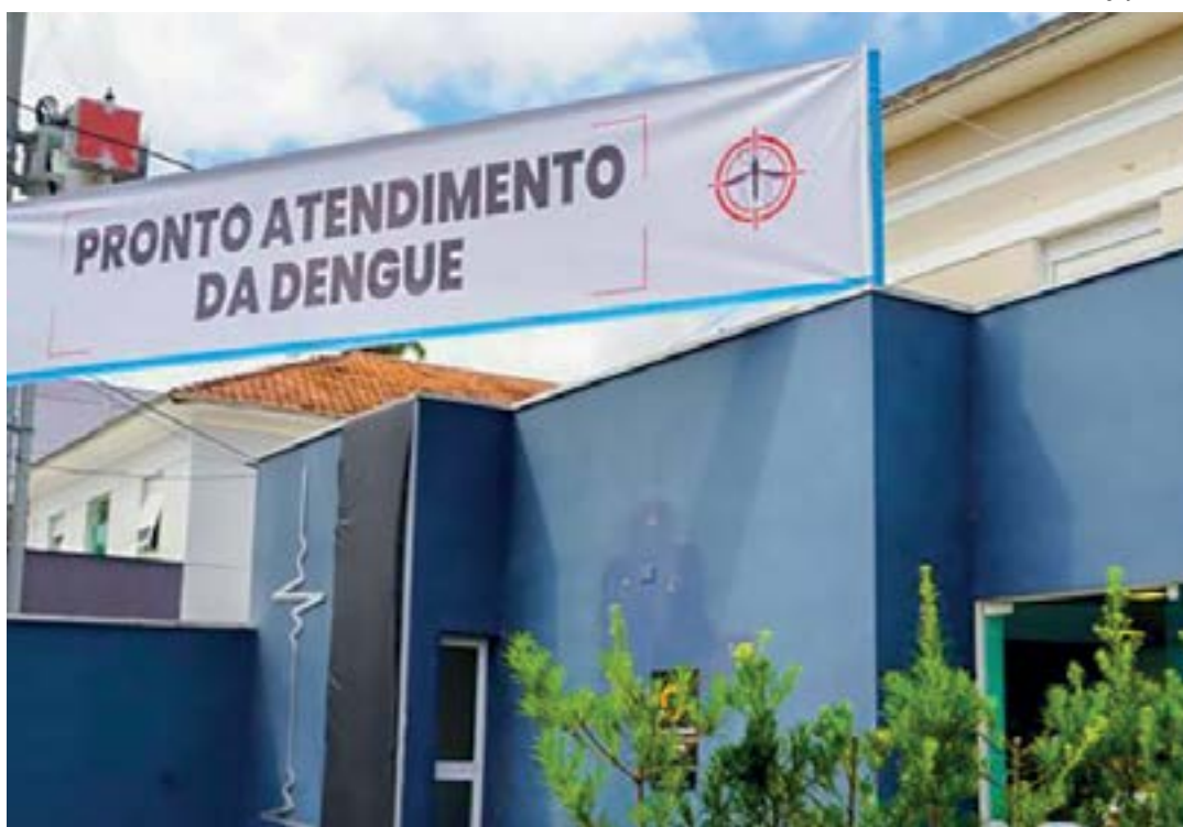
Sede do Pronto Atendimento da Dengue em Lorena; cidade é uma das atendidas por investimento do Estado

O investimento foi anunciado na semana passada, durante encontro com prefeitos e representantes de 103 entidades