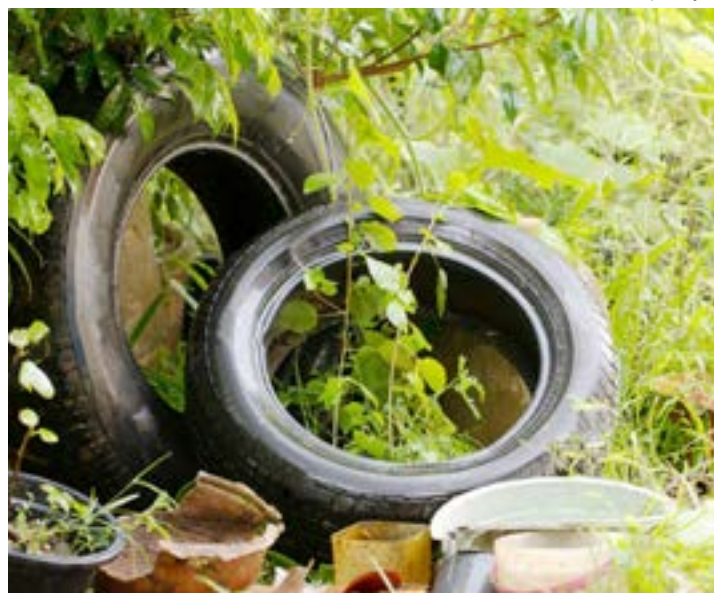
Pneus mal armazenados aumentam possibilidade de criadouros

Com 173 casos positivos, Aparecida deu início a um novo protocolo contra a dengue. A Prefeitura montou uma força-tarefa para combater os criadouros do mosquito transmissor Aedes aegypti . Foi criado ainda um espaço espe-