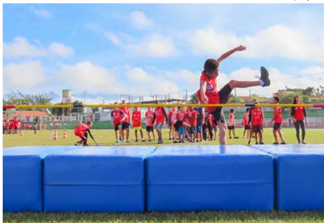
Alunos participam de treinamento no Centro Esportivo; além de reforma, Esportes garante nova plataforma

Segundo o Município, o serviço de modernização, que será executado pela empresa