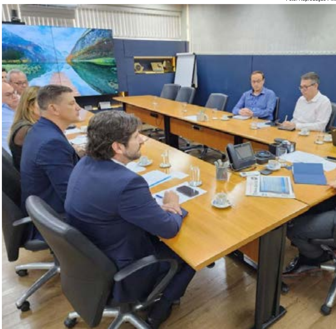
Reunião entre representantes da Prefeitura de Pinda e da Sabesp, em debate sobre ações de saneamento