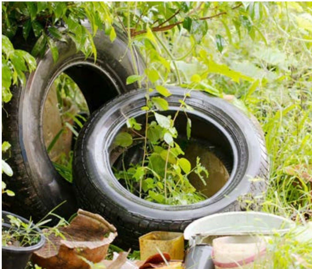
Pneus e materiais descartados a céu aberto são um risco contra a dengue; Aparecida intensifica ações

Também na quarta-feira começa a força-tarefa que vai unir várias secretarias. Na ação, serão feitos o com-