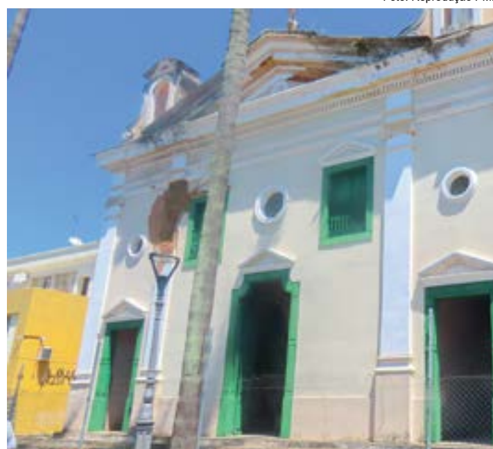
A histórica Igreja São José da Vila Real, que passará por restauração