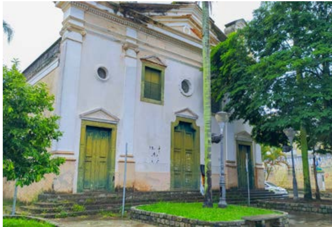
A Igreja São José, uma das mais antigas de Pindamonhangaba, que deve passar por obras de restauração

No entanto, as fases seguintes do serviço serão iniciadas apenas após a captação de recursos junto à Lei Rouanet,