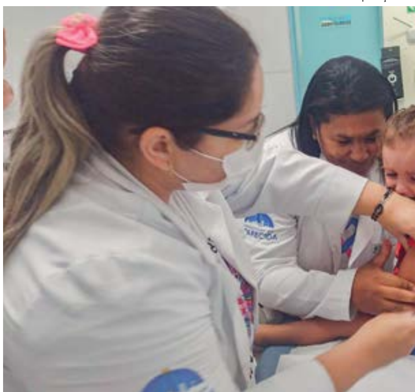
Trabalho de funcionárias da saúde de Aparecida; Prefeitura paga com atraso