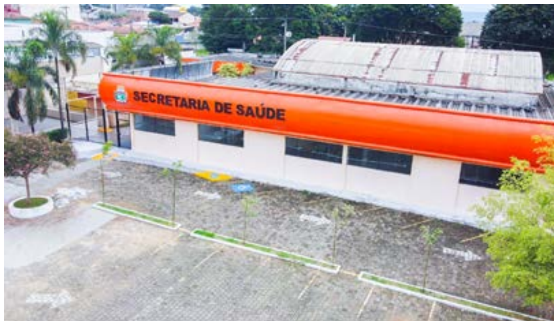
A secretaria de Saúde de Pinda; cidade lança serviço odontológico para atender pessoas com deficiência

Iniciativa da Prefeitura é aposta para agilizar o tratamento para o público, evitando deslocamentos para outras cidades