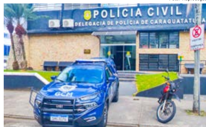
Delegacia da Polícia Civil, em Caraguá, que investiga duplo homicídio

A Polícia seguiu com diligências nesta sexta-feira (15) pela região do crime em busca de informações que contribuam para a elucidação do caso.