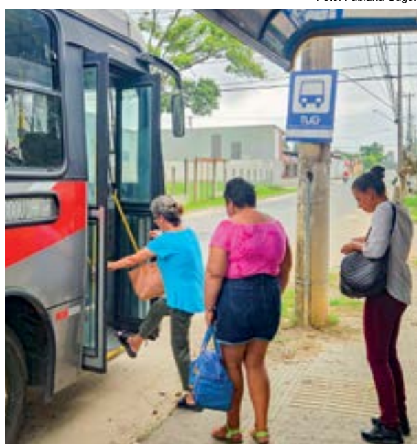
Passageiras embarcam em linha do TUG; gratuidade barrada

Decisão do TJ destaca que proposta sobre o transporte deve partir da Prefeitura de Guará