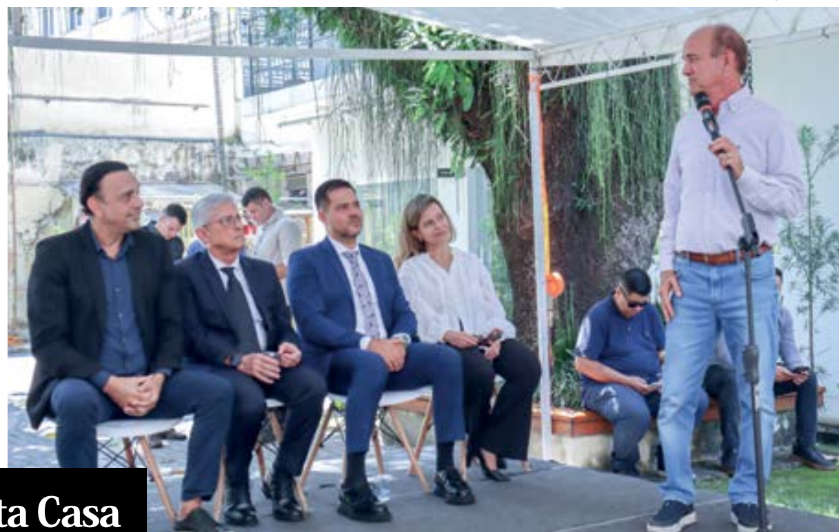
Santa Casa entrega ambulatório e clínica cirúrgica; ações contam com apoio da Prefeitura e Estado