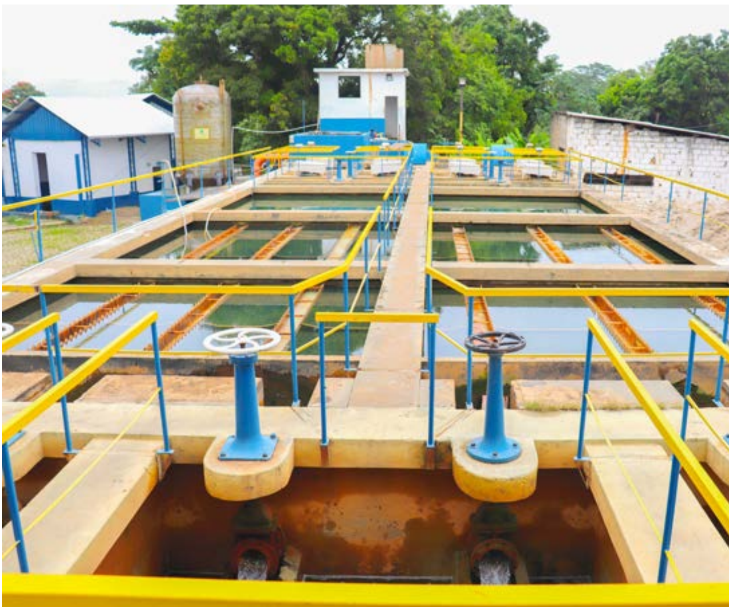
Estação de Tratamento de Esgoto do Saae de Aparecida, que vai receber melhorias estruturais com recurso enviados por meio do Fehidro

Para o Saae, o maior problema em relação a rede de esgoto é o percentual de tratamento de esgotos no município, que atualmente é de 0%. A cidade possui uma ETE (Estação de Tratamento de Esgoto), contemplada pelo Programa Água Limpa, porém, devido as alterações na execução do projeto, está apresentando falhas em seu funcionamento. "Por isso, a autarquia buscou recursos externos e foi contemplada com recursos do Fehidro para readequação e execução dos projetos apresentados".