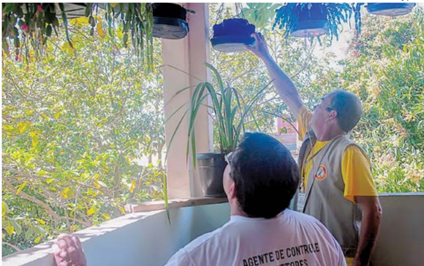
Trabalho de combate a criadouros do Aedes aegypti realizado com apoio de agentes da saúde de Pinda; cidade continua com índice preocupante

O novo grupo de convocados se juntará aos 23 médicos, também aprovados no último certame e que assumiram as