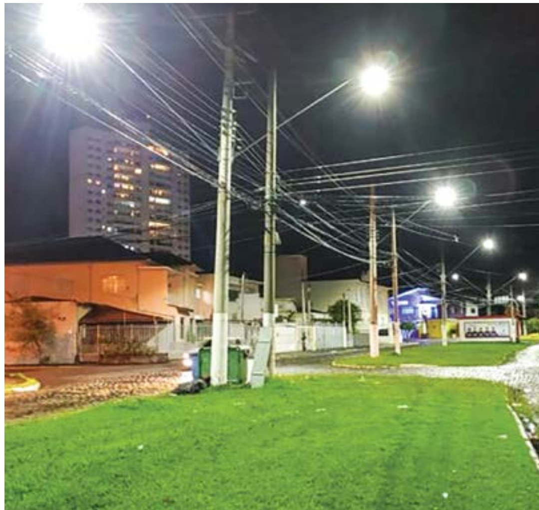
Sistema de iluminação de avenida na Vila Paraíba; Prefeitura assumiu manutenção do sistema na sexta-feira