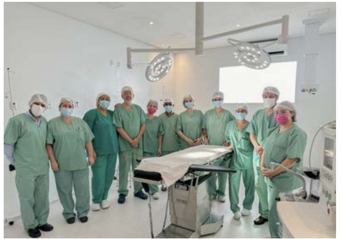
Equipe de atendimento posa em salas entregues para ampliação dos serviços prestados no hospital

Em nota divulgada em suas redes sociais, a Prefeitura revelou que planeja junto à direção da Santa Casa promover ao longo deste ano outras melhorias no hospital, como a reforma do Pronto Socorro destinado ao atendimento de pacientes pelo SUS (Sistema Único de Saúde). Detalhes sobre o referido projeto deverão ser divulgados pelo Executivo em breve.