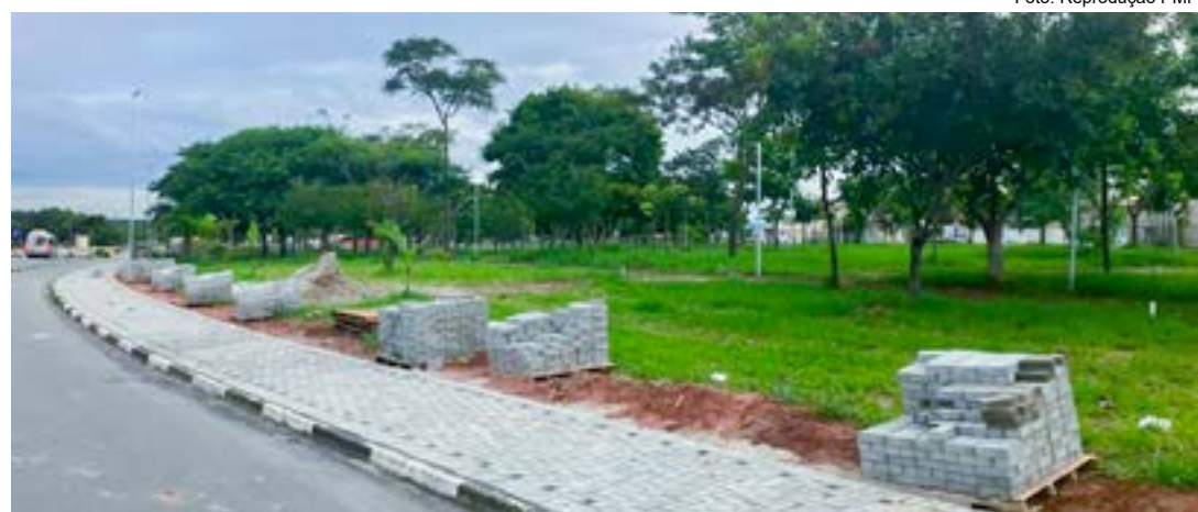
Andamento da construção da futura praça, no bairro Parque das Palmeiras; R$ 869 mil investidos em lazer

Segundo a secretária de Obras e Planejamento Urbano, a praça terá piso de concreto,