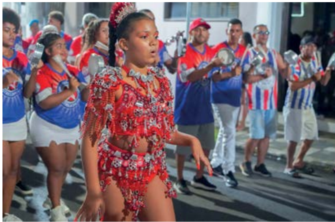
A pequena foliã da Estrela D'Alva, nos preparativos para os desfiles de Lorena; apresentações na segunda-feira