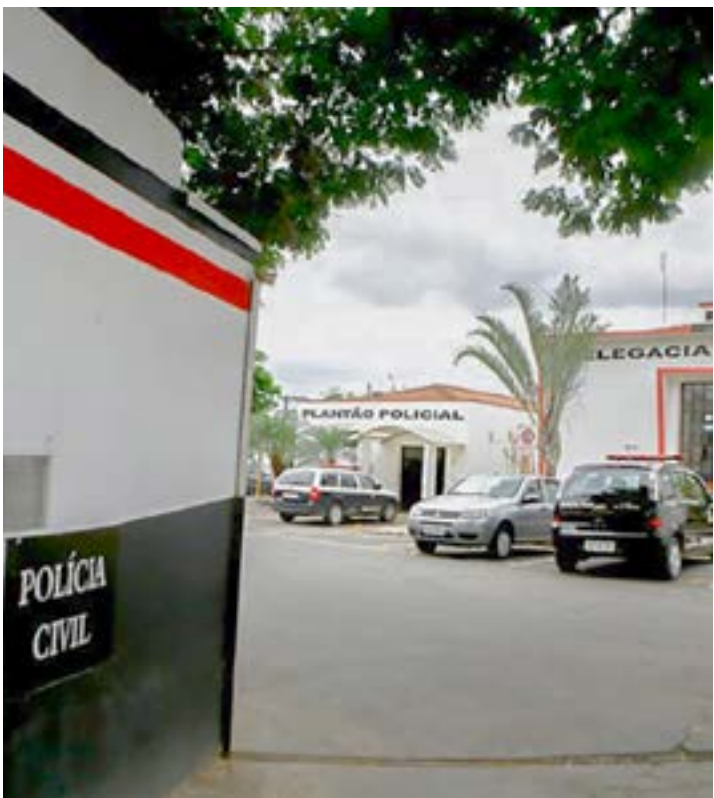
Delegacia de Aparecida, que abriu operação para investigar homicídios