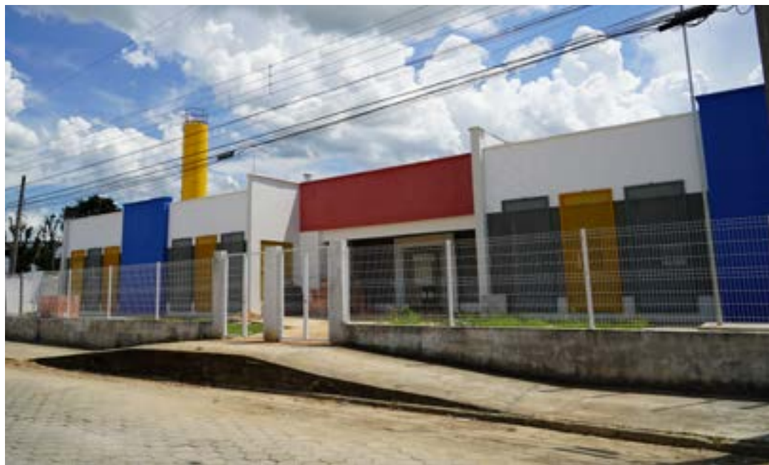
Em fase final de construção, creche Santa Edwiges amplia estrutura municipal; Novo Horizonte terá unidade

As obras na Vila dos Comerciantes 2 e Santa Edwiges devem ser concluídas em março. As outras duas creches devem começar a receber