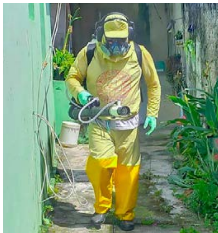
Trabalho de nebulização é uma das ações reforçadas contra dengue

O prefeito salientou que a Vigilância de Saúde do município já está realizando ações em todas as regiões da cidade para eliminar os criadouros do mosquito transmissor da