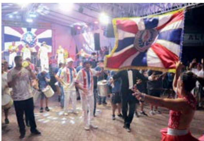
Bonecos Cobiçados, Embaixada do Morro, Mocidade Alegre do Pedregulho, Beira Rio, Acadêmicos do Campo do Galvão e Unidos da Tamarandé

Carnaval 2024", exaltou. Suor e samba - Nas últimas semanas, o trabalho nos barracões teve o ritmo acelerado. Com a responsabilidade de abrir os trabalhos na terça-feira, a primeira escola a desfilar na Presidente Vargas, a Unidos da Tamarandé, traz à avenida o enredo "Toque de essência", com um desfile e samba