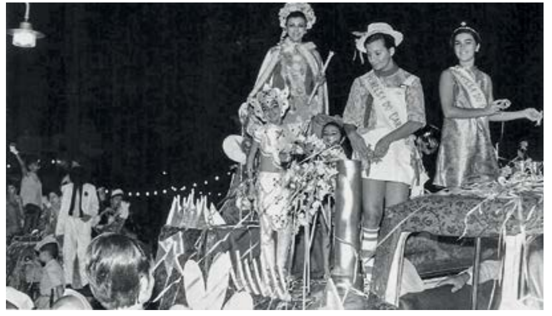
Desfile dos anos 1950 do Carnaval lorenense; escolas e blocos fizeram o histórico da festa de Momo na cidade