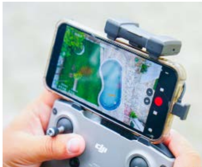
Visão da câmera de drone utilizada para vistorias em casas de veraneio

De acordo com o Executivo, os equipamentos aéreos seguirão sendo utilizados pela equipe da secretaria de Saúde nos trabalhos de fisca-