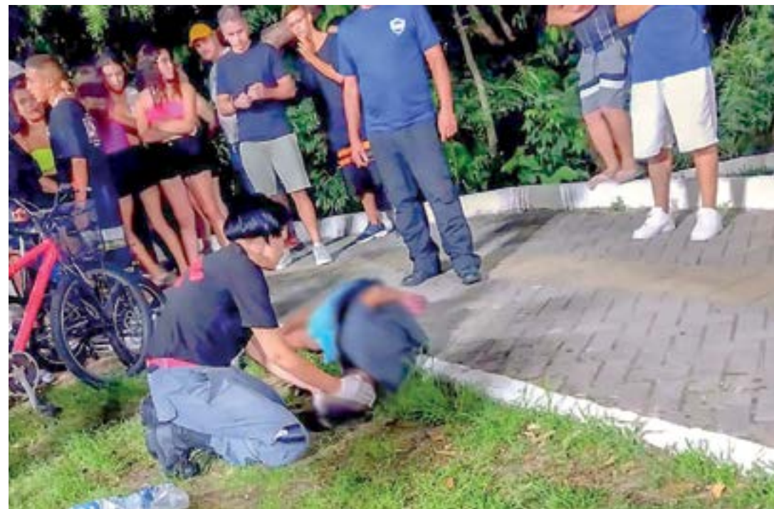
Atendimento de emergência a uma das vítimas; mobilização nas redes sociais pede por mais policiamento