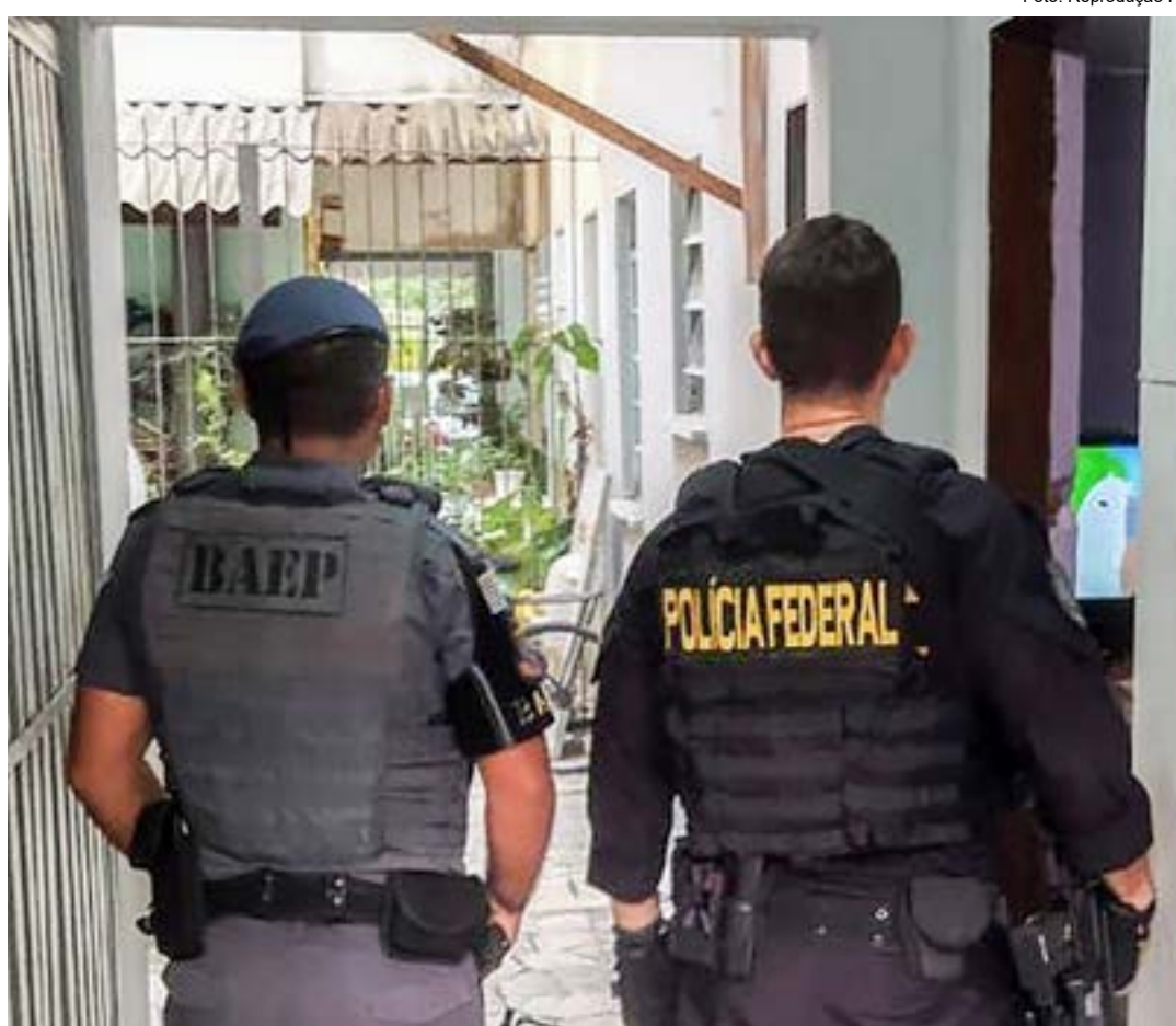
Trabalho da Polícia Federal para desarticular esquema criminoso que tinha bancos como alvos em Cruzeiro

De acordo com a PF, foram cumpridos três mandados de busca e apreensão em imóveis distribuídos por Caraguatatuba, Jacareí e São José dos Campos. Na operação, que contou com o apoio da Polícia Militar, foram apreendidos aparelhos celulares, computadores e dois carros. Os objetos serão periciados por técnicos da PF e poderão auxiliar no trabalho investigativo que apura o arrombamento à agência da Caixa de Cruzeiro em 9 de novembro de 2022. Os proprietários dos veículos e aparelhos eletrônicos, que seguem monitorados