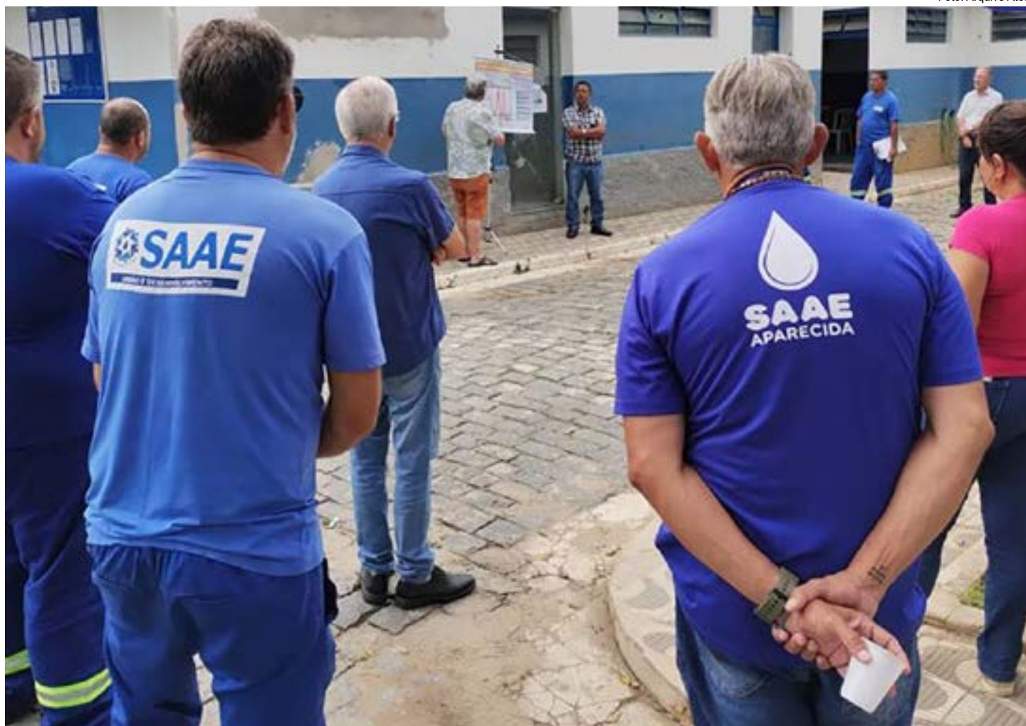
Reunião entre funcionários do Saae, em Aparecida; Arsesp passa a qualificar os serviços da autarquia depois de parceria com o Estado

O contrato conta com exigências da Lei do Marco Regulatório do Saneamento Básico e do TCE (Tribunal de Contas do Estado). As agências reguladoras são órgãos governamentais que têm a finalidade de regular e fiscalizar as atividades de autarquias. Elas possuem poder especial para legislar sobre como determinado mercado deve operar. São responsáveis pela regulação de metas e normas a serem cumpridas pelo município e de fiscalização, estabelecendo prazo de execução de serviços e investimentos. "Com isso o Saae terá segurança nas ações de seus projetos