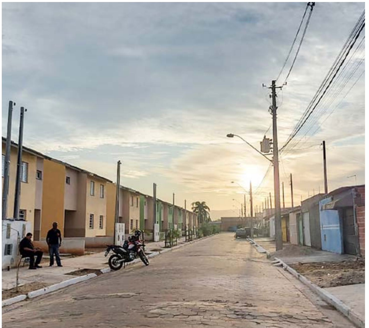
Conjunto de moradias no Campos dos Ypês, na região da Vila dos Comerciantes; Prefeitura de Lorena inicia distribuição de carnês do IPTU

O atendimento via WhatsApp é feito no horário de funcionamento do setor, de segunda a sexta-feira, das 9h às 16h30.