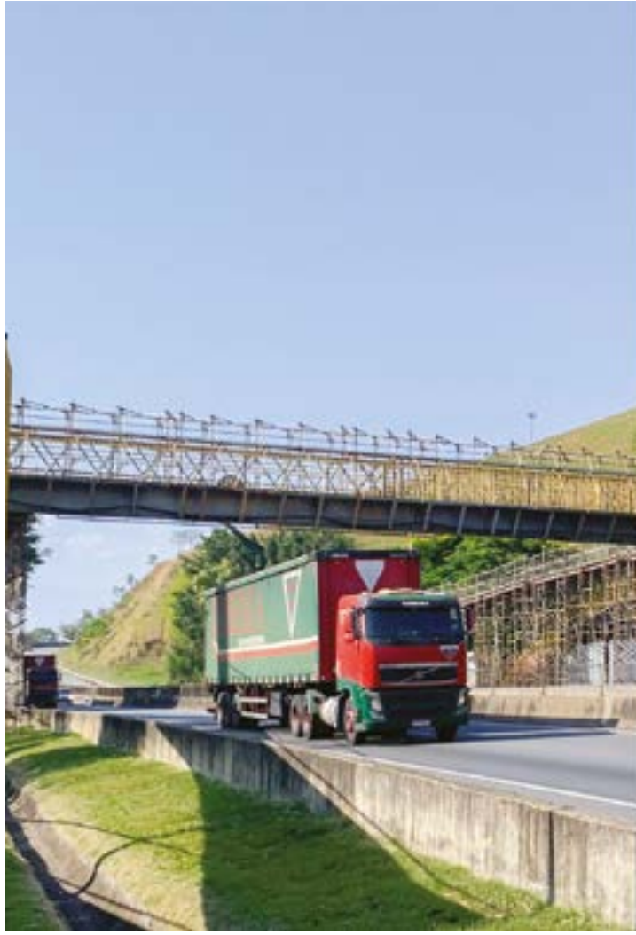
Antiga passarela (esq.), que será retirada na noite desta sexta-feira, e a nova (dir.), instalada no final de 2023; tema gerou polêmica na cidade