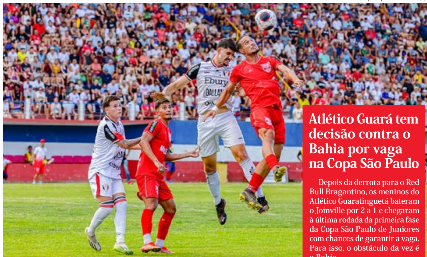
Lance da vitória do Atlético sobre o Joinville, que deixa o time de Guaratinguetá a uma vitória da vaga