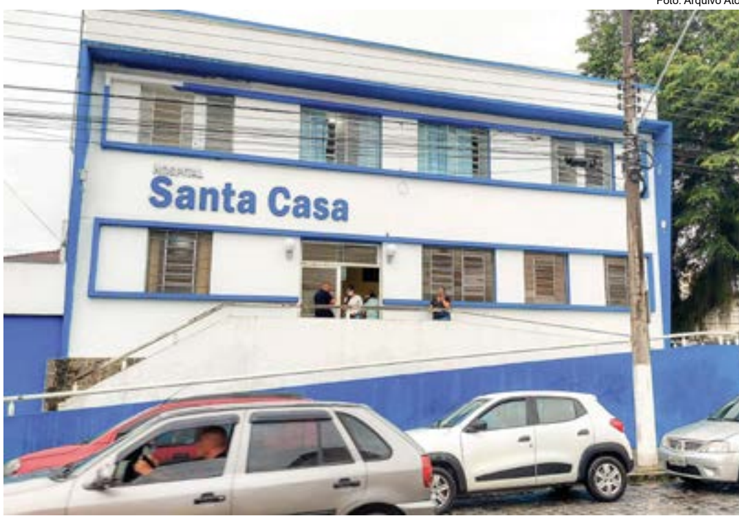
Santa Casa, que atendeu bebê esquecida no carro por quase uma hora; pai será ouvido pela Polícia Civil

Segundo o Conselho Tutelar de Cruzeiro, o órgão foi acionado pela Santa Casa de Cruzeiro após um casal comparecer no hospital em busca de atendimento para a filha que havia ficado trancada em um veículo na região central da cidade. Após ser examinada pelos médicos e ficar algumas