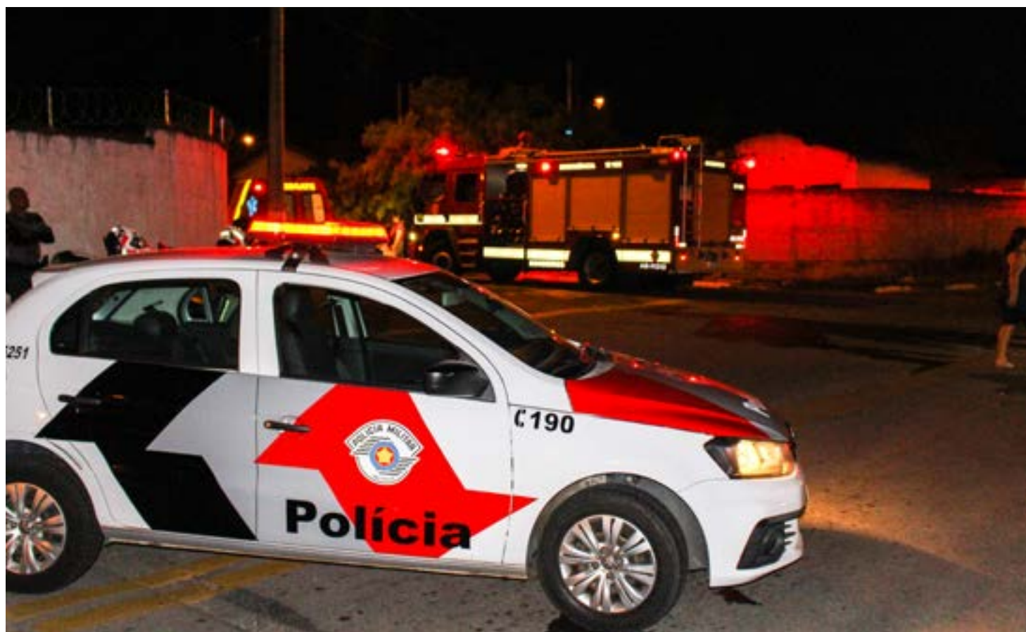
Viatura da Polícia Militar durante atendimento de ocorrência; investigação em Pindamonhangaba tenta localizar assassinos de pai de bebê

De acordo com a Polícia Civil, o motociclista e o garupa já foram identificados pela investigação. A corporação, que apura a motivação do crime, realiza buscas pelo distrito e por Pindamonhangaba na tentativa de prendê-los.