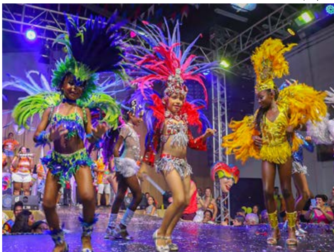
Escolha da Mini-Rainha da Festa de Momo de edições anteriores; Oesg organiza festas neste fim de semana

Os eventos, realizados pela Oesg (Organização das Escolas de Samba de Guaratinguetá) em parceria com as secretarias de Cultura e