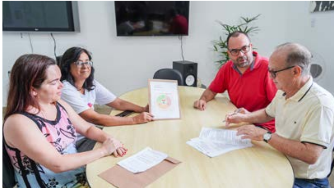
Reunião entre representantes da Prefeitura e da Aacal, que definiu os termos para doação de terreno