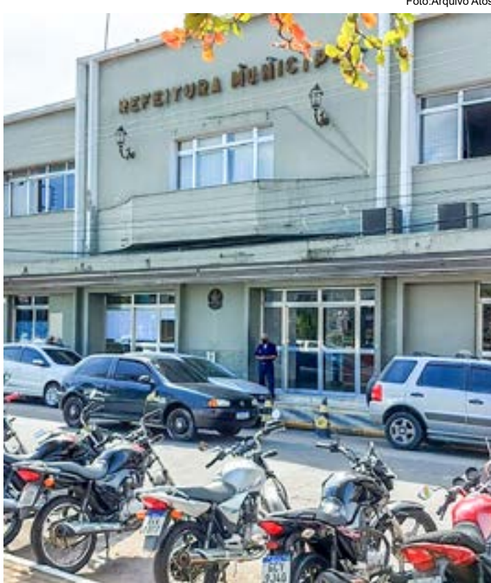
A sede da Prefeitura de Cruzeiro; pedidos sobre o Refis até sexta-feira

Em nota publicada em suas redes sociais no fim da tarde da última sexta-feira (14), a Prefeitura informou que os moradores inadimplentes com tributos municipais, como o IPTU (Imposto Predial e Territorial Urbano) e o ISSQN (Imposto sobre Serviços de Qualquer Natureza),