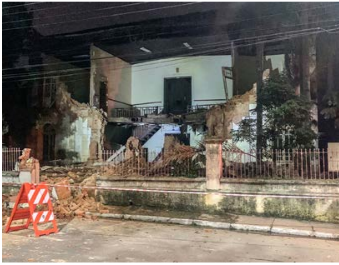
Flagrante de desmoronamento de fachada da antiga sede da Prefeitura de Guaratinguetá, no último dia 6