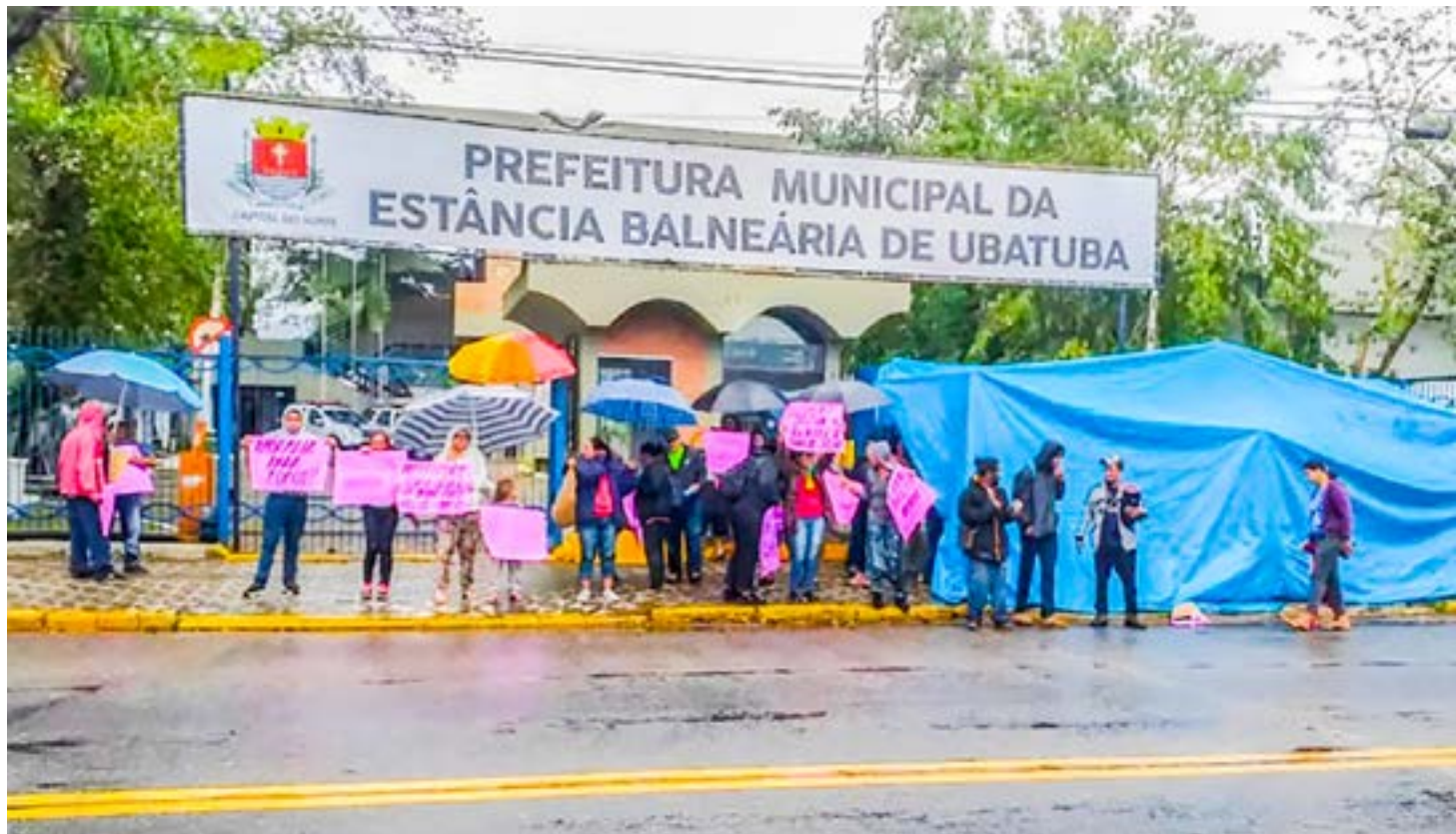
Manifestação de moradores em setembro, em frente à sede da Prefeitura; demolição tem data definida anunciada para o próximo dia 27

em frente à sede do Executivo e participando de reuniões com o prefeito Márcio Maciel (MDB) e sua equipe. A derrubada das moradias era prevista inicialmente para ocorrer em 13 de setembro, mas a Prefeitura