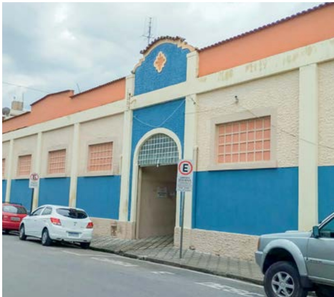
Mercado Municipal de Pindamonhangaba; Prefeitura discute quais as melhorias necessárias para a estrutura