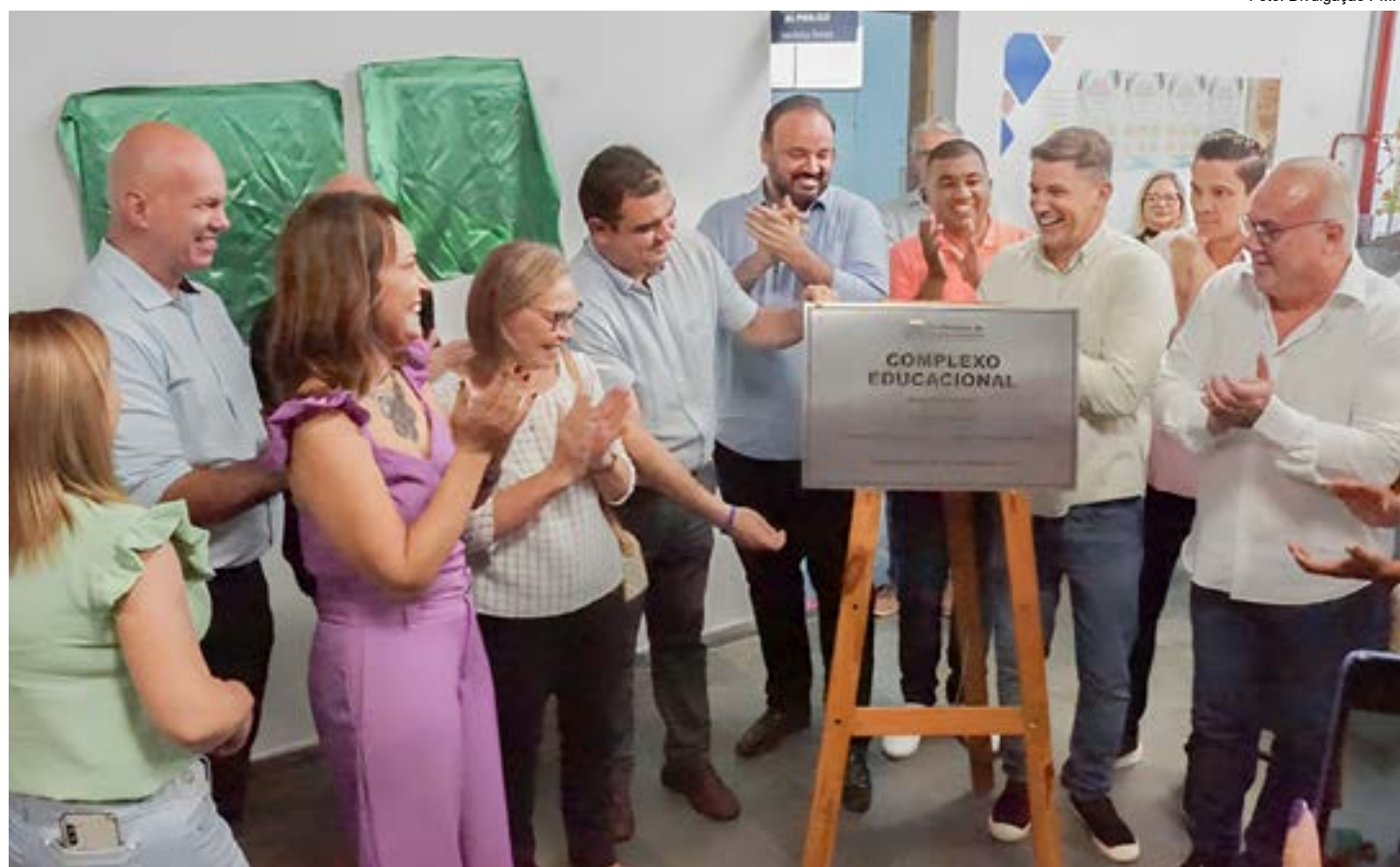
Inauguração de espaço para rede municipal de ensino contou com a presença de vereadores e prefeito; setor educacional centralizado

O prefeito também ressaltou a importância da criação do Complexo. "Este novo espaço é mais moder-