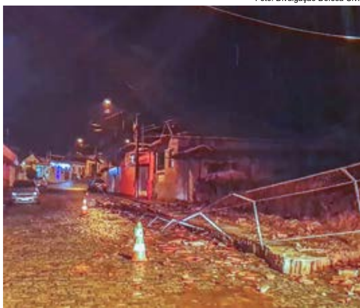
Destruição com a chuva em Piquete; áreas de risco são monitoradas

Procurada pela reportagem do Jornal Atos , a Defesa Civil de Piquete informou que sua equipe está promovendo vistorias em diversos pontos da cidade, principalmente no bairro Vila Cristiana e na zona rural. O trabalho preventivo, que seguirá por tempo indeterminado, busca identificar indícios de anormalidade no solo, na vegetação e em barrancos que possam colocar em risco a população.