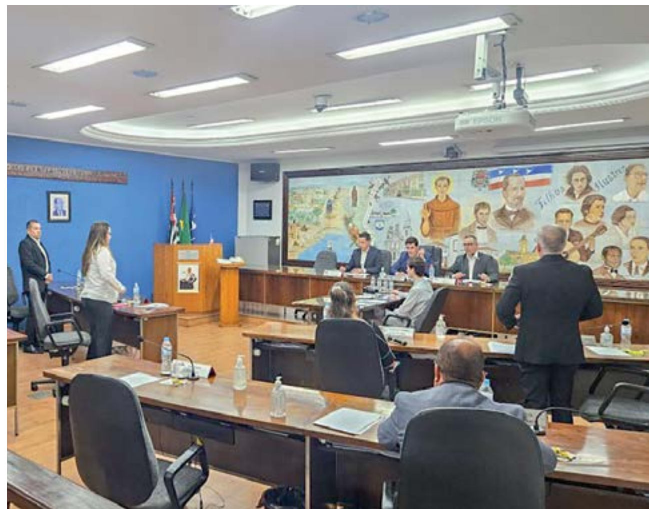
Sessão da Câmara de Guaratinguetá, que tratou sobre subsídios do Legislativo; Executivo terá aumento no próximo mandato