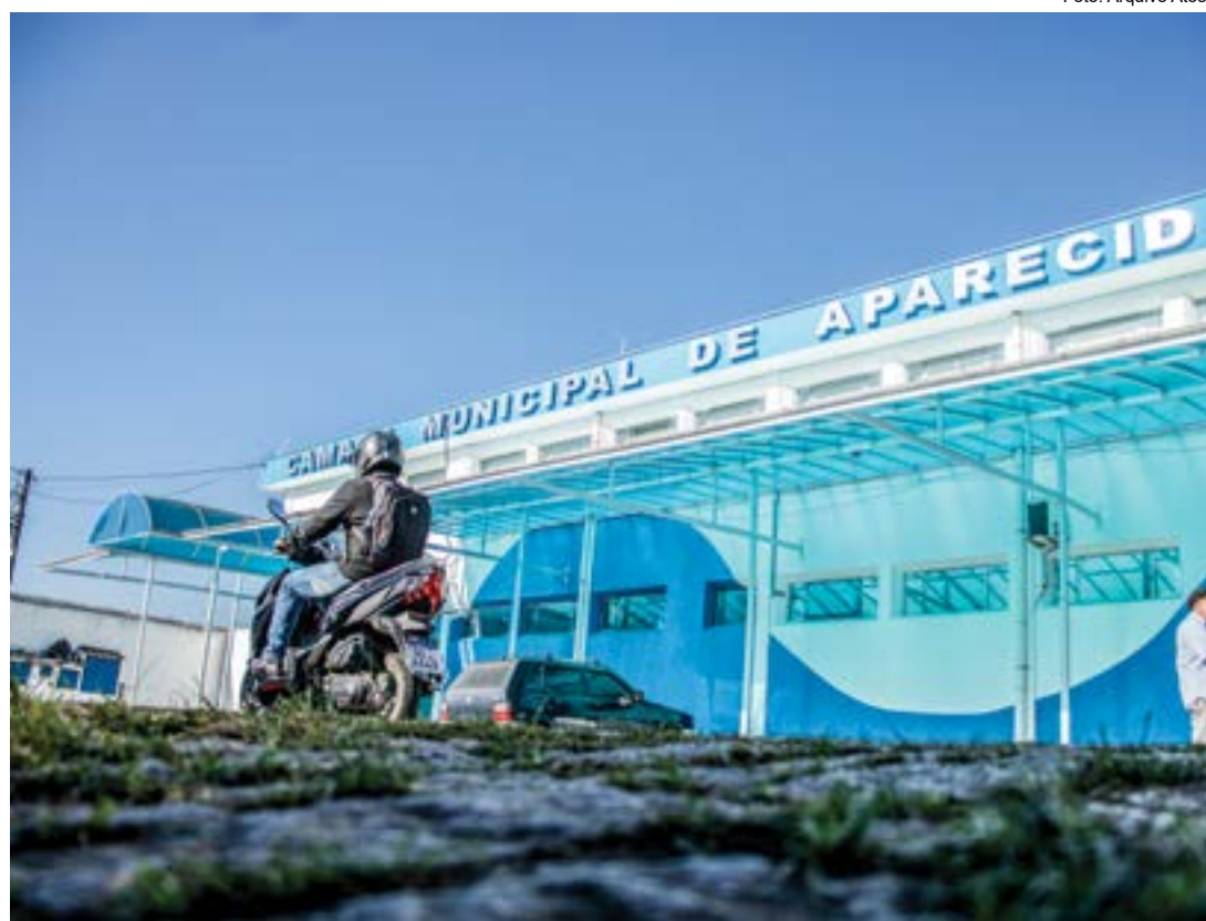
A Câmara de Aparecida, que divulgou os aprovados no concurso público; prova prática será em janeiro