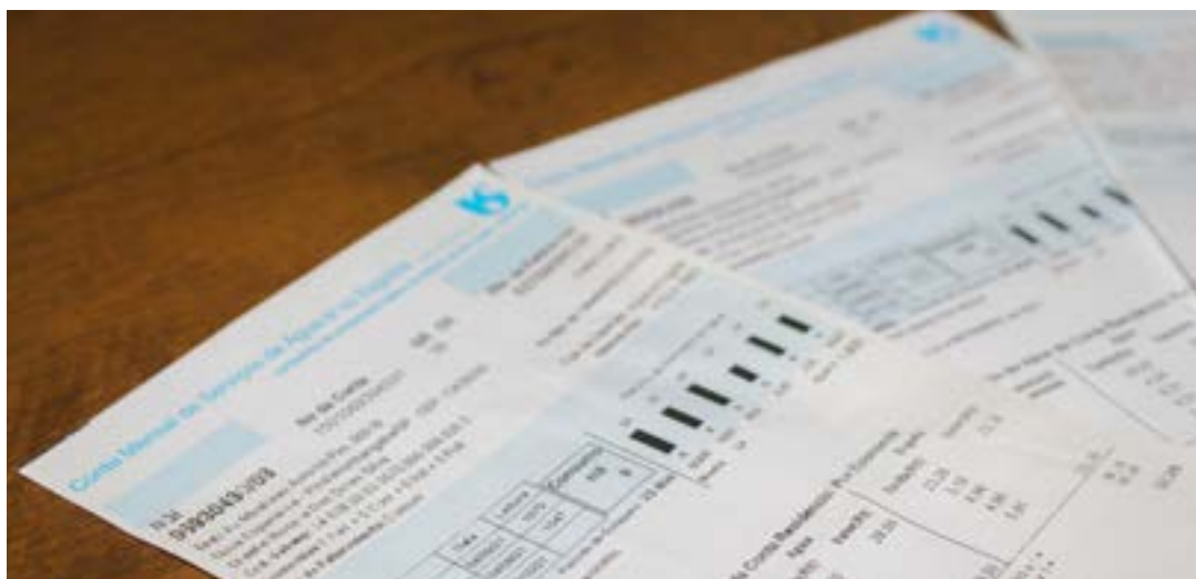
Contas de consumo da Sabesp, que lançou renegociação de dívidas; trabalho atende boa parte da região

Trabalho para acerto de contas foca cidades paulistas; expectativa é fechar vinte mil acordos até fevereiro