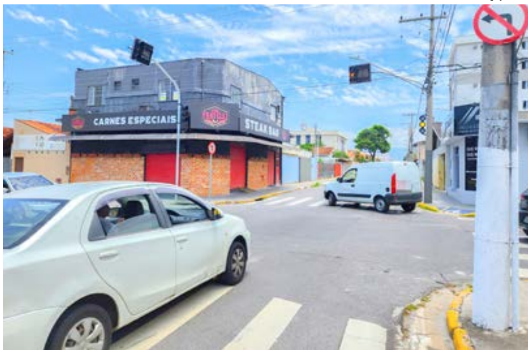
Semáforos implantados em esquinas de Pinda; ação tenta diminuir acidentes de trânsito na cidade

Coordenada pela equipe da secretaria de Segurança Pública, a primeira etapa do trabalho de instalação dos aparelhos foi concluída na última terça-feira (5) pela empresa Newtesc Tecnologia.