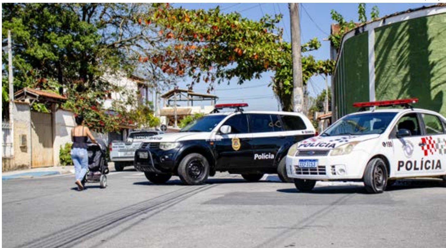
Polícias Civil e Militar durante atendimento de ocorrência em Cruzeiro; região é destaque negativo em levantamento sobre violência

Fechando o Top 5, Ubatuba obteve o índice de 14,33 de exposição a crimes violentos. O dado é alarmante, visto que a cidade subiu 13 posições em