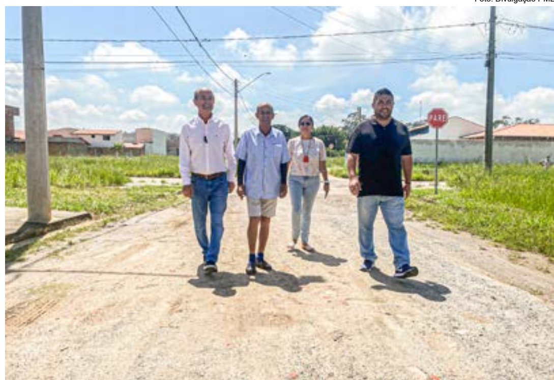
Rua na Vila Rica que receberá pavimentação; investimento de mais de R$ 1 milhão viabiliza serviço

Prevista para o início de 2024, obra contemplará oito vias; melhoria conta com recurso federal de quase R$ 1,5 milhão