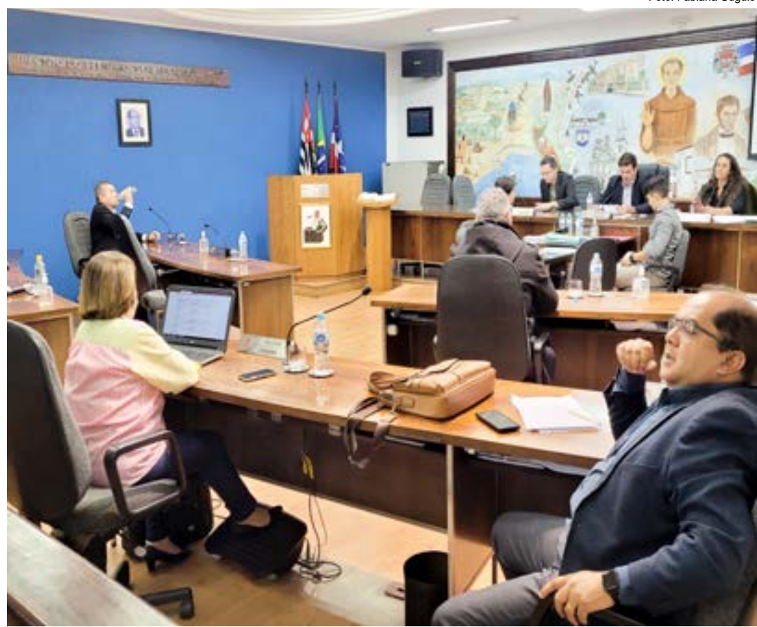
Sessão da Câmara de Guará; vereadores tem novo debate sobre subsídios para Legislativo e Executivo

Se aprovada a proposta, que ainda não tem data definida para a votação, o subsídio do prefeito será de R$ 30.747,93 e o do vice-prefeito, secretários e vereadores de