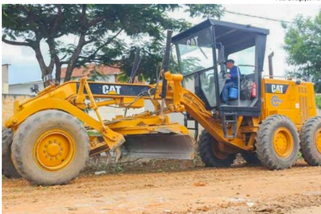
Maquinário disponibilizado pelo Estado já atua na pavimentação de 52 vias de Guaratinguetá, pelo Nossa Rua

Apontado pela Prefeitura como o maior programa de pavimentação da história da cidade, o Nosso Rua teve seu pontapé inicial dado pela empresa Mineraias São José, na manhã da terça-feira (5) nas ruas Euphrásio Fernandes e Olívio Pereira de Carvalho, no bairro Jardim Esperança, e na Avenida dos Escritores, no bairro