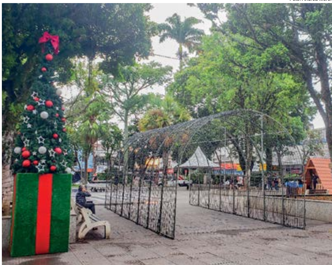
Montagem na praça Arnolfo Azevedo para os festejos do Natal Iluminado, na região central de Lorena