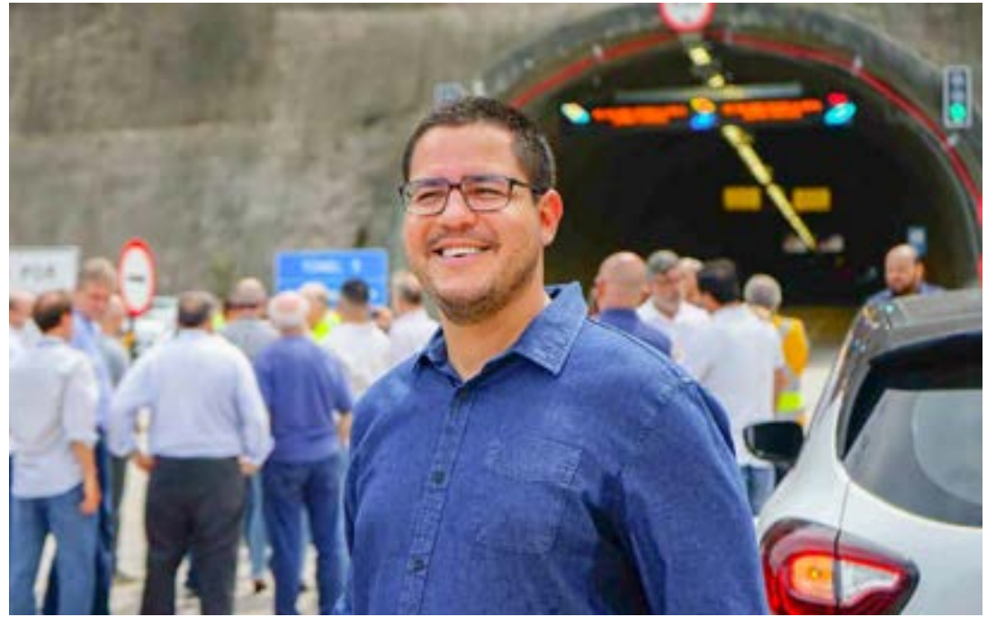
O prefeito Aguilar Júnior; bem bloqueados e multa por gratificações

A Justiça concedeu ao prefeito e aos seis servidores o prazo de trinta dias, que no caso, acaba no dia 9 de dezembro, para contestarem a decisão referente ao bloqueio de seus bens imóveis e móveis.