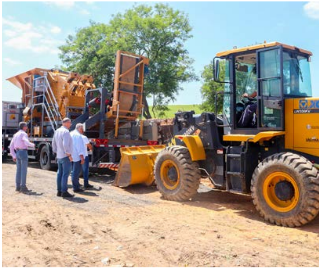
Chegada da usina móvel para trabalho em Cachoeira Paulista; estrutura já está em operação no município

O Consórcio Novo Vale foi criado em 2021, com o objetivo principal de atuar na gestão pública de forma regionalizada, concentrando esforços para promover o desenvolvimento sustentável da região dos Vales da Fé e Histórico.