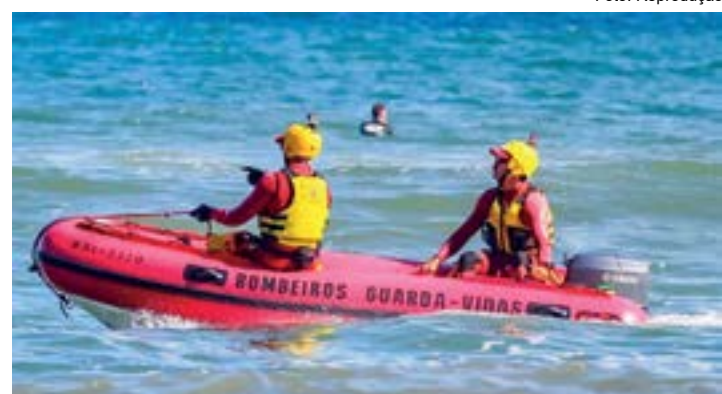
Equipe de socorro durante atuação nas praias do Litoral Norte

Em Caraguatuba, os casos de afogamento reduziram 10%