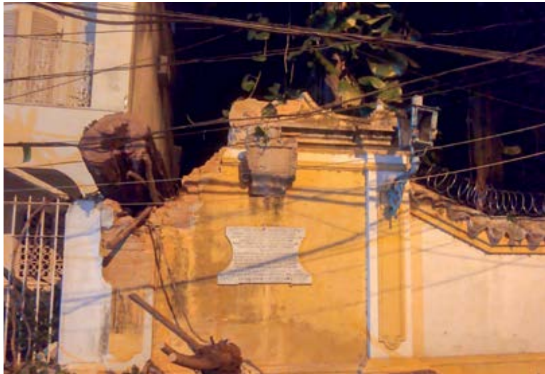
Árvore atinge muro do Solar Baptista D'Azevedo; parte da estrutura de prédio histórico ficou danificada