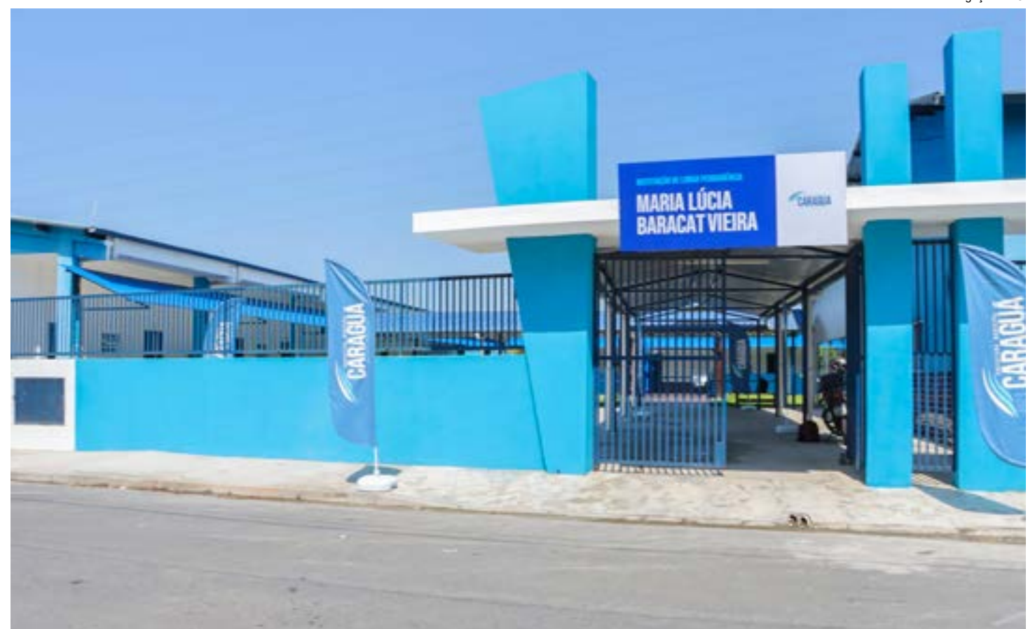
A sede da unidade Instituição de Longa Permanência para Idosos e Pessoas com Deficiência, inaugurada pela Prefeitura de Caraguatatuba

Apesar da inauguração da ILP, a Prefeitura anunciou que manterá o convênio firmado com três asilos privados da cidade para o acolhimento de outros 89 idosos.