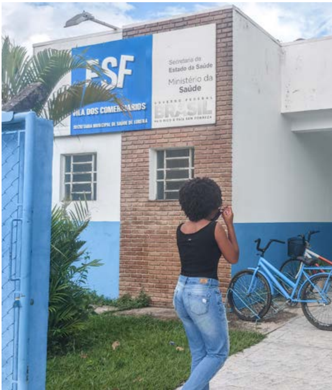
Acesso ESF no Vila dos Comerciantes, uma das unidades entregues neste ano pela Prefeitura

A terceira obra, na ESF da avenida São Pedro, no bairro da Olaria, teve pintura interna e externa, construção de balcão de atendimento e