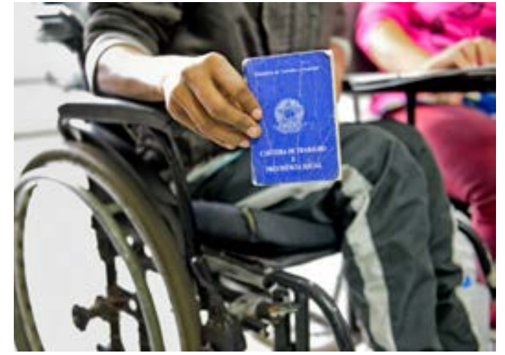
Pessoas em cadeira de rodas estão entre os atendidos pelo sistema