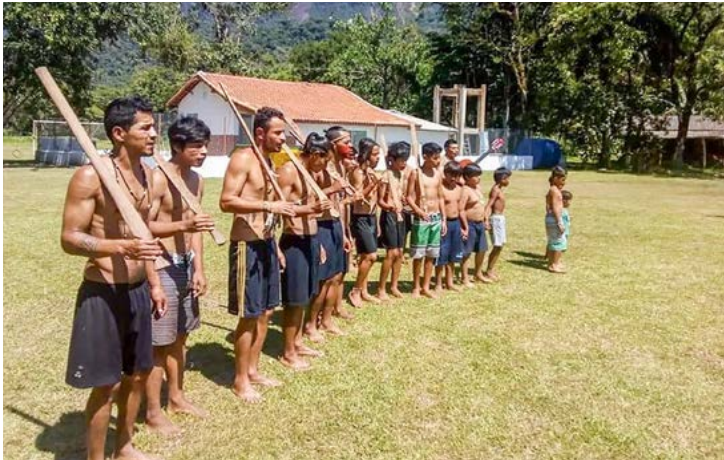
Aldeia Renascer, em Ubatuba; cidade coloca em prática trabalho do Conselho Municipal dos Povos Originários e Comunidades Tradicionais

O Conselho será composto por dezesseis membros titulares e respectivos suplentes, dos quais nove serão da sociedade civil (duas cadeiras para indígenas, duas para quilombolas, duas para caiçaras e três para