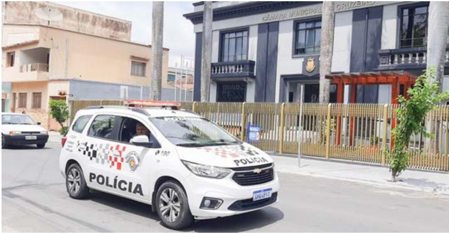
Policiamento realizado na região central de Cruzeiro; cidade continua com índices alarmantes de homicídios neste ano e reforça cuidados