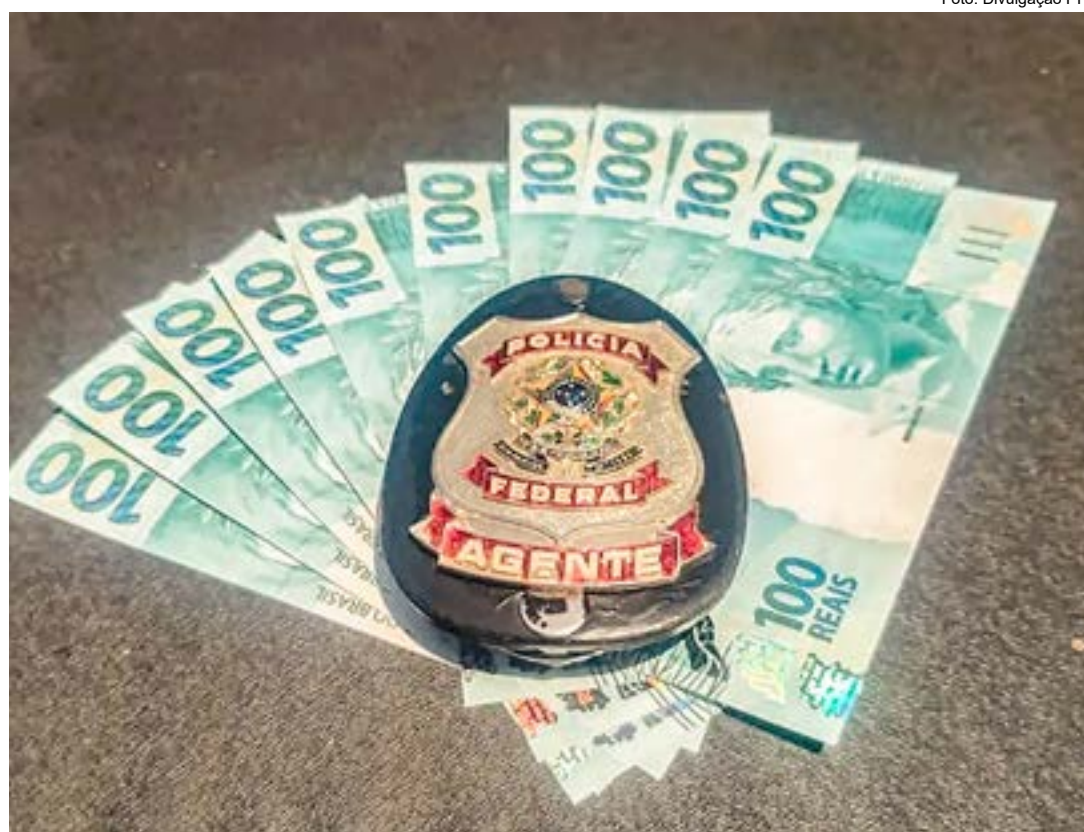
Notas falsas flagrada em Cunha; nova operação realizada pela Polícia Federal tenta coibir circulação

Na ocasião, um morador de Potim, de 22 anos, foi preso em flagrante em sua casa após ser flagrado com uma cédula falsificada de R$ 50. Ele poderá ser condenado de 3 a 12 anos de prisão pelo crime de aquisição de moeda falsa. Os policiais averiguaram também a residência de um jovem de 20 anos de Lorena, que havia sido preso pela PF em 29 de dezembro do ano passado com vinte notas falsas de R$50. Como estava sem qualquer tipo de material indevido, ele não foi detido na operação do mês passado, assim como o outro morador de Lorena e o de Guaratinguetá, que também tiveram suas casas vistoriadas. Os quatro alvos da operação seguem sendo investigados pela PF, que acredita que eles podem ter comprado notas falsas pela internet e as introduzido nos comércios locais.