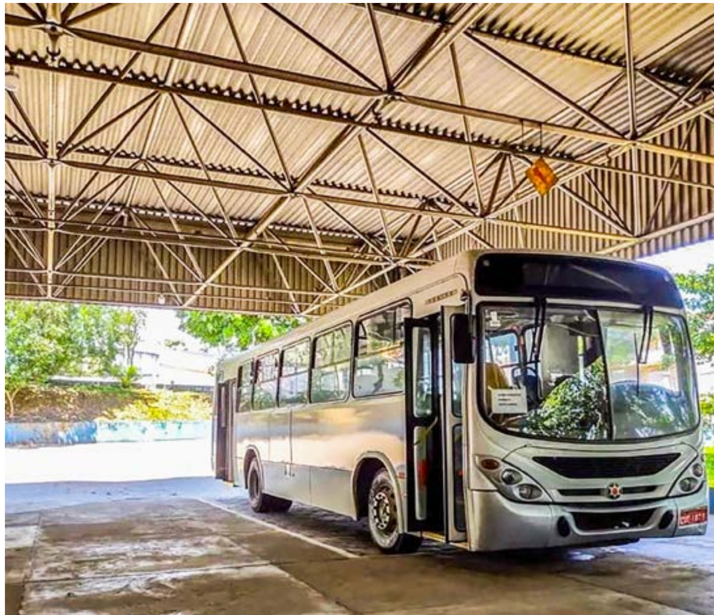
Ônibus que faz uma das duas linhas entre bairros em Cachoeira Paulista; Prefeitura anuncia cobrança por passagem após período de gratuidade