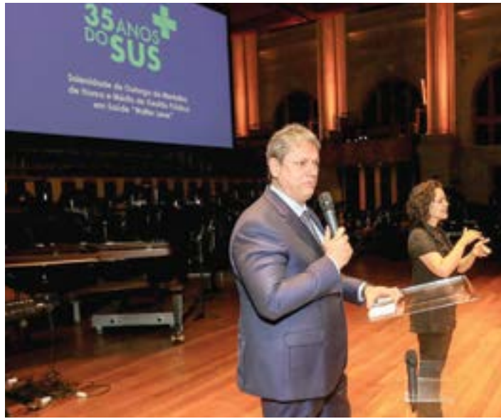
Cerimônia do Estado onde foi anunciado aumento do repasse na saúde

Os 62 municípios considerados mais socialmente vulneráveis receberão o maior valor, R$ 35 por habitantes. Os 92 classificados na faixa seguinte terão R$ 30 enquanto as 162 cidades da próxima faixa re-