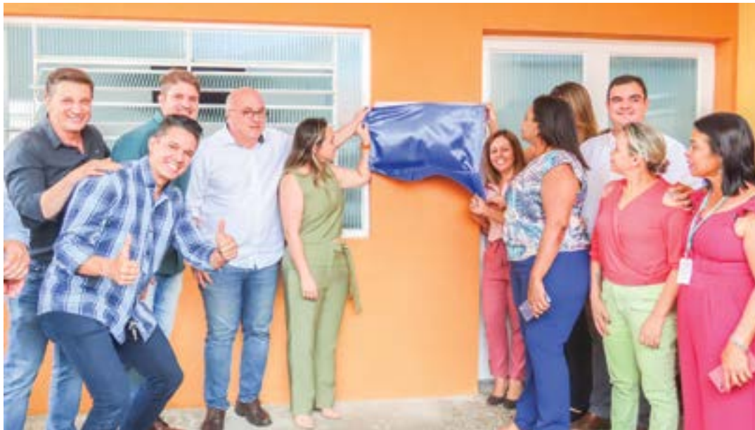
Evento de reinauguração da unidade de saúde no Araretama; ESF contou com emenda para ampliação