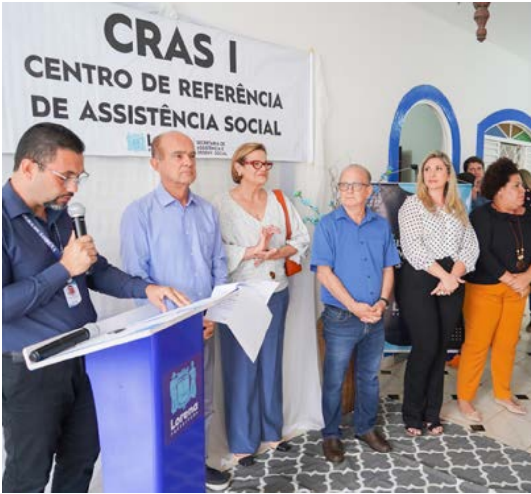
Evento de inauguração de sede para atendimento do Cras no Bairro da Cruz; serviço é ampliado em Lorena

“Com os novos espaços temos mais amplitude e facilidade de acesso. Podem ser realizadas mais ações preventivas em parceria com as instituições do terceiro setor, que já são parceiros e agora contam com espaços mais amplos e aconche-