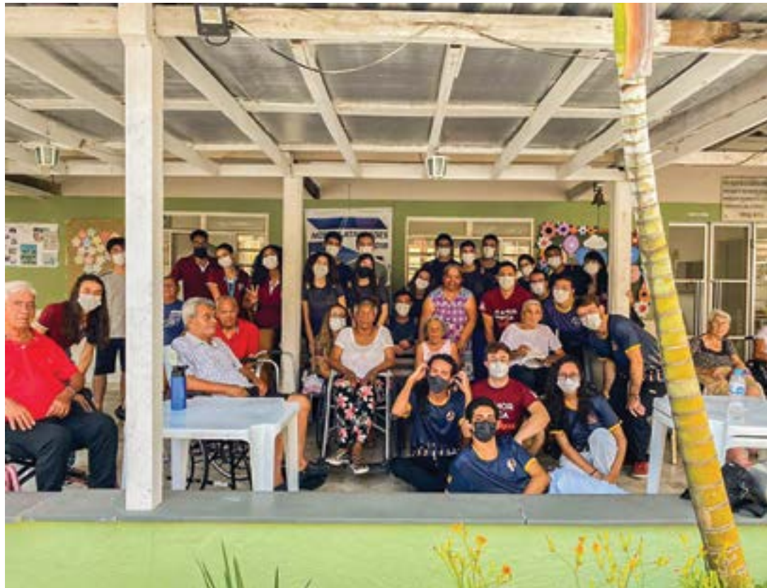
Ação da ONG Idoso Amigo em instituição de longa permanência; jantar conta com alunos de gastronomia