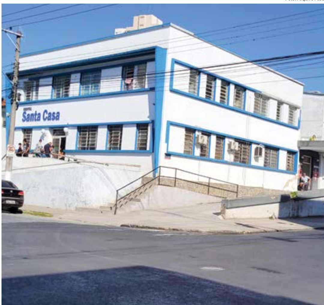
Hospital Santa Casa de Cruzeiro, que registrou um caso de meningite bacteriana; atenção com sintomas