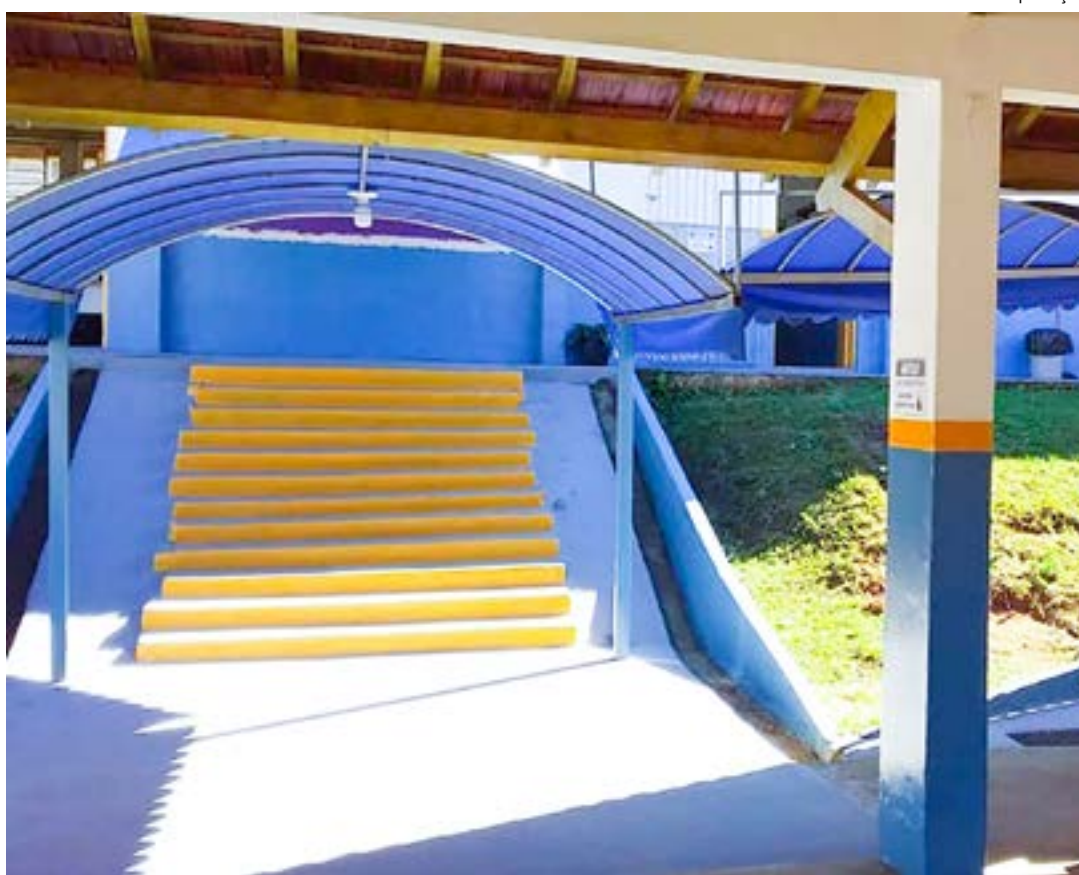
Escola Aurora de Andrade Cardoso, no bairro dos Macacos, alvo de fake news divulgada pelo ex-prefeito