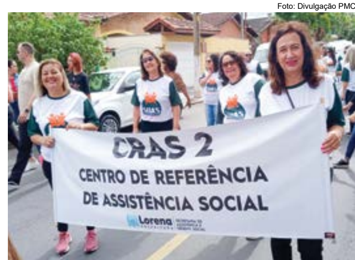
Parte da equipe do Cras em evento em Lorena, que ganha novas sedes

bilam o acesso da população aos serviços, benefícios e projetos assistenciais em Lorena. Além disso, o serviço tem como foco fortalecer a convivência das famílias com a comunidade no entorno. Os moradores também recebem orientações e podem ser inscritos no CadÚnico (Cadastro Único) do Governo Federal.