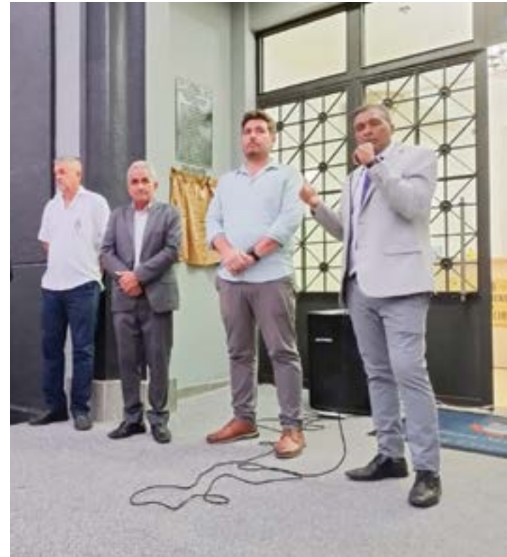
O presidente Gordo da Vila Batista inaugura nova sede da Câmara

Depois de mais de um ano de reforma, o prédio da Câmara de Cruzeiro foi reinaugurado no fim da tarde da segunda-feira (9). Viabilizada por um investimento de R$ 1,275 milhão, a realização da obra teve como objetivo garantir mais segurança aos vereadores, servidores e o público que