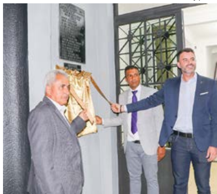
Prefeito e vereadores durante a cerimônia de reinauguração da sede