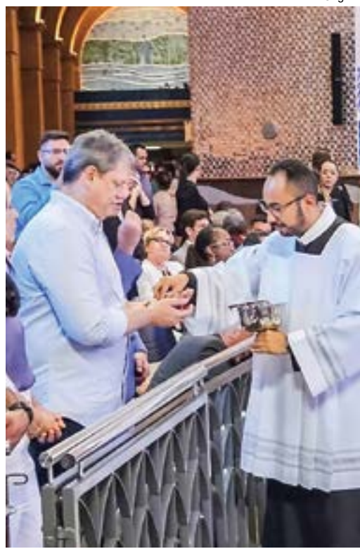
Tarcísio de Freitas, em missa no Santuário; anúncio