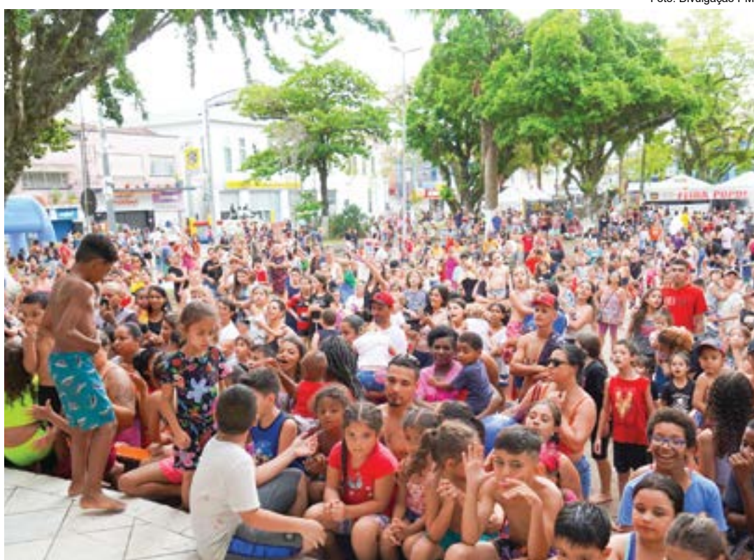
Crianças lotam a praça Arnolfo Azevedo, no dia 12