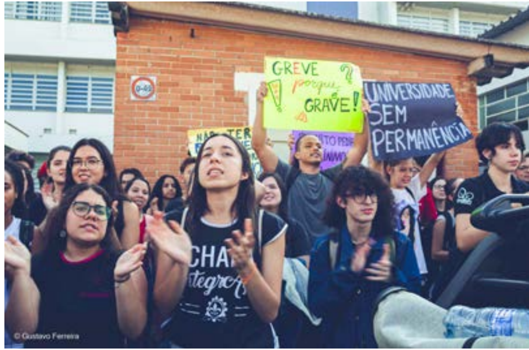
Alunos da EEL participam de manifestação; depois de negociações, aulas são normalizadas em Lorena

Não houve especificação da quantidade de profissionais