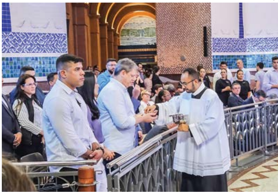
Tarcísio de Freitas durante missa no Santuário Nacional; proposta de prolongar rodovia foi citada no feriado

A proposta foi confirmada nesta quinta-feira (12), durante coletiva de imprensa do governador, após sua participação na missa solene da Festa de Nossa Senhora, no Santuário Nacional de Aparecida. “Estamos estudando o prolongamento da Carvalho