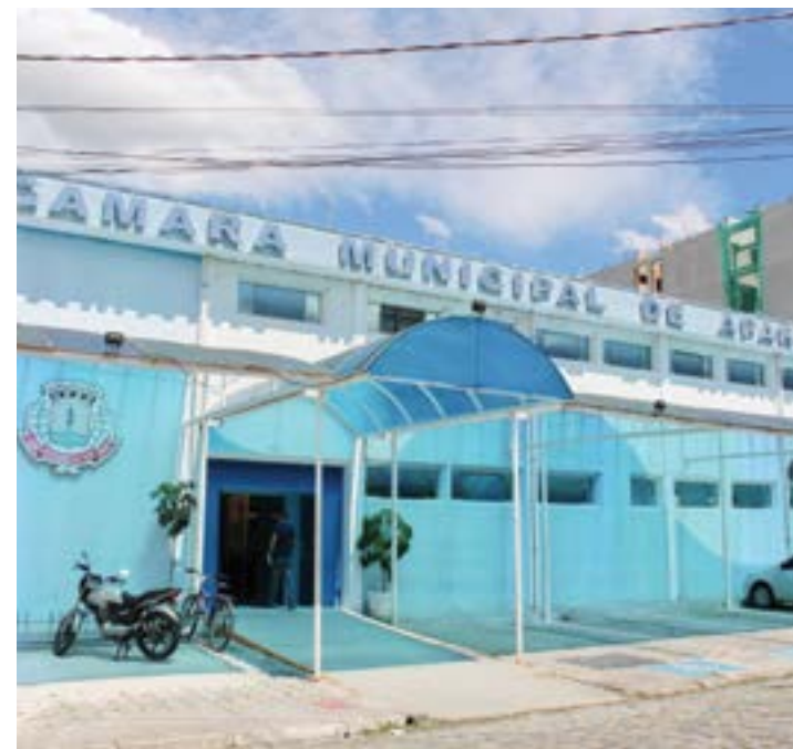
Sede da Câmara de Aparecida; Vunesp e Legislativo esperam recursos

lativo e Vunesp devem se reunir para decidir qual medida será tomada após os recursos. "Ou serão consideradas somente 42 questões válidas ou se aplica nova prova, em data ainda a ser definida, sobre as oito questões de direito administrativo, fundamentais para o cargo a ser preenchido".