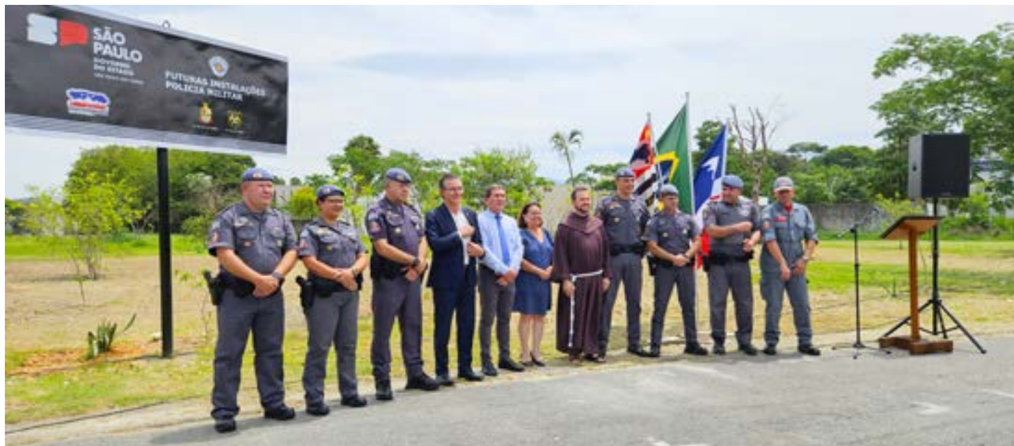
Representantes da Polícia Militar, Prefeitura, Câmara e Igreja durante evento de lançamento da construção de novo batalhão em Guaratinguetá

O quartel da polícia funciona hoje às margens da rodovia Presidente Dutra, no bairro da Figueira. Com a aprovação da doação da área pública, por unanimidade,