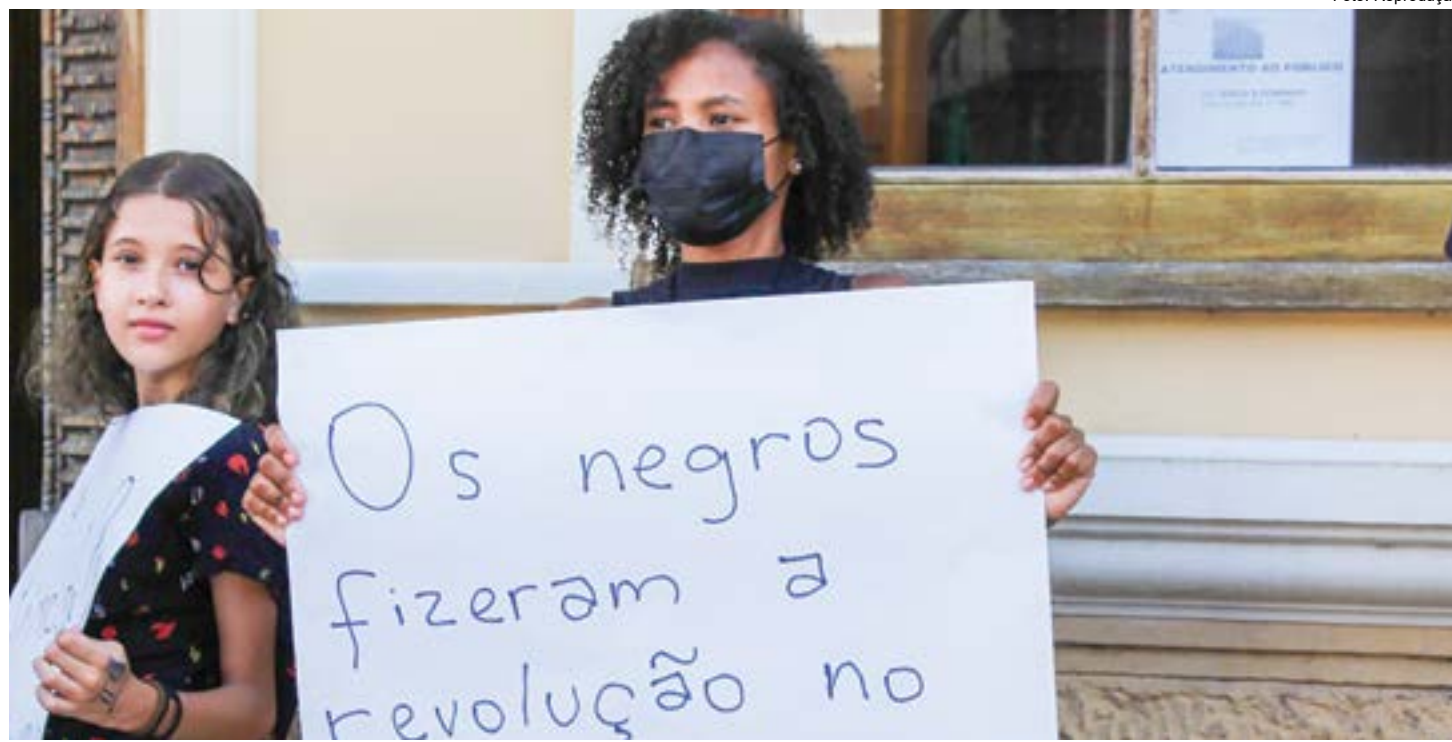
Jovem destaca falas negras durante manifestação realizada em 2022; cidade amplia participação em debates e promete mais apelo por causas