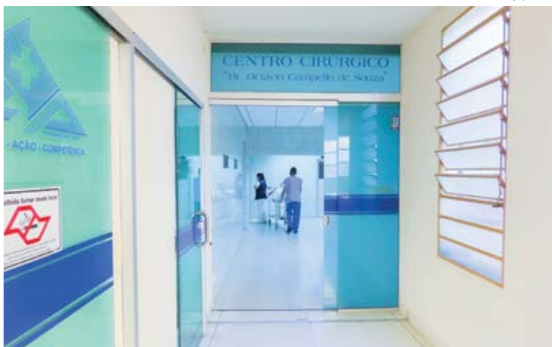
Centro cirúrgico do hospital de Pindamonhangaba; cidade convoca médicos aprovados em concurso público

mo dia 19 para apresentar a documentação exigida pelo edital do certame, que teve sua prova de conhecimentos gerais e específicos aplicada em