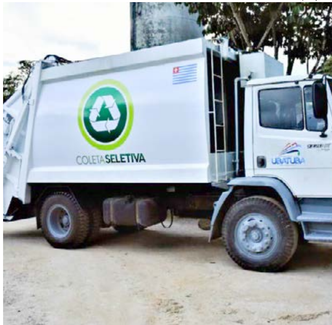
Caminhão da Prefeitura para coleta seletiva; medidas tiram mais de quatrocentas toneladas de aterro