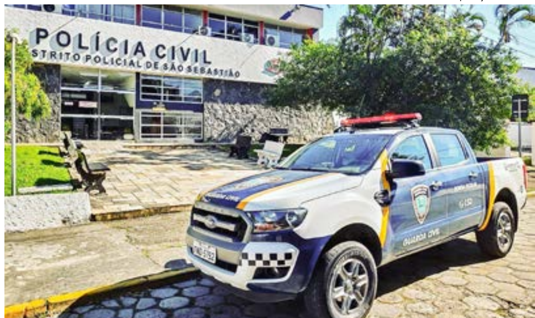
Viatura da GCM de São Sebastião; concurso é suspenso depois de MP alertar sobre incoerências no edital

Oferecendo um salário inicial de R$ 3.217,95, o concurso previa ampliar de 57 para 107 o número de GCM's atuando na cidade a partir do ano que vem.