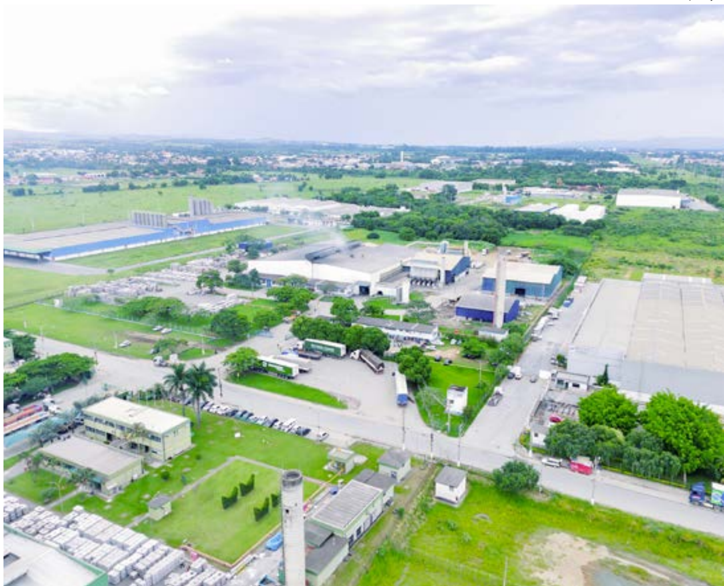
Polo industrial no distrito Moreira César, Pindamonhangaba é a segunda cidade da região que mais gerou empregos nos primeiros oito meses 2023