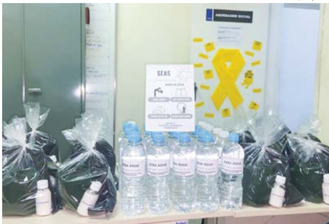
Kit Calor distribuído pela Prefeitura de Pinda, para que pessoas em situação de rua se protejam do Sol

Um levantamento da secretaria de Saúde do Estado de São Paulo registrou aumento de 102,5% nos atendimentos ambulatoriais e internações causadas pela exposição ao calor nos sete primeiros meses do ano, em comparação com o mesmo período de 2022. Cinco