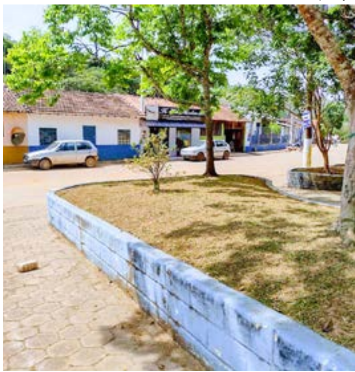
Rua no São Miguel, em Cachoeira; aporte viabiliza saneamento da área