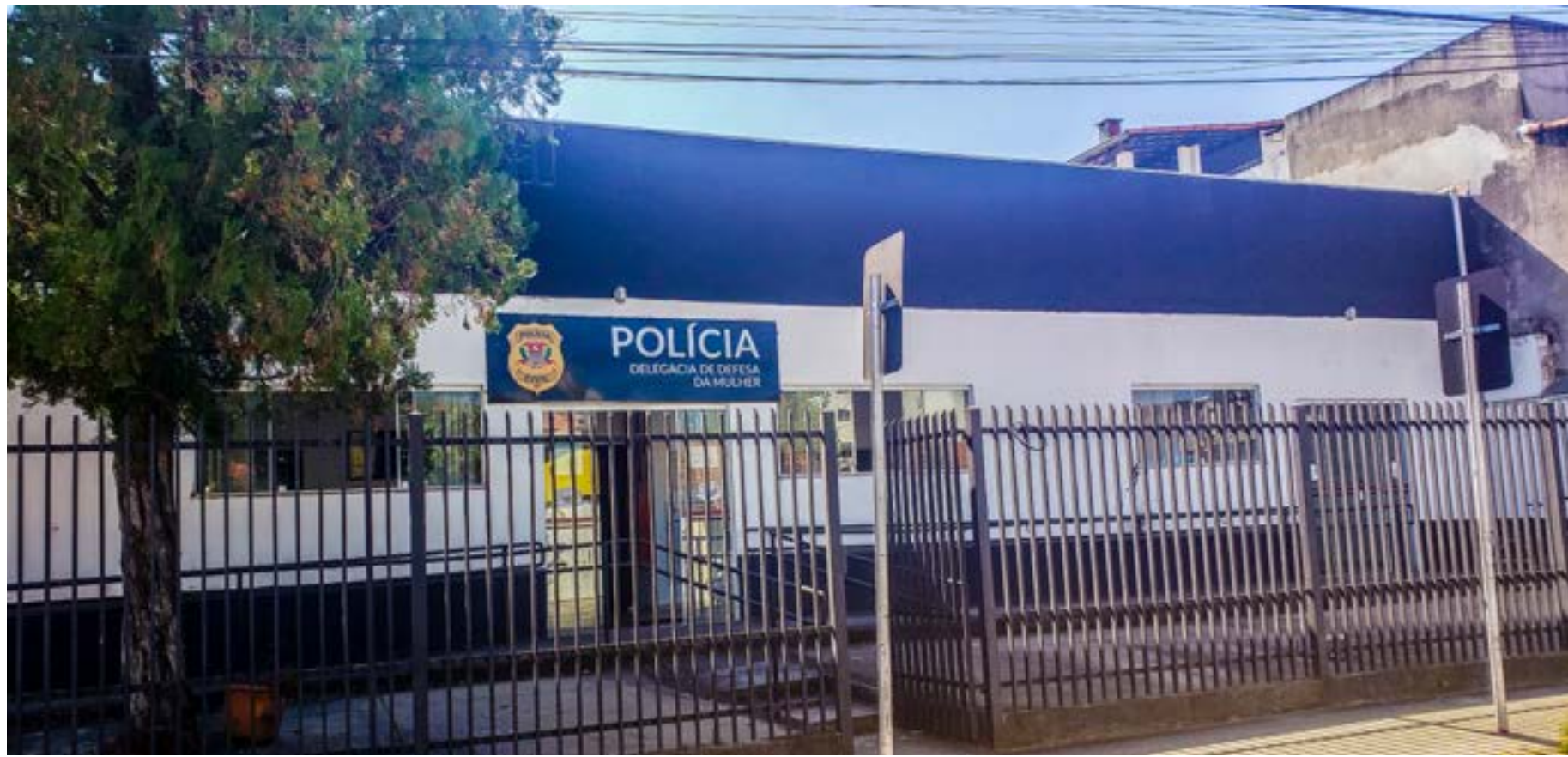
A sede da Delegacia de Defesa da Mulher, que atende no Centro de Lorena; crime de estupro aumenta nas cidades da região durante oito meses de 2023 e preocupação também cresce