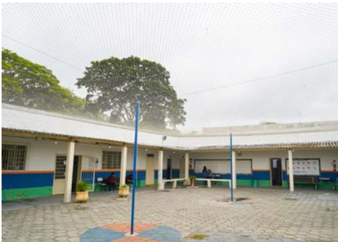
Pátio da Conde Moreira Lima, em Lorena; prédio terá reforma com investimento de mais de R$ 1 milhão