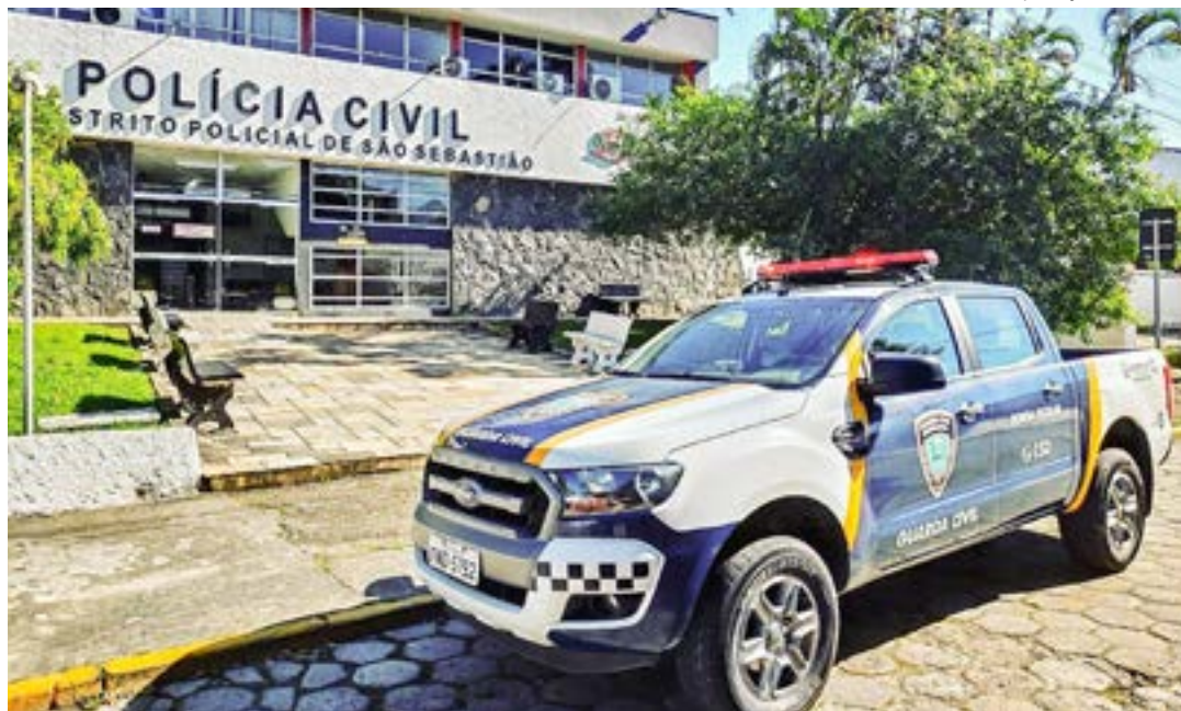
Viatura da GCM de São Sebastião; concurso é suspenso depois de MP alertar sobre incoerências no edital

Concordando com o apontamento de Santana, o juiz ordenou a suspensão do concurso