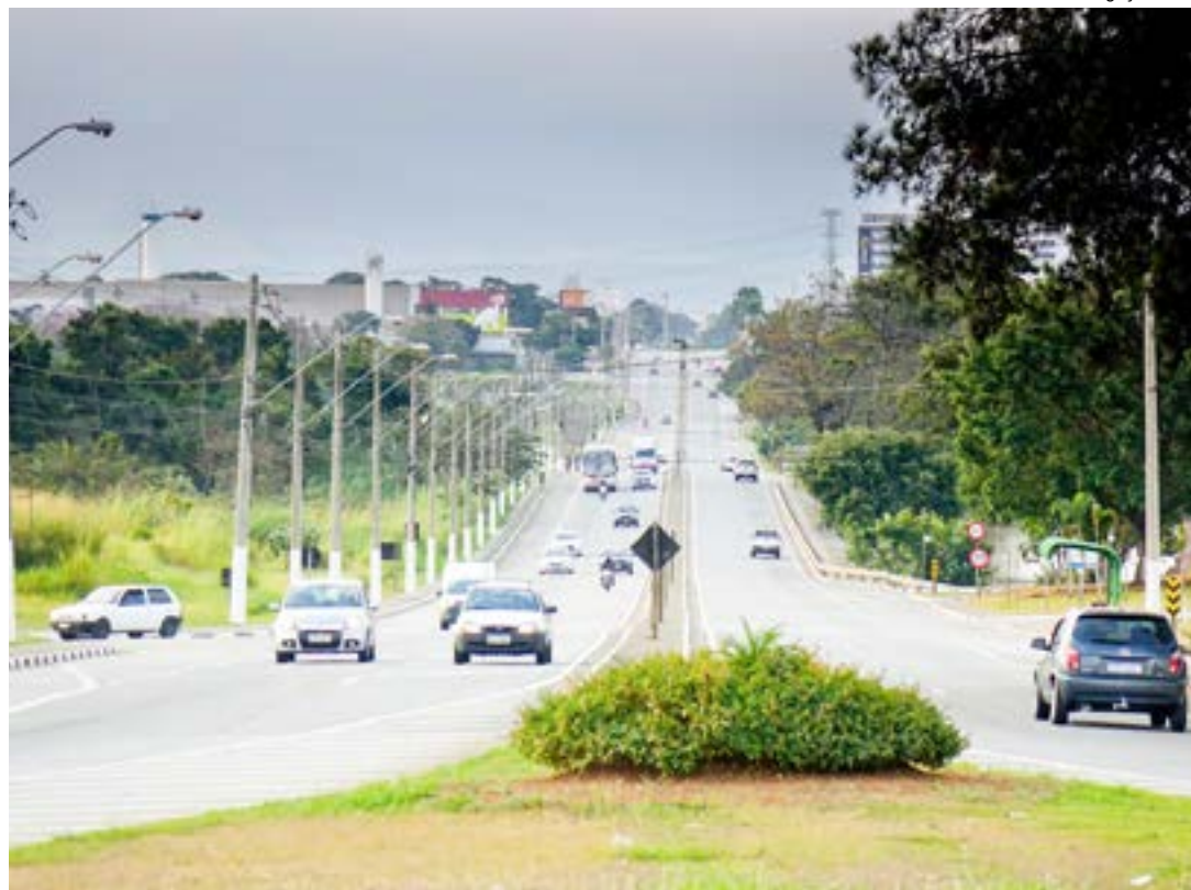
Estrada de acesso a Pinda, que será recapeada com recurso do Estado; 14 quilômetros recuperados