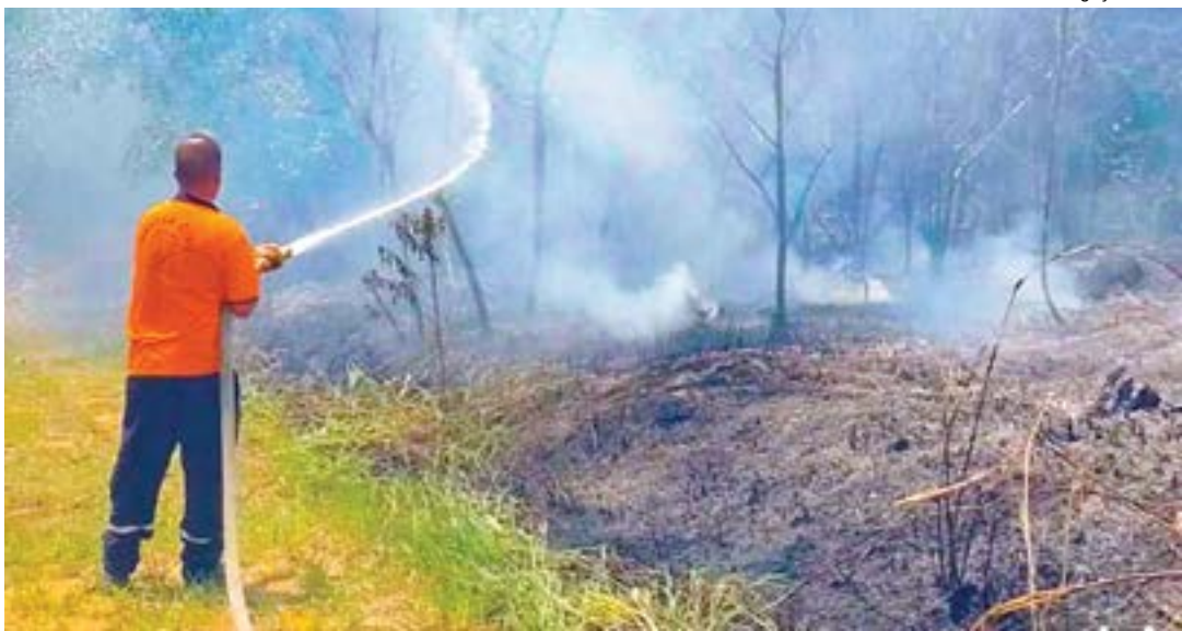
Trabalhos para controle do incêndio na mata do Inpe, em Cachoeira; com tempo seco, queimadas aumentam