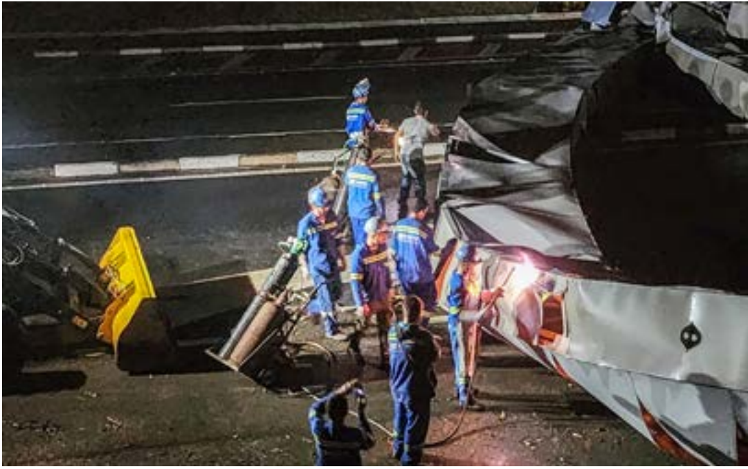
Trabalho da Prefeitura e DER na desobstrução da via após a queda do portal; tempestade causa estragos