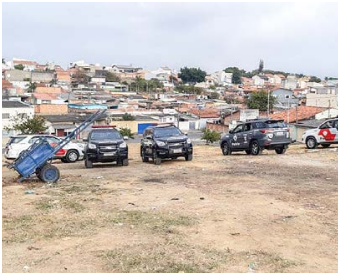
Trabalho das polícias Civil e Militar, em Cruzeiro; estrutura de delegacias terá mudanças na cidade

Segundo Oliveira, o plantão terá atendimento ao público e apresentação de ocorrências pelo período de 24 horas durante todos os dias da semana. Outra mudança é que a partir do próximo dia 3, o 3º Distrito Policial, que atualmente funciona na rua dos Palmares, no bairro Vila Brasil, encerrará suas atividades no local e os policiais da unidade serão redistribuídos para as outras delegacias com o intuito de racionalizar o uso dos recursos humanos e materiais. A DDM (Delegacia de