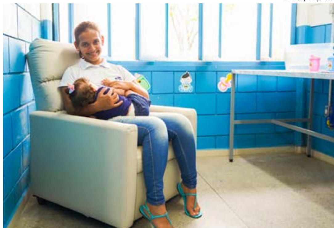
Nova sala de lactário em creche municipal de Lorena; espaços são implantados para facilitar amamentação

Na quarta-feira (27), a secretária de Educação entregou três salas de lactário na creche Professora Norma Paes Tavares de Andrade, no bairro São Roque; Professor Paulo Pereira dos Reis, no Cidade Industrial e na Profes-