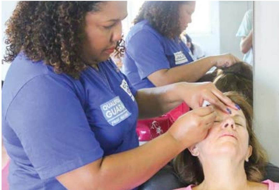
Aula no curso de estética e beleza, uma das opções disponibilizadas no Qualifica Guará; inscrições abertas

Os cursos disponibilizados são de marketing e vendas