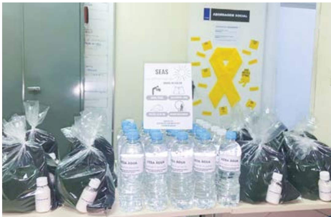
Kit Calor distribuído pela Prefeitura de Pinda, para que pessoas em situação de rua se protejam do Sol

De olho neste cenário, o Serviço Especializado de Abordagem Social da secretaria de Assistência Social passou a distribuir o Kit Calor para a população em situação de rua. O kit contém um boné para proteção solar, protetor solar para cuidar da pele e água para manter a hidratação.