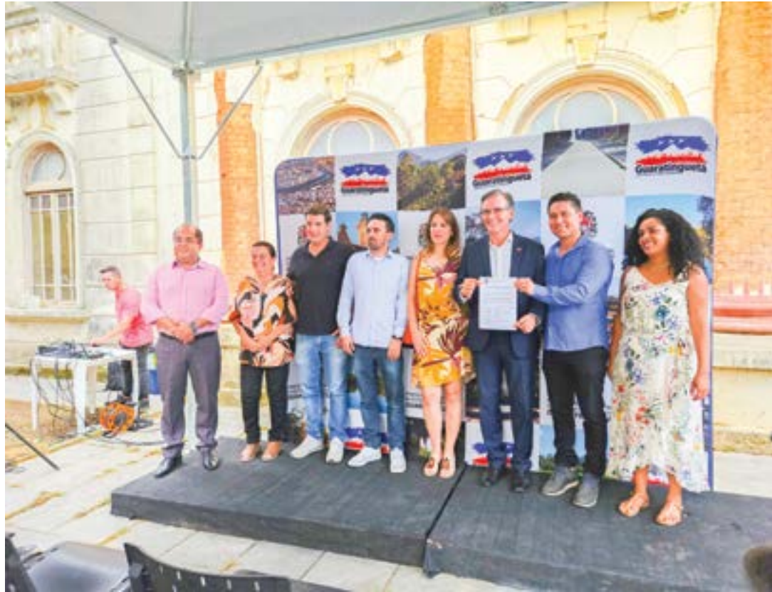
Evento de apresentação para futuro teatro municipal, na antiga Prefeitura, com R$ 10,6 milhões investidos

“É importante nós termos uma obra desse porte, em um prédio histórico que terá sua fachada restaurada. Esse será o resgate como teatro municipal, que vai nos trazer a possibilidade de as companhias teatrais poderem vir a Guaratinguetá fazerem suas apresentações, do desenvolvimento das oficinas de teatro em parceria com a