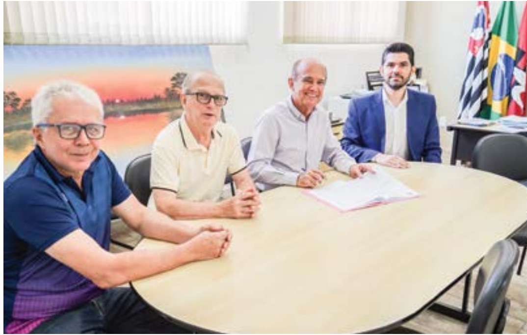
Reunião para assinatura do projeto de implantação do sistema 5G em Lorena; cidade aguarda Anatel

Considerada por especialistas em tecnologia como um avanço significativo na