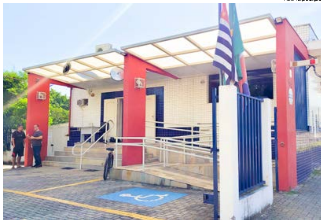
Principal acesso ao prédio da Câmara de Guaratinguetá, que abriu edital para concurso; apenas uma vaga disponível

Cargo de controlador interno faz conexão direta do Legislativo com o Tribunal de Contas; salário acima de R$ 6 mil