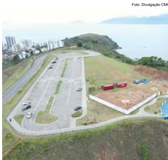
O Complexo Turístico do Camaroeiro, um dos pontos a serem avaliados

Áreas – As obras do Complexo Turístico do Camaroeiro seguem na segunda fase. Nessa etapa, está sendo construído o centro administrativo com banheiros e o centro