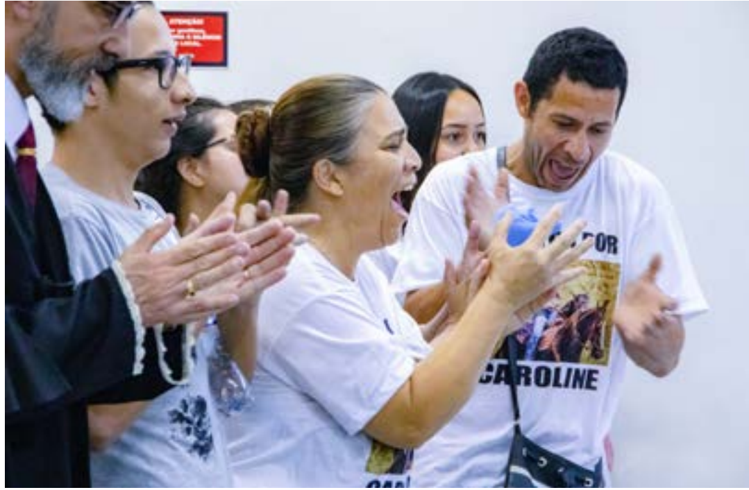
Familia da vítima comemora sentença durante julgamento; assassino é condenado a 32 anos de prisão