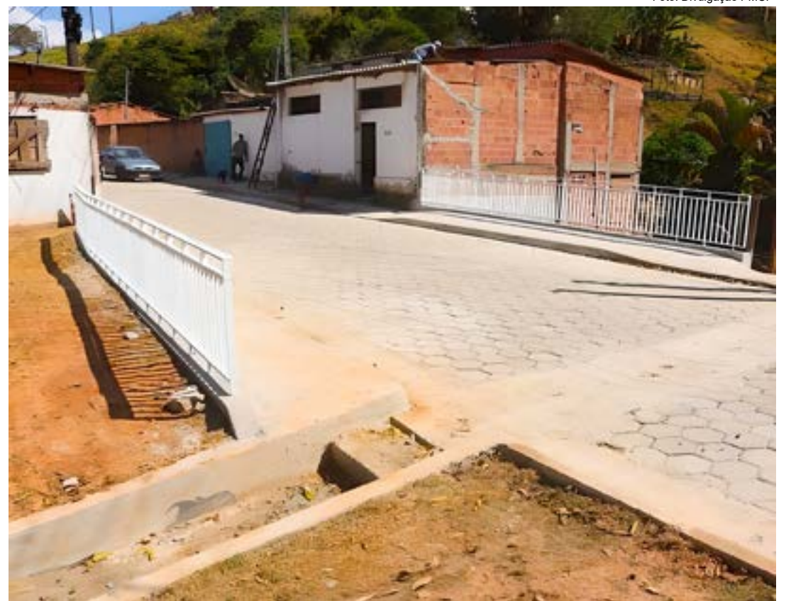
A recém-entregue ponte do bairro Turma 26, que gerou a maior polêmica do ano em Cachoeira Paulista