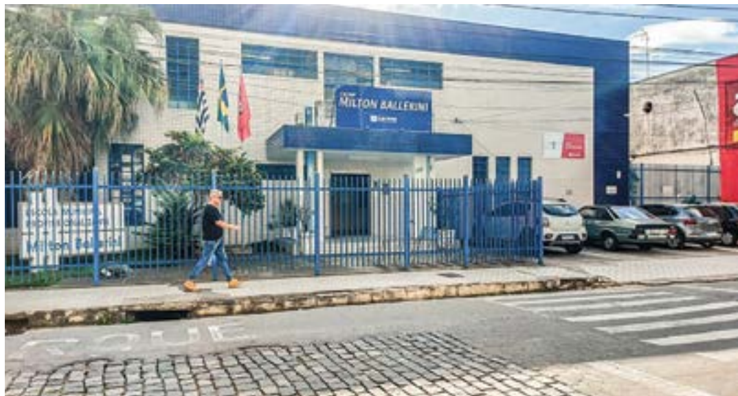
Escola Municipal Profissionalizante Milton Ballerini, que oferece cursos para quase quinhentos moradores