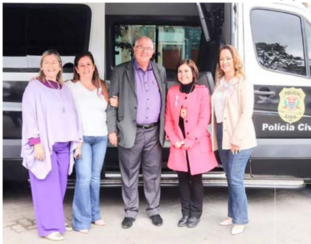
Delegacia de Polícia Móvel da mulher, que atende em Cachoeira Paulista; cidade aposta em políticas públicas

O Conselho é um órgão consultivo, deliberativo e fiscalizador, que tem por finalidade garantir à mulher o pleno exercício de sua cidadania por meio de propostas e políticas públicas relacionadas com a promoção da melhoria das condições de vida e a eliminação de todas as formas de discriminação e violência contra as mesmas. O projeto visa a garantia de igualdade de oportunidades e de direitos, promovendo a integração e a participação das mulheres no