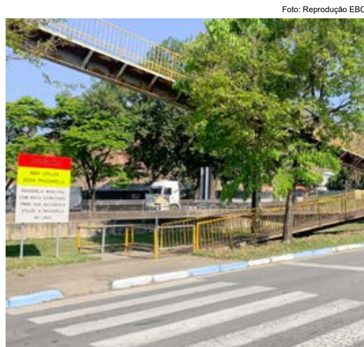
Aviso de interdição da passarela sobre o Km 67 da Via Dutra em 2019

A engenheira destacou que segundo informações dos técnicos da Cati - Regional de Guaratinguetá, a cidade está à frente nas entregas, já que alguns municípios da região ainda não solicitaram o material.