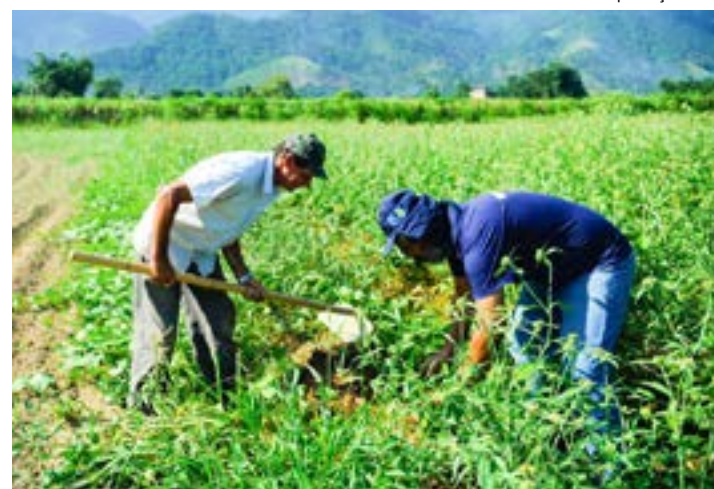
Agricultor cuida da plantação; Programa Rotas Rurais atende Guará

O Rotas Rurais é uma parceria entre a Prefeitura, a secretaria estadual de Agricul-