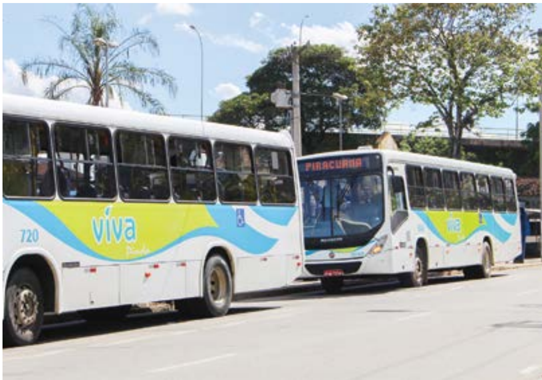
Ônibus da empresa Viva Pinda; além de frota renovada, serviço contará com subsídio na passagem

Em nota oficial, a Prefeitura informou que o passageiro que optar por usar dinheiro ao invés do bilhete eletrônico seguirá tendo o custo de R$ 5,50 por passagem. Além de revelar que o transporte público atende cerca de 13 mil moradores, o Executivo informou que em breve encaminhará à Câmara um projeto que solicitará autorização para que o valor da tarifa aos domingos seja de apenas R$ 1.