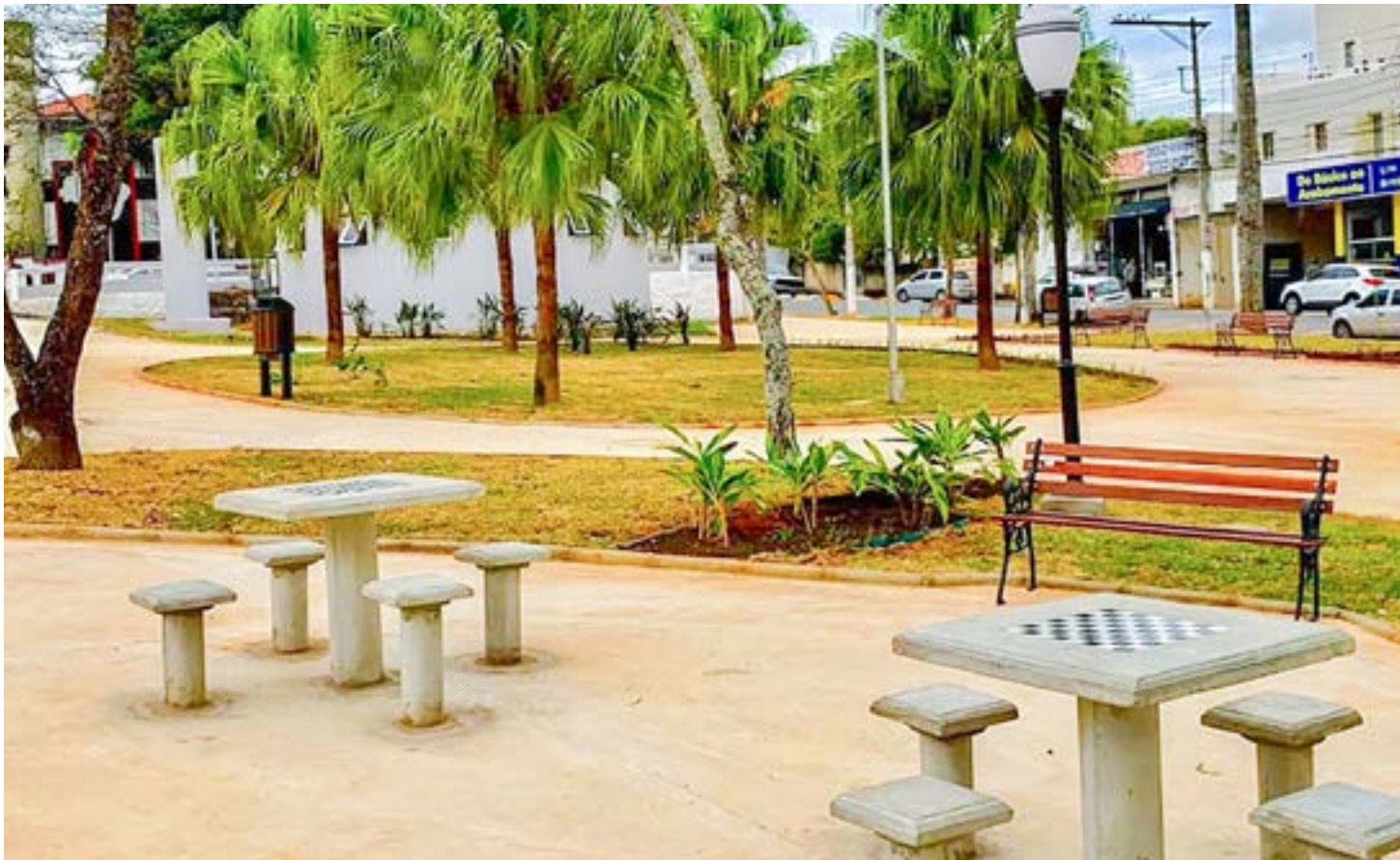
Praça São Benedito teve reforma concluída na última semana; Prefeitura investiu R$ 907 mil em infraestrutura do espaço no bairro São Gonçalo

O prefeito Marcus Soliva (PSB) utilizou as redes sociais para comentar o término da reforma, promovida através de recursos captados junto à Finisa (Financiamento à Infraestrutura e ao Saneamento), linha de crédito da Caixa Econômica Federal voltada ao Setor Público. "Além da equipe da Engeply Engenharia, a obra contou também com uma força-tarefa de diversas secretarias municipais, como a de Meio Ambiente, responsável pela arborização, a de Segurança e Mobilidade Urbana, que auxiliou no trânsito local, e a de Obras, que realizou o acabamento asfáltico do entorno da praça. Essa é mais uma obra de infraestrutura de um local importante do município".