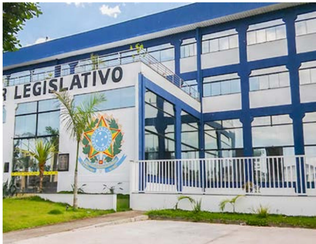
A Câmara de Ubatuba, que passa por crise e denúncias de rachadinhas

Poucas horas antes de ser protocolado o pedido de suspensão da ordem de desocupação, um grupo de moradores realizou uma manifestação em frente ao Paço Municipal. Com cartazes e gritos de protesto, os manifestantes, que haviam promovido um ato semelhante na noite do último dia 5, cobraram uma nova reunião com o prefeito, Marcio Maciel (MDB), que acabou ocorrendo no fim da tarde. Na ocasião, representantes das famílias e do Executivo discutiram alternativas diante do veredicto judicial que exige que o Município realize