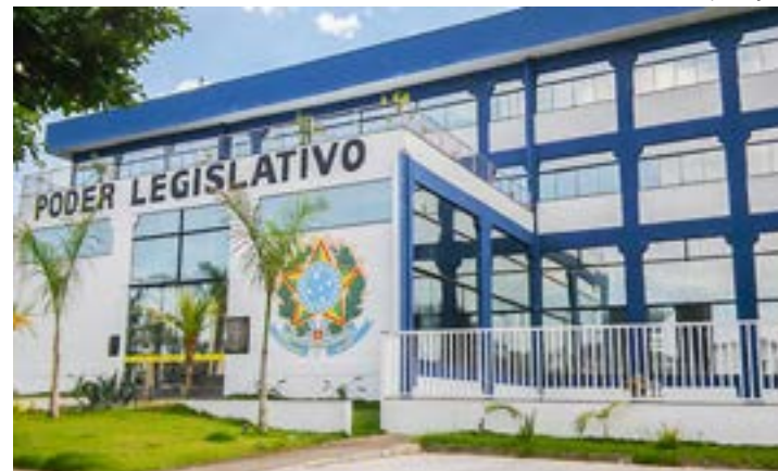
A Câmara de Ubatuba, que passa por crise e denúncias de rachadinhas

Caso seja comprovada a ação indevida, os vereadores, além de perderem os mandatos, responderão por associação criminosa e peculato (crime contra o dinheiro público).