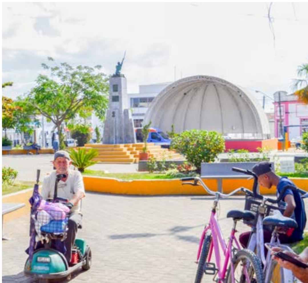
Praça Prado Filho, em Cachoeira Paulista; cidade faz audiência pública para tratar gestão de resíduos sólidos

Entre as ações propostas pelo programa estão a ampliação da utilização de