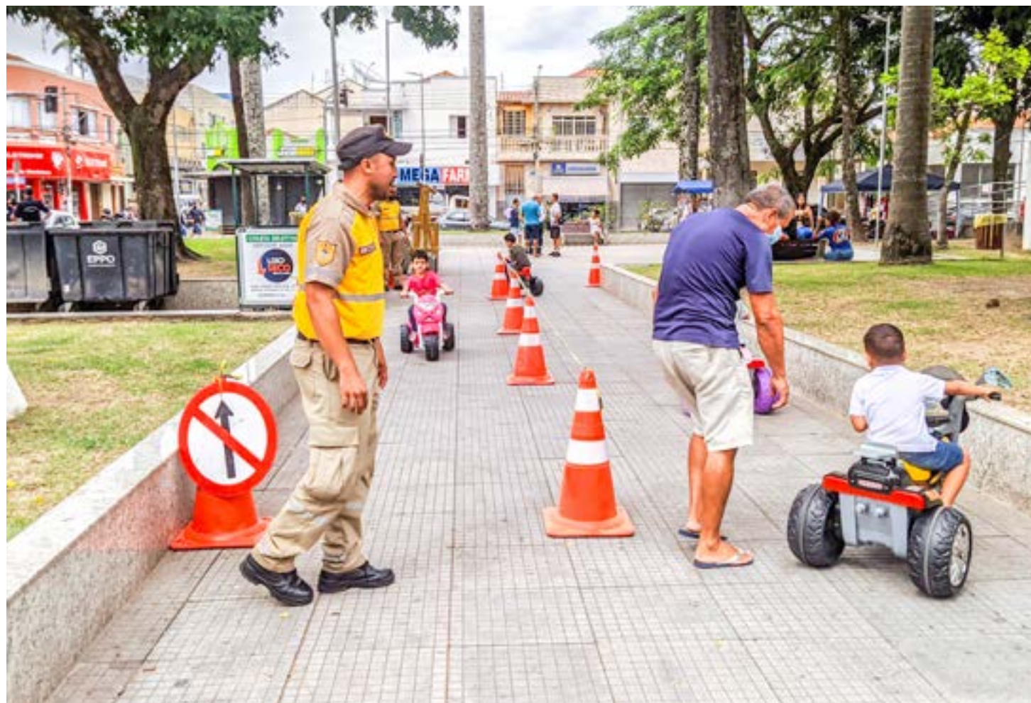
Atividade de edições anteriores da Semana Nacional do Trânsito; secretaria de Lorena quer ampliar conscientização na rede municipal