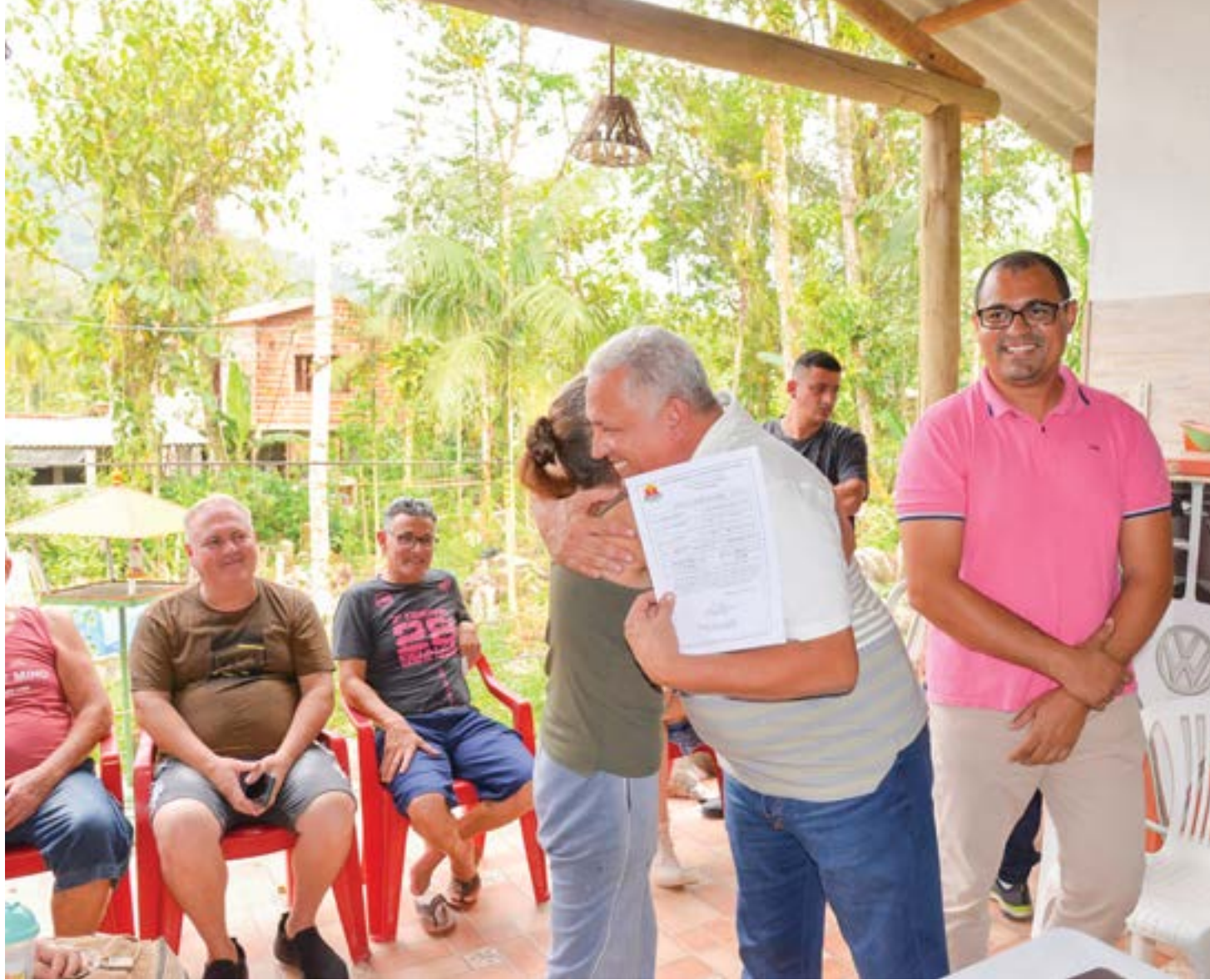
Entrega das escrituras do núcleo Colônia de Férias, em Ubatuba; empresas são contatadas para fornecerem água e energia para a comunidade

Localizada na região oeste da cidade, mais precisamente aos pés da Serra do Mar, a área começou a ser ocupada por famílias de baixa renda em 2007. Atendendo ao pedido dos moradores, a