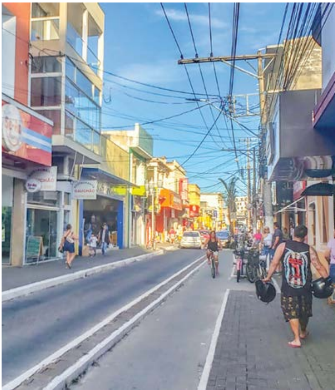
A rua Dr. Rodrigues de Azevedo, principal trecho do comércio a céu aberto; Prefeitura inicia melhorias