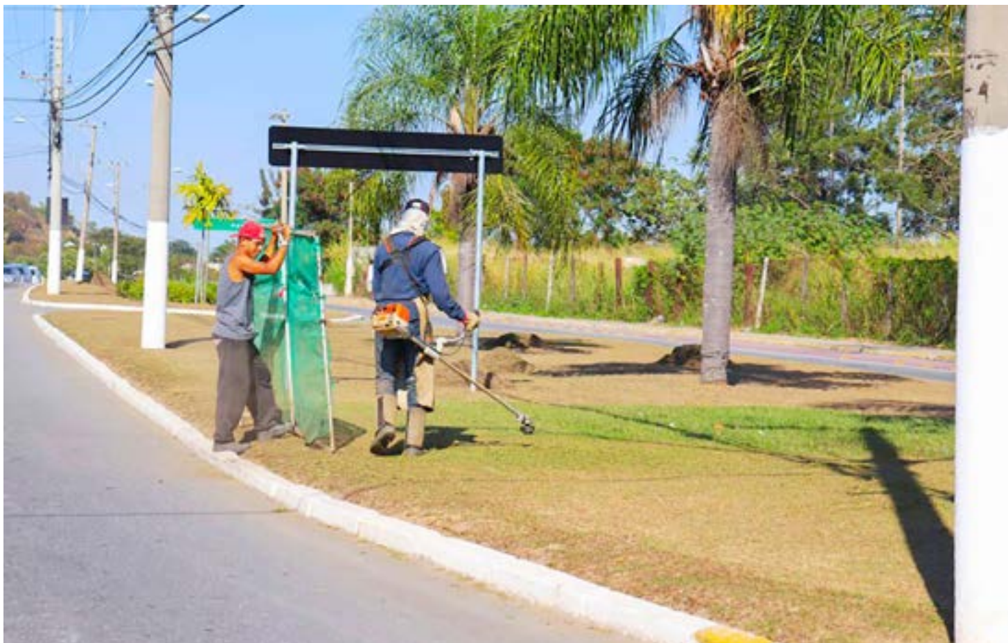
Serviços realizados pela Frente de Trabalho em área de acesso em Lorena; administração municipal abre inscrições na próxima segunda-feira

Instituído em 16 de dezembro de 2021 pelo prefeito Sylvio Ballerini (PSD), o Frente de Trabalho já beneficiou aproximadamente quatrocentos moradores desempregados.