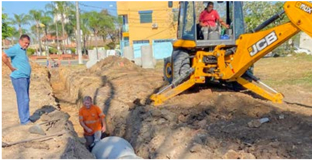
Trabalho para implantação de galerias pluviais para a Vila Geny; medidas procuram evitar alagamentos

implantação de uma nova rede de galeria de águas pluviais (provenientes da chuva) na rua Teófilo de Freitas Castro Júnior. Segundo a Prefeitura, estão sendo instaladas na via manilhas de sessenta centímetros de diâmetro, que são tubos de concreto que facilitam o transporte da água, e duas caixas de drenagem, objetos que possibilitam a limpeza do sistema de tubulação. Além dessas duas melhorias, os profissionais realizam a manutenção de uma antiga rede de manilhas de cinquenta centímetros de diâmetro.