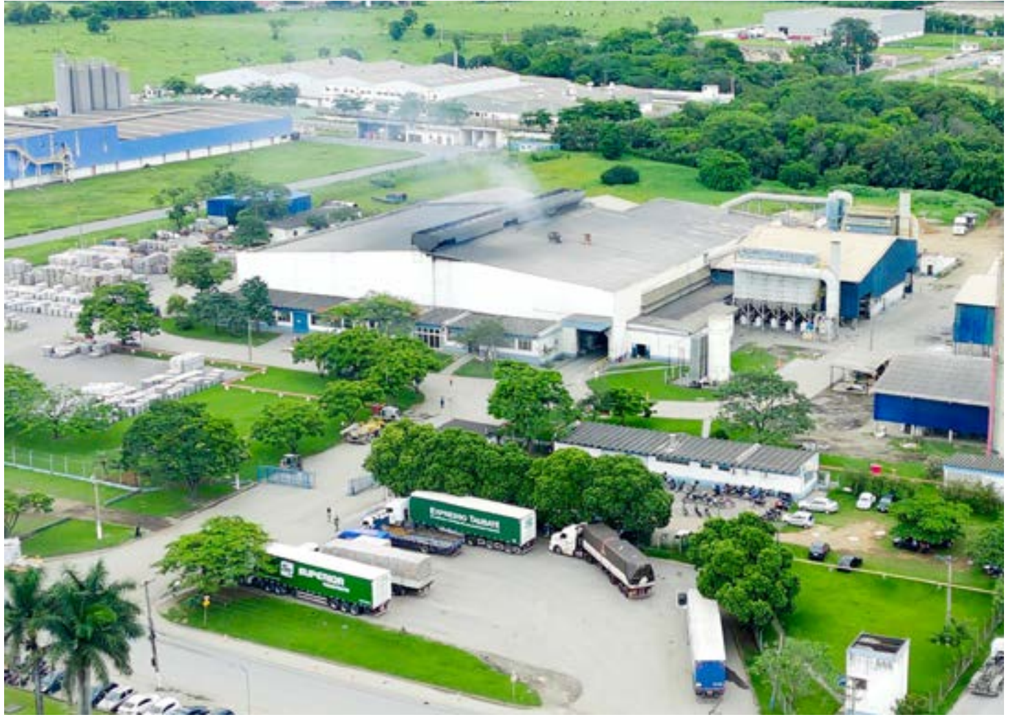
Área industrial em Pindamonhangaba; Prefeitura lança edital para concessão de terrenos a empresas para atrair novos investimentos

No início do ano, a Prefeitura publicou a Lei Complementar nº 70/2023 que normatizou as regras para a