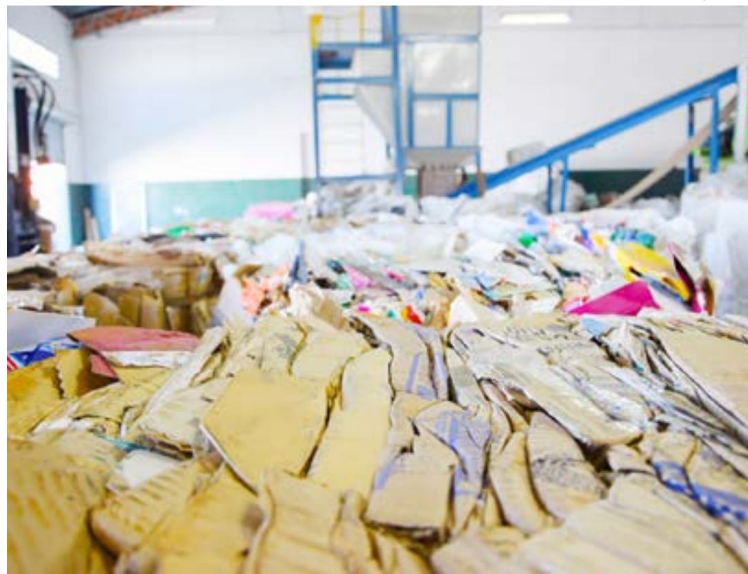
Papelões recolhidos para trabalho de reciclagem; Aparecida dá início cadastro em materiais recicláveis