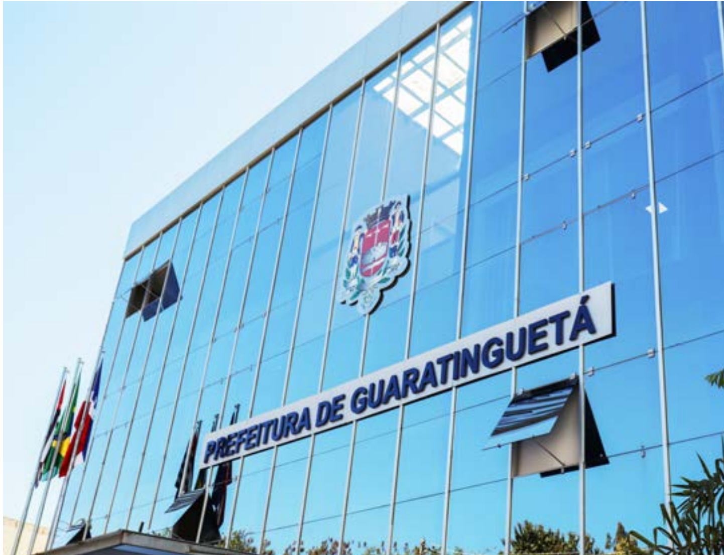
A sede da Prefeitura de Guaratinguetá, que teve projeto de anistia de juros e multas de débitos municipais aprovado pela Câmara na última semana