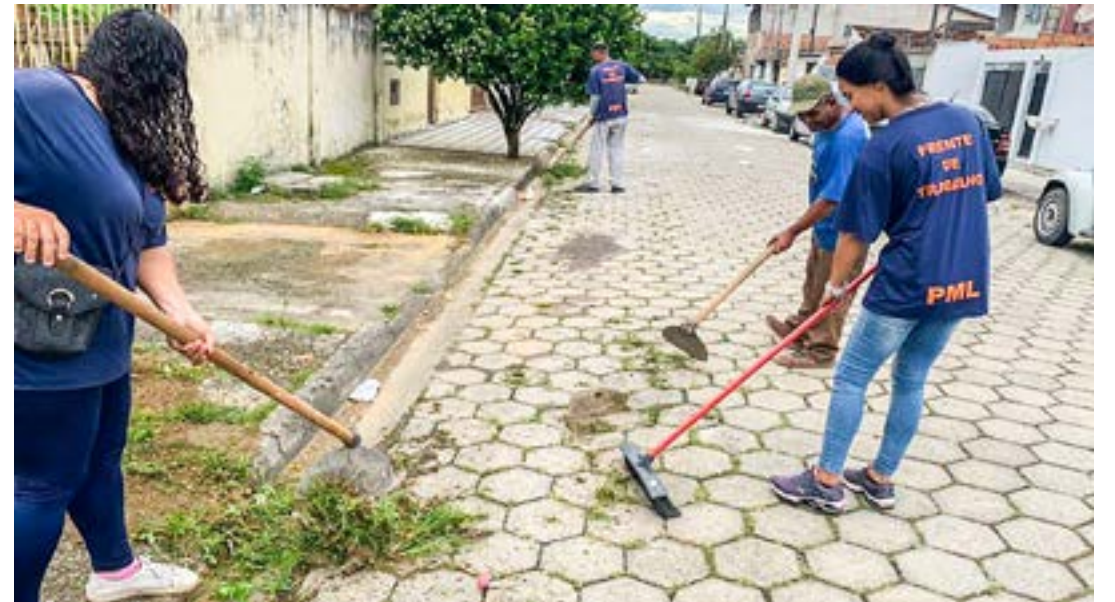
Serviços prestados pela Frente de Trabalho em limpeza das ruas de Lorena; nova fase convoca 126 pessoas