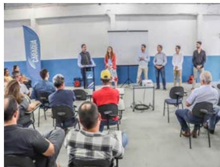
Lançamento do "Edifica"; projeto prepara profissionais para construção