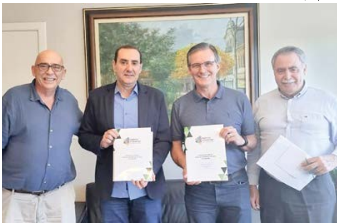
Assinatura de convênio entre São José e Guará, que será incluída na Agência Ambiental do Vale do Paraíba

O Consórcio Agência Ambiental do Vale do Paraíba é uma iniciativa intermunicipal e já conta com a participação de outros seis municípios da região, São