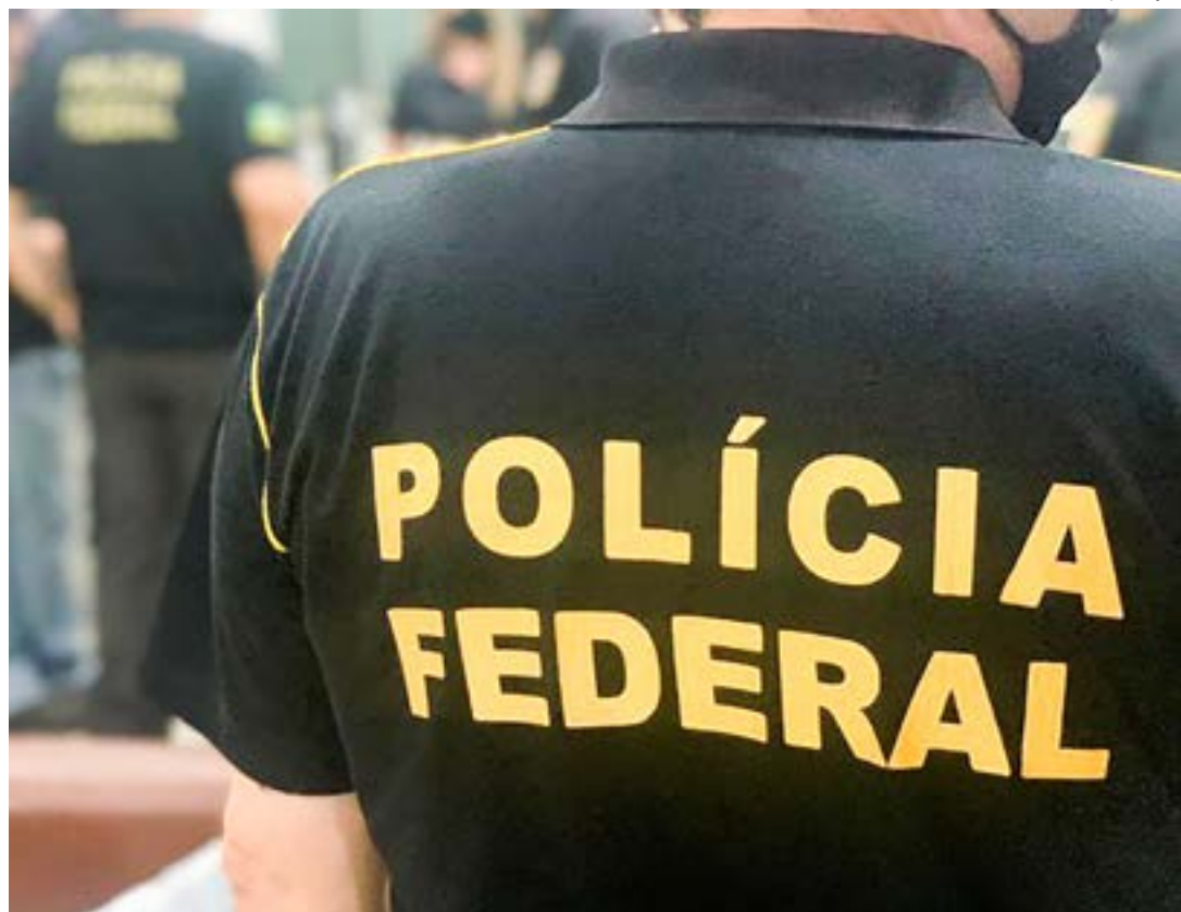
Agentes da Polícia Federal, que em parceria com a Polícia Civil apreenderam armas em ação na RMVale

Policiais recolhem armas de fogo e dinheiro; ações totalizam cumprimento de 13 mandados de busca e apreensão