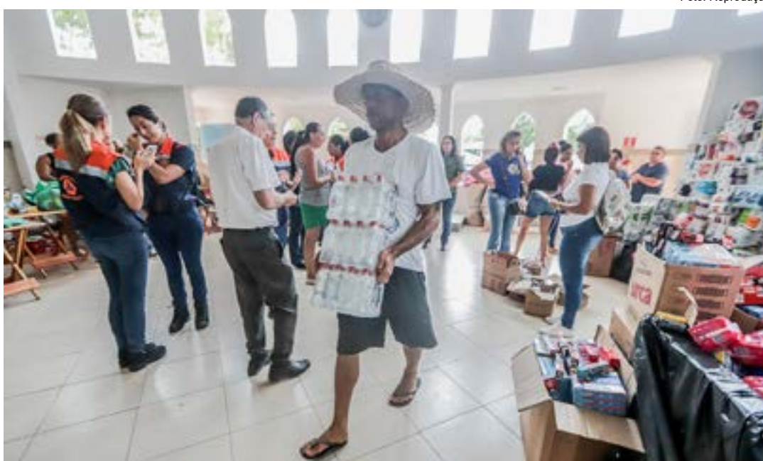
Assistência às famílias que perderam pertences e parentes nas chuvas de janeiro; Estado inicia realocação

Localizada na rua das Mangueiras, no bairro Topolândia, a Vila de Passagem 1 começou na manhã da última quinta-feira a receber seus primeiros moradores temporários, que estavam desde 13 de março