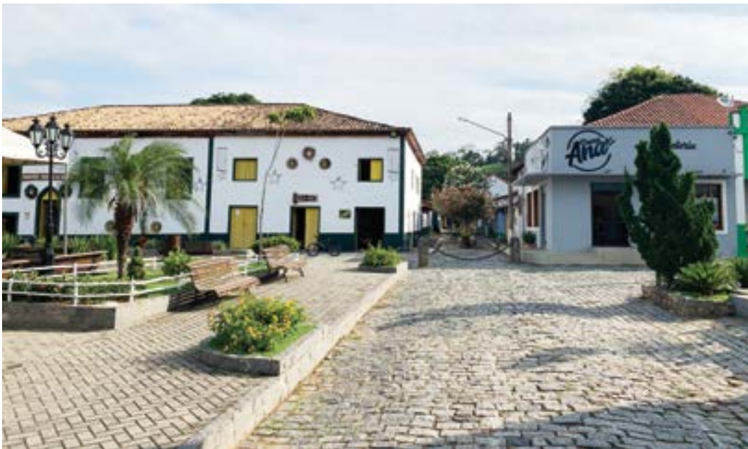
A sede da Prefeitura de Silveiras, que tenta aumentar valor de benefício para servidores municipais