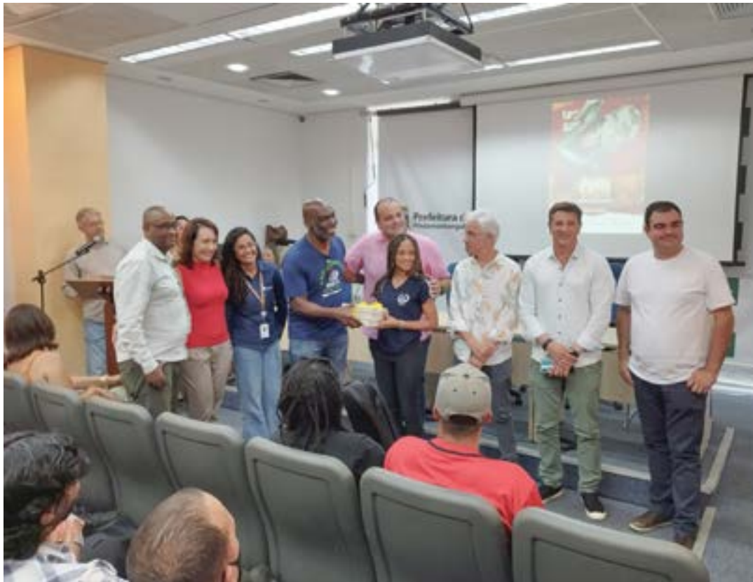
Lançamento da programação Raízes em Pinda; sábado marcado por ações de cuidados e conscientização

O Cisas de Moreira César terá coleta de sangue para detecção de anemia falciforme, das 7h às 11h. O exame pode ser feito por qualquer pessoa, porém o foco da iniciativa são os afrodescendentes. No Brasil, a incidência da doença está presente em 8% dos negros, mas devido a intensa miscigenação historicamente ocorrida no país, pode ser observada também em pessoas brancas ou pardas, de acordo com dados do Ministério da Saúde.