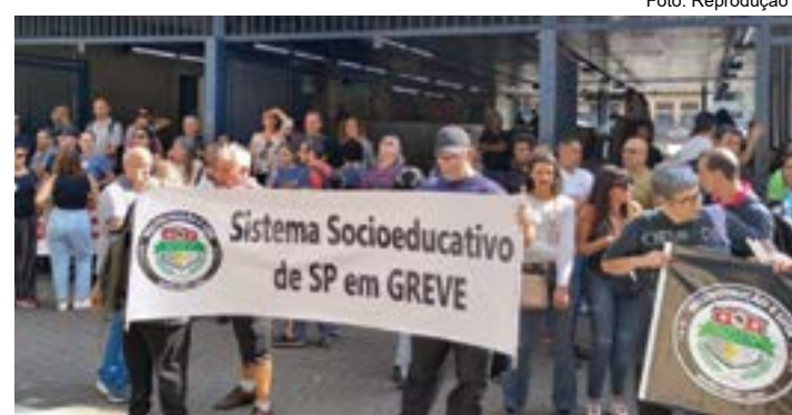
Funcionários da Fundação Casa, que cruzaram os braços na região

Funcionários da Fundação Casa seguem em greve, afetando cinco unidades da região. A paralisação foi motivada pelo