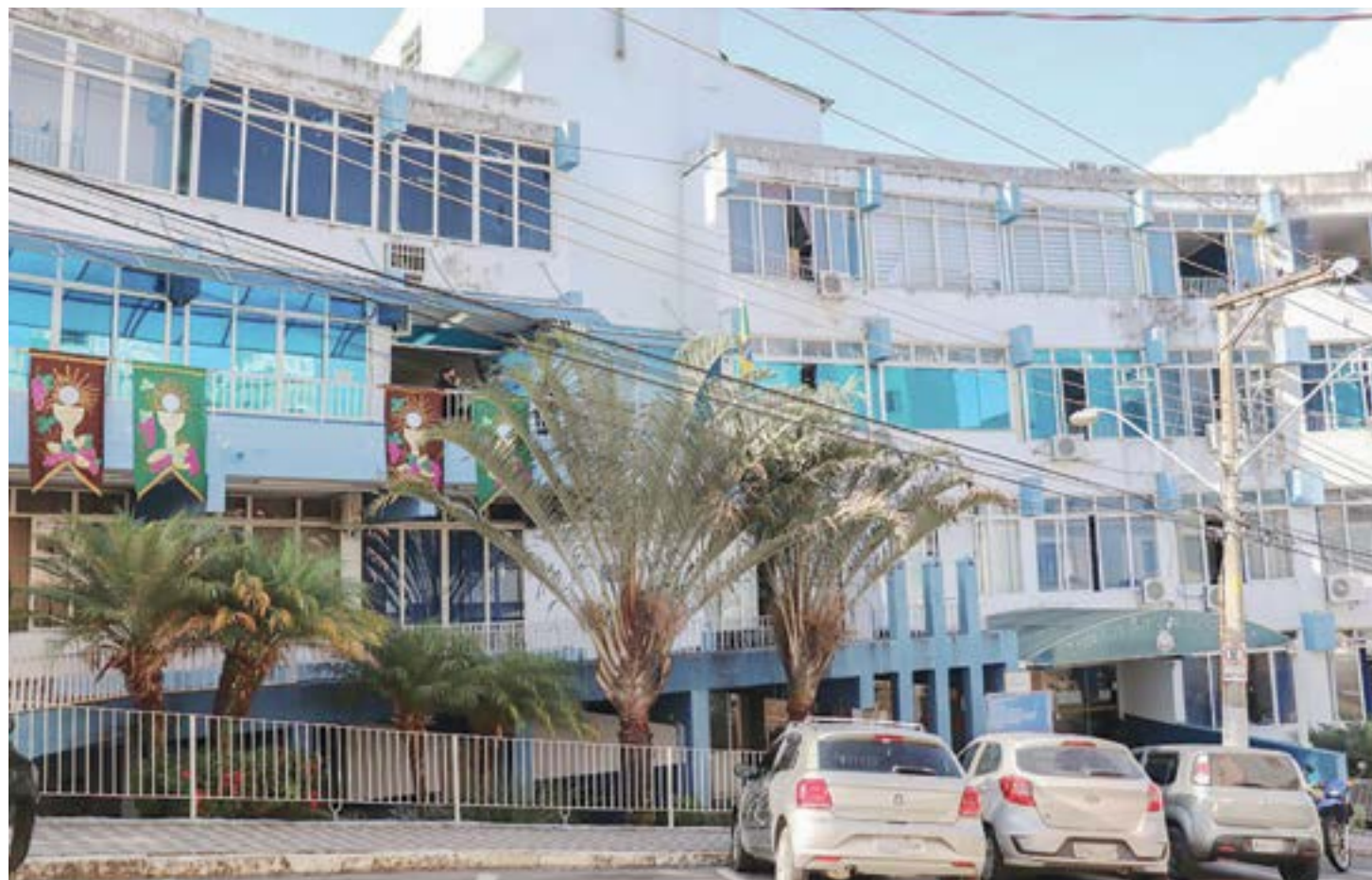
A sede da Prefeitura de Aparecida; depois de enfrentar derrota judicial sobre caso, Executivo consegue liberar 26 cargos comissionados

No ano passado, a Câmara de Aparecida aprovou, em sessão extraordinária, o projeto que implantava uma reestruturação administrativa no Município. O texto foi aprovado por 5 votos a 3 e a sessão extraordinária foi realizada com a assinatura de seis vereadores. O Ministério