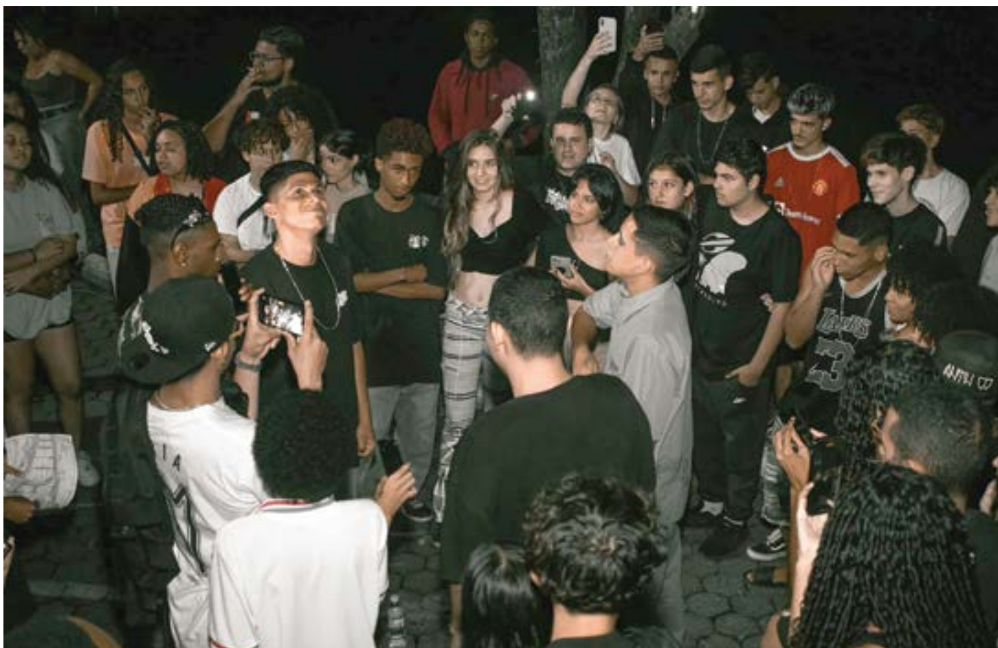
Batalha de rimas no Parque Ecológico em Cachoeira Paulista; secretaria de Cultura cadastra artistas para participação na Lei Paulo Gustavo

Do total previsto de R$314.659,27, serão destinados R$ 166.690,54 ao apoio às produções audiovisuais, R$ 38.116,51 ao apoio às sa-