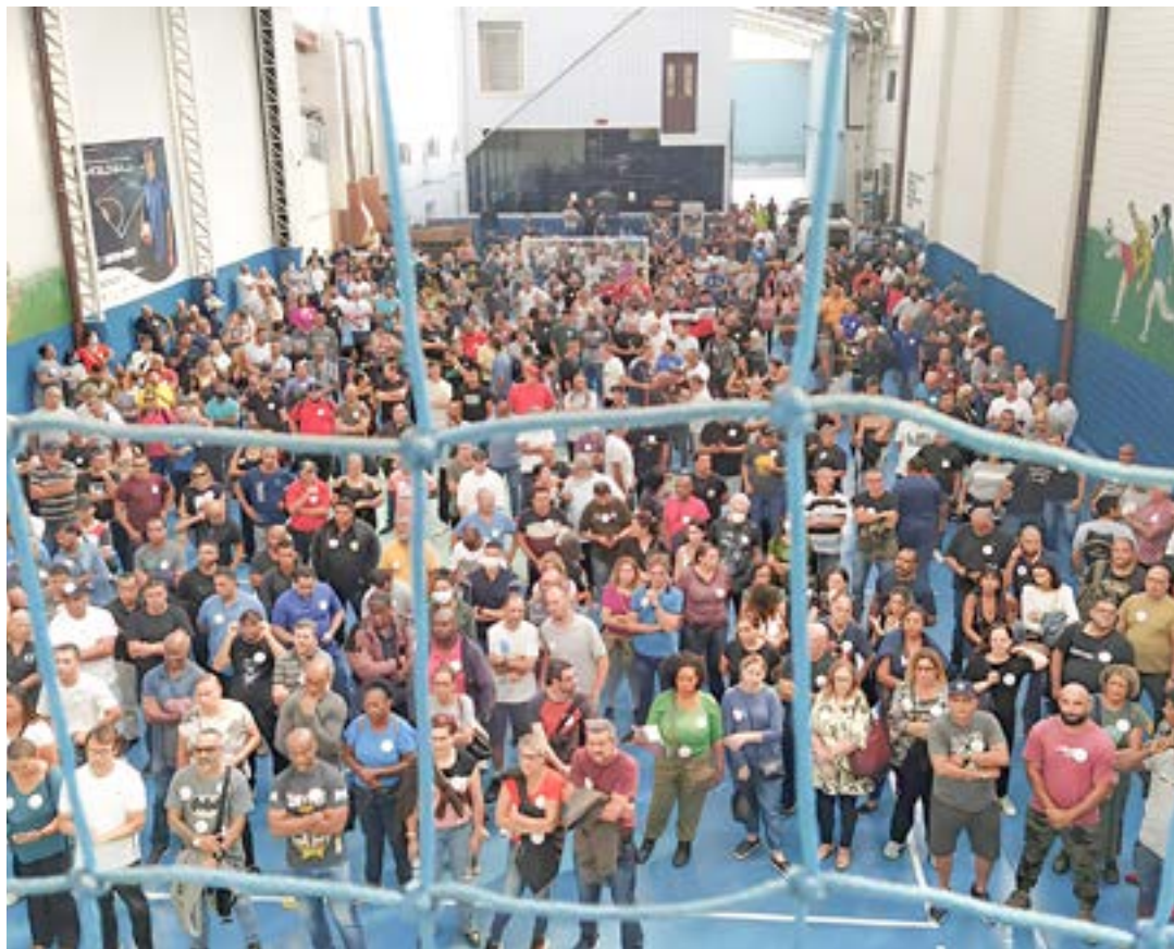
Movimento de greve entre funcionários da Fundação Casa; região tem quatro unidades semiparalisadas

A paralisação foi anunciada após a categoria rejeitar, em assembleia realizada em São Paulo, a proposta de reajuste salarial de 6% feita pelo Governo do Estado na terça-feira (2). Na pauta de reivindicações, os grevistas exigem que a atual gestão estadual e a direção da