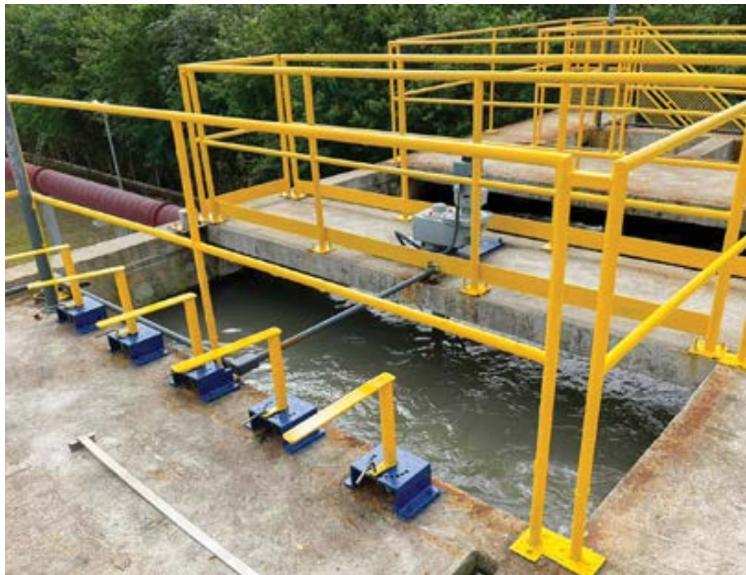
Estação de Tratamento do Pedregulho, em Guaratinguetá; Saeg anuncia trabalho de reforma para ampliação

O investimento está sendo feito com recursos da própria Saeg, oriundos da economia da autarquia. Segundo o diretor-presidente, nos últimos três anos o investimento teve foco na água, e, a partir de agora, tem como foco o esgoto.