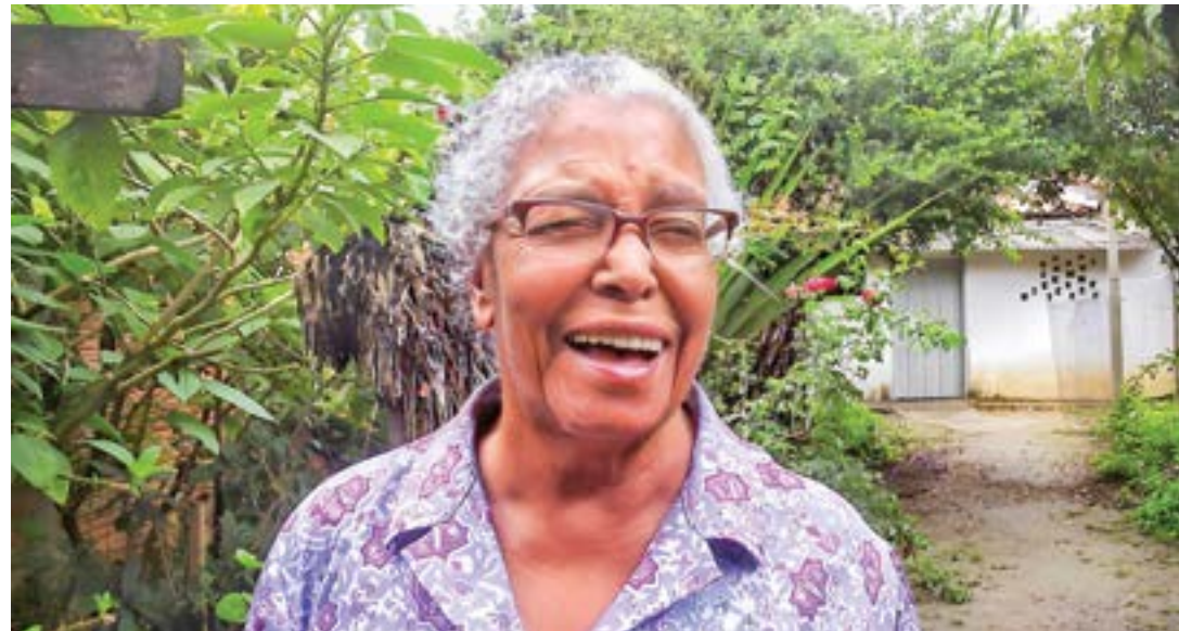
A escritora Ruth Guimarães, um dos ícones da literatura da região; evento foca ações de matrizes africanas