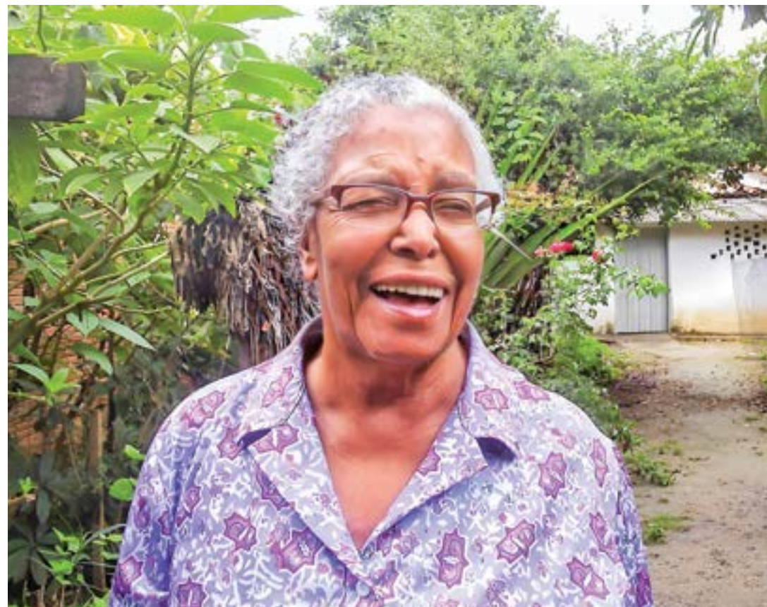
A escritora Ruth Guimarães, um dos ícones da literatura da região; evento foca ações de matrizes africanas