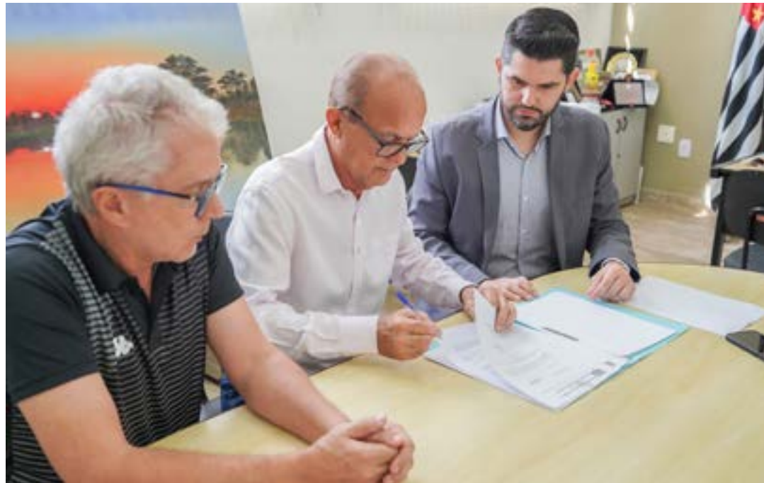
Ballerini assina projeto para implantação da 5G; tecnologia é aposta para setor público e atrair investidores

O 5G move a construção de cidades inteligentes, da