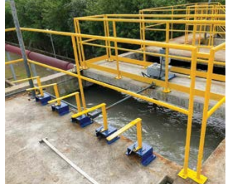
Estação do Pedregulho, que recebeu investimento de R$ 6,5 milhões

A Saeg (Serviço de Água, Esgoto e Resíduos de Guaratinguetá) firmou, na terça-feira (22), contrato com a empresa Montik para a expansão, reforma e ampliação da Estação