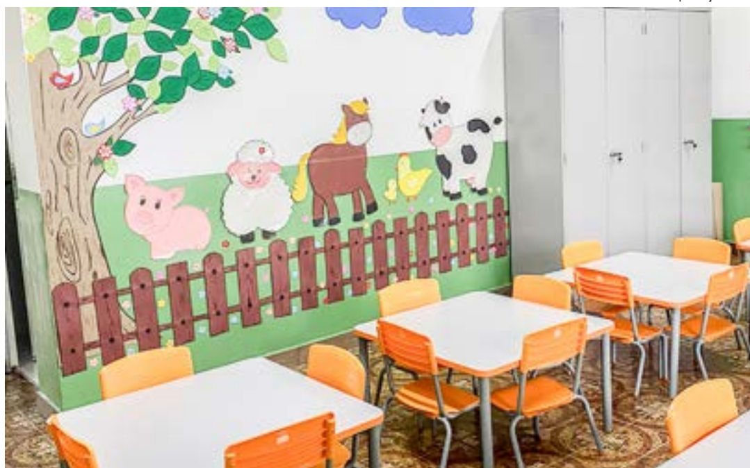
Sala de aula do Centro de Educação Infantil do Cidade Nova, em Pinda; unidade atenderá 136 crianças