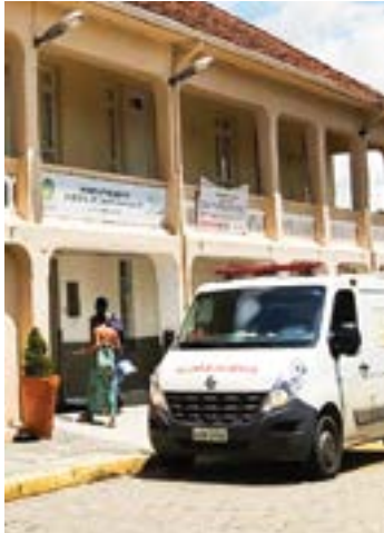
Santa Casa à espera de mudanças