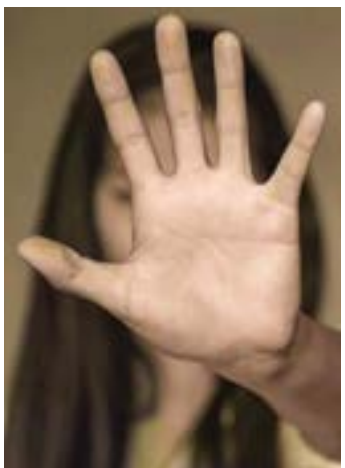
Ação símbolo contra a violência

Combate à violência contra as mulheres. Esse é o objetivo da Campanha Agosto Lilás em todo o Brasil. Em Cruzeiro, a Prefeitura realiza neste sábado (26) uma manhã de atividades para conscientização na praça 9 de Julho, às 9h.