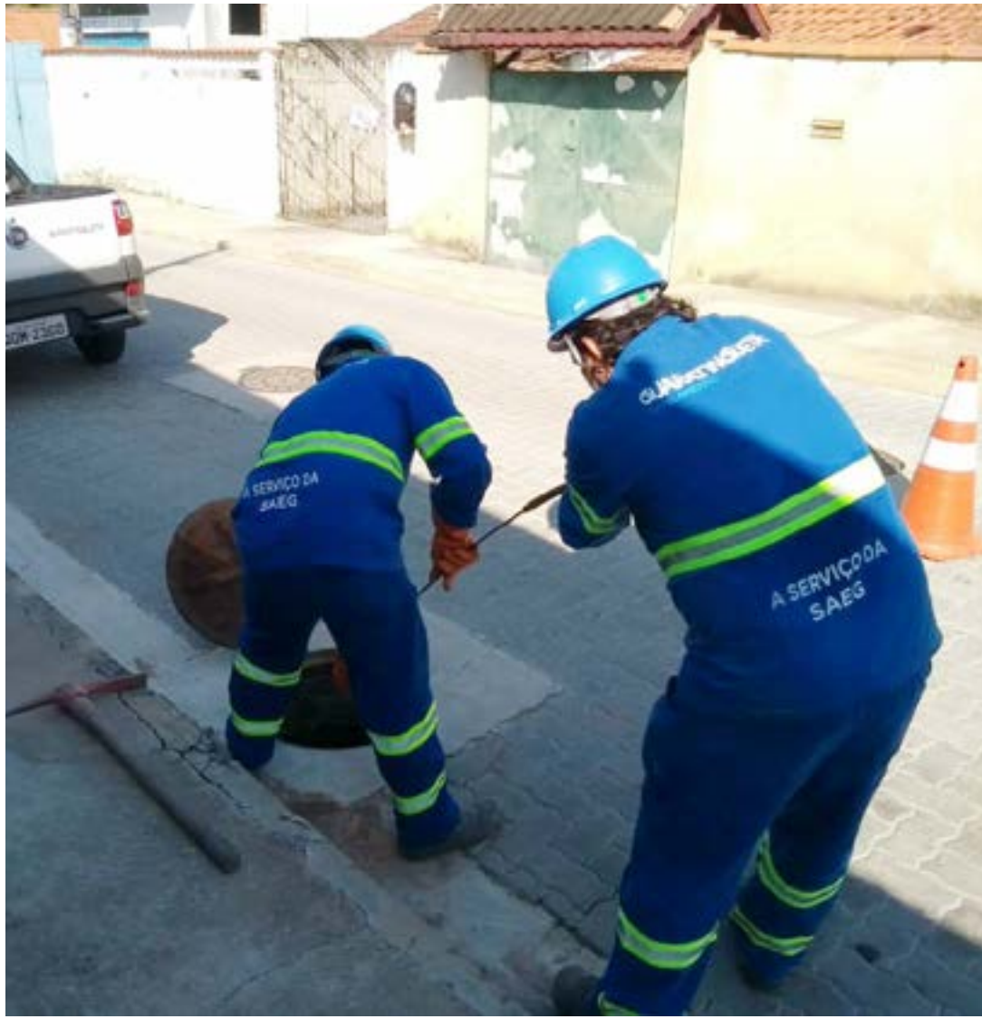
Funcionários da Guaratinguetá Saneamentos durante trabalho; empresa recebe liminar e pode voltar a PPP

Administração municipal e a Guaratinguetá Saneamento travam essa batalha desde que o controle societário da concessionária foi alterado, em 2017, quando a empresa, então CAB Ambiental, passou por um processo de reestruturação e troca de nome para Iguá. Mas foi com a CAB que a Prefeitura e a Saeg (Companhia de Água, Esgoto e Resíduos) desenharam o contrato assinado em 2008, na gestão