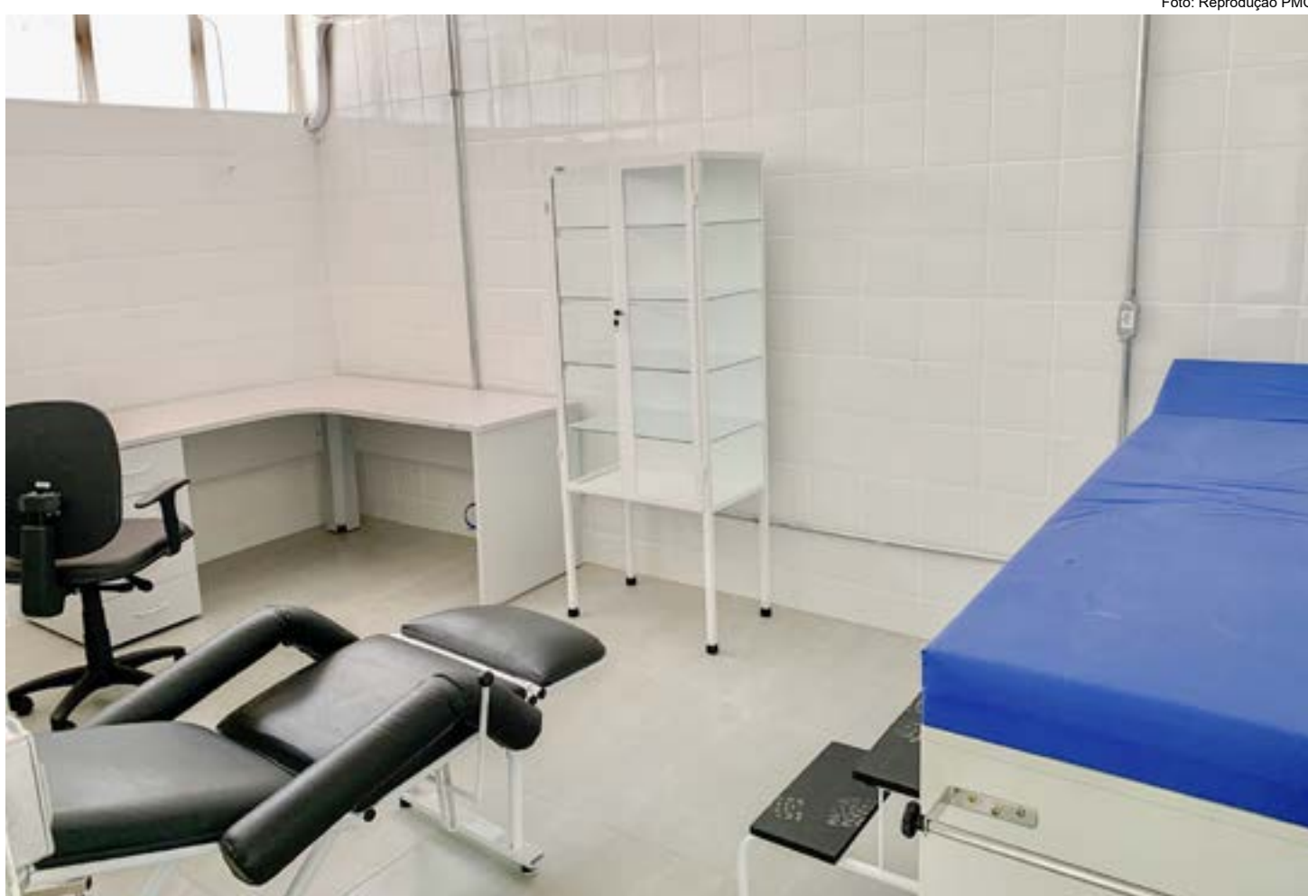
Sala de atendimento na UESF do bairro da Rocinha em Guará, que teve a reforma concluída; Prefeitura mantém investimento para reestruturação

A construção ficou a cargo da empresa Engeplay, em trabalho que abrangeu reformas no telhado, nas esquadrias e alvenaria, ampliação do prédio e pintura. A nova UESF passou a ter dois consultórios, sala de agentes comunitários, farmácia, sanitários, abrigo para resíduo hospitalar, sala de entrega de leite, sala de vacina, sala de procedimentos, recepção, consultório odontológico,