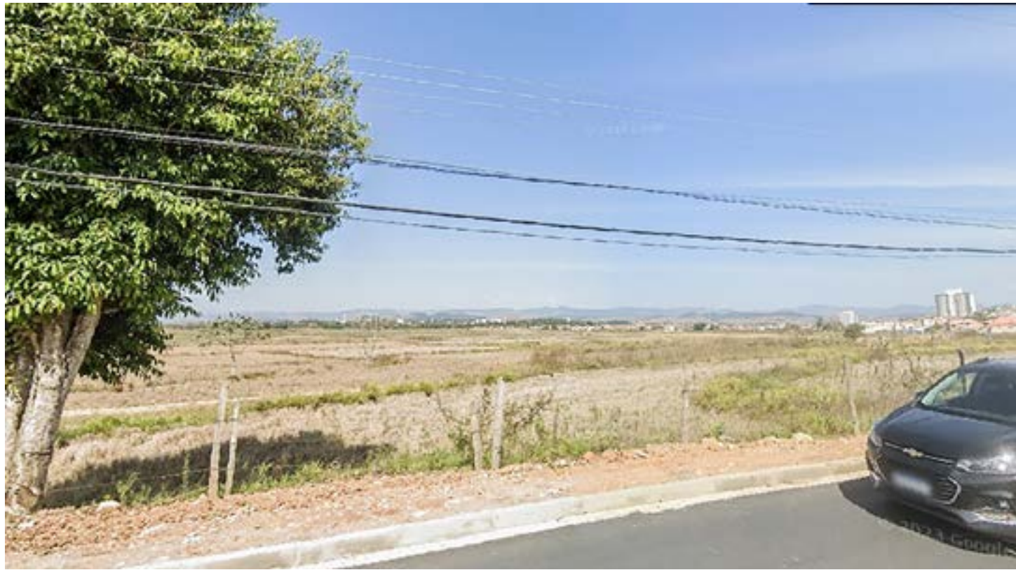
Área do loteamento no bairro Jardim do Vale 2; lotes podem ser comprados a partir da próxima semana, com evento nesta segunda-feira

“Esta é uma grande oportunidade, por se tratar de uma região de Guaratinguetá em franco desenvolvimento, que receberá a construção de dois grandes novos supermercados e novos empreendimentos. A região já possui toda infraestrutura com água, luz, pavimentação, iluminação e