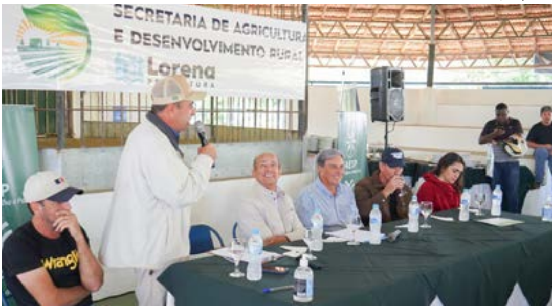
Lançamento do SIM durante Feira Agropecuária; serviço de inspeção tira produtores da clandestinidade