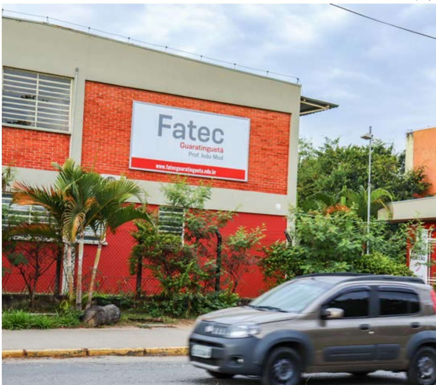
Unidade da Fatec em Guaratinguetá; rede Centro Paula Souza em greve, enquanto sindicato e professores aguardam resposta por parte do Estado

Debate - Em nota enviada à redação do Jornal Atos , o Centro Paula Souza informou que "permanece aberto ao diálogo com o sindicato. A instituição reforça seu compromisso em oferecer educação profissional pública de qualidade, sendo reconhecida pelo desempenho de seus alunos em avaliações nacionais e internacionais e pela empregabilidade de seus egressos".