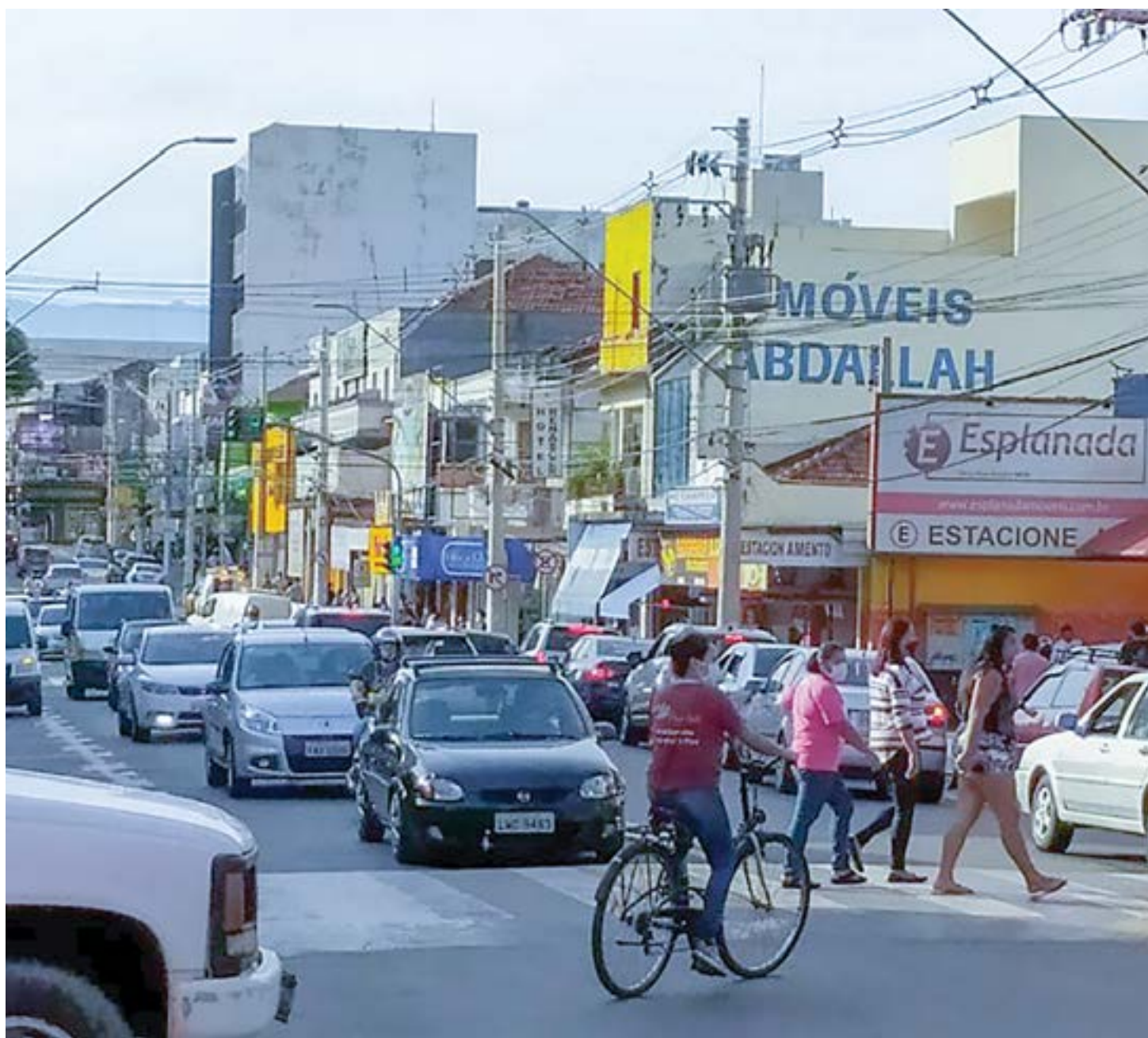
Comércio na região central de Pindamonhangaba, que tem economia movimentada com mais de mil novos postos de trabalho gerados

O secretário de Desenvolvimento Econômico de