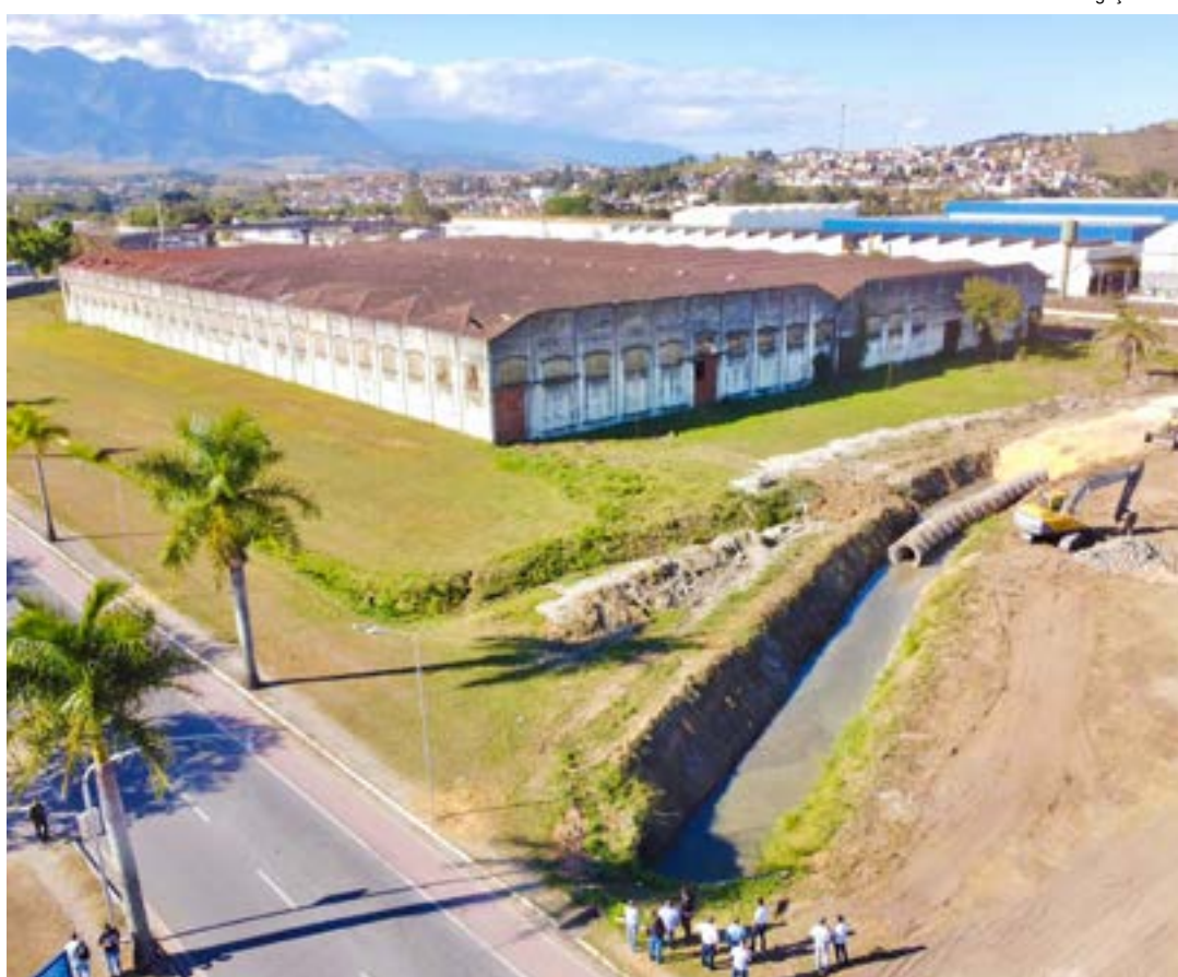
Serviços para adequação de solo para construção do Shopping; grupo Shibata anuncia início das obras

A obra será realizada em uma área de 47 mil m 2 , na rua Doutor Othon Barcellos, no bairro Vila Paulista. Avaliado em aproximadamente R$ 21 milhões e cedido pelo Governo Federal ao Município, em dezembro de 2021,