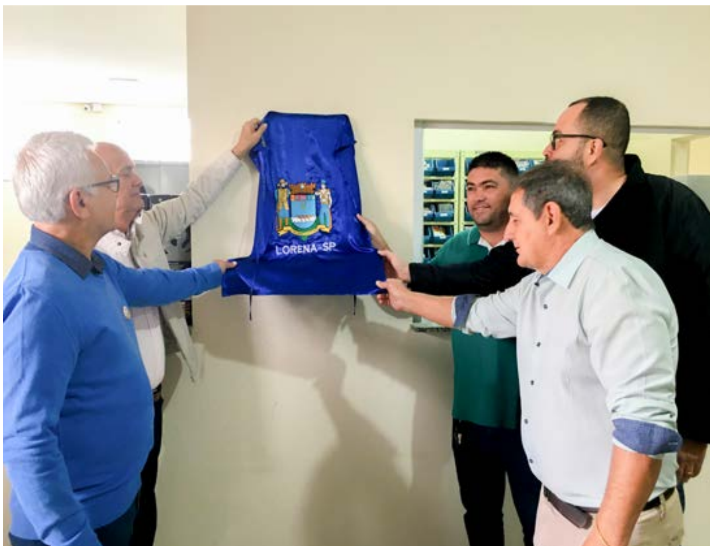
Prefeito Sylvio Ballerini, secretário e vereadores descerram a placa de reinauguração da Unidade Básica de Saúde do Industrial, na terça-feira

UBS Vila Passos – Projetada para atender cerca de mil famílias, a construção da unidade conta com investimento de R$ 1,15 milhão, sendo aproximadamente R$ 320 mil de recursos municipais e R$ 830 mil de uma emenda do deputado Estadual André do Prado (PL) a pedido do vereador Jair Guedes (Podemos).